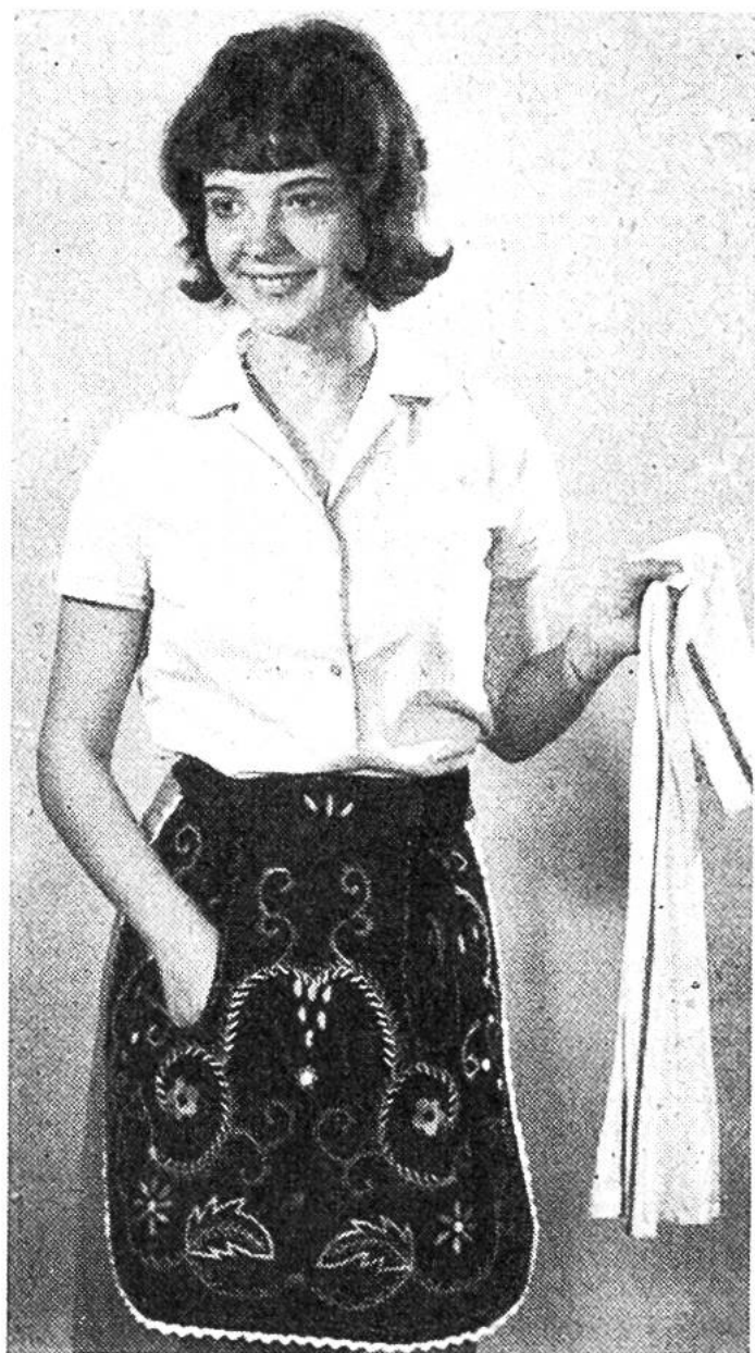
Klammerntasche. Für die bunte Stickerei findet ihr teilweise Zeichnungen auf dem Schnittmusterbogen.

für Muster, die ihr selbst anordnen und nach eigener Phantasie in Stielstich, Hexenstich, Plattstich und Festonstich in verschiedenen Farben sticken könnt.