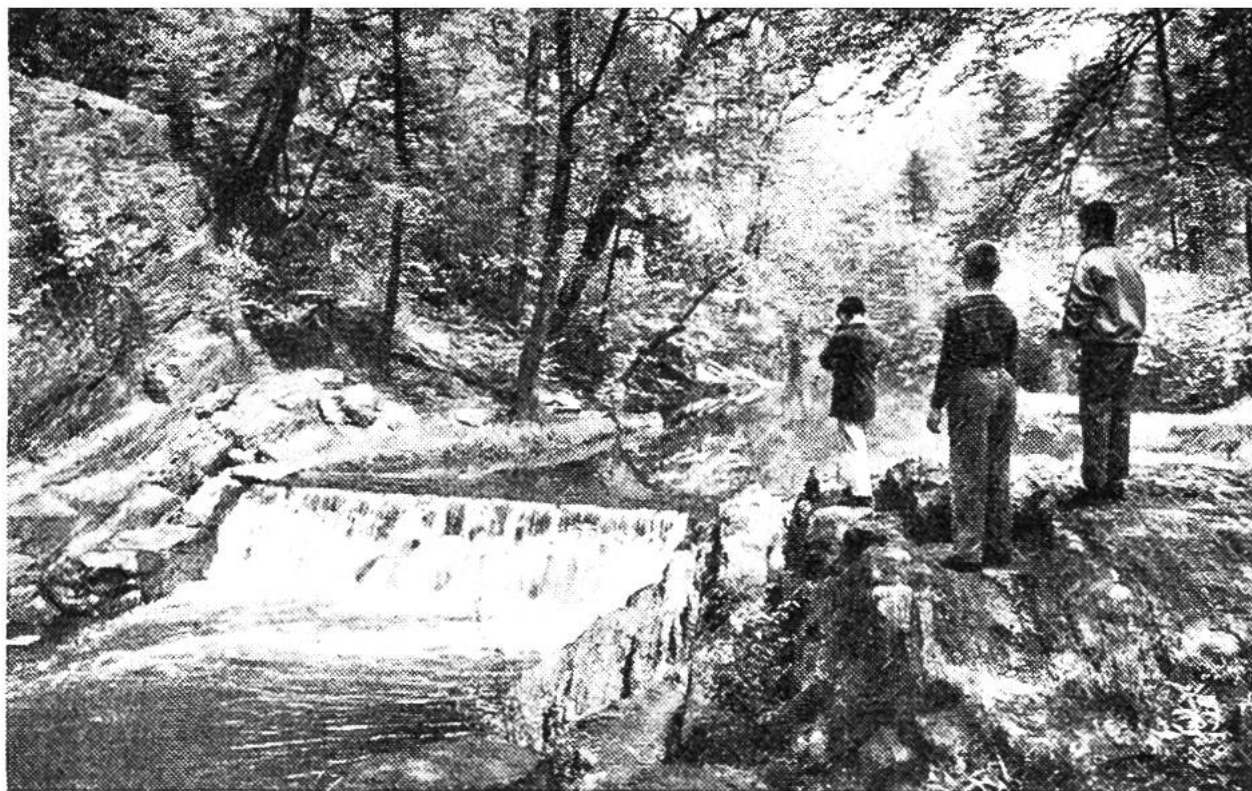
Der Bronx-Fluss im Botanischen Garten von New York ist die einzige Stelle, die noch die Landschaft zeigt, wie sie war, ehe die Stadt, die früher Neu Amsterdam hiess, erbaut wurde.

schen Garten erhalten. Dieser verfiel jedoch nach einiger Zeit. Durch die Naturforschenden Gesellschaften wurde dann erst 1646 der Botanische Garten in Zürich gegründet, im 18. Jahrhundert derjenige von Bern. Jetzt sind die botanischen Gärten oft an Universitäten angeschlossen, da sie den Studierenden das Anschauungs- und Versuchsmaterial liefern können. Dabei zeigte sich sehr bald die Notwendigkeit, das nötige Schrifttum über die Pflanzen in der Nähe zu haben und auch durch Anlegen von Herbarien einen Vergleich mit den Pflanzen zu ermöglichen, die nicht gerade lebend zur Hand sind. So kommt es, dass die jetzigen botanischen Gärten alle mit Bibliotheken und Herbarien ausgestattet sind. Der Botanische Garten von New York hat, den Ausmassen der Stadt entsprechend, die grösste Anzahl Bücher: 65000. Dazu kommen noch etwa 300000 Manuskripte und Kataloge. Das Herbarium umfasst drei Millionen Pflanzen. Seit 1900 werden dort jeden Samstagnachmittag von Oktober bis Mai Kurse und Vorträge abgehalten; ausserdem finden Abendkurse