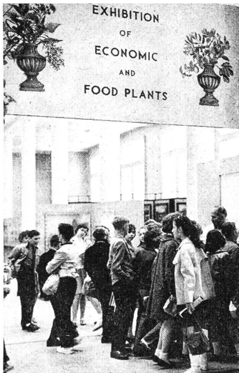
Im Museum des Botanischen Gartens von New York bemüht man sich, durch Sonderausstellungen, z.B. über wirtschaftlich wertvolle Pflanzen, insbesondere den Kindern die Pflanzenwelt nahezu bringen.

botanischen Garten anlegte, der aber ausdrücklich nur Heilpflanzen enthalten sollte, die zur Herstellung von Drogen benutzt wurden. Die berühmten Kew Gardens in London entstanden erst 1759. Hier wird der wertvolle Index kewensis erstellt, das ist die alphabetische Liste aller uns bekannten blühenden Pflanzen, eine Liste, die noch immer weiter ergänzt wird. Die Gartenleitung veranstaltet Ausstellungen und Kurse und hat schon viele wertvolle Expeditionen ausgeschickt, die für die Erforschung der Pflanzenwelt von Wichtigkeit waren. Man rechnet mit etwa einer Million Besucher pro Jahr.