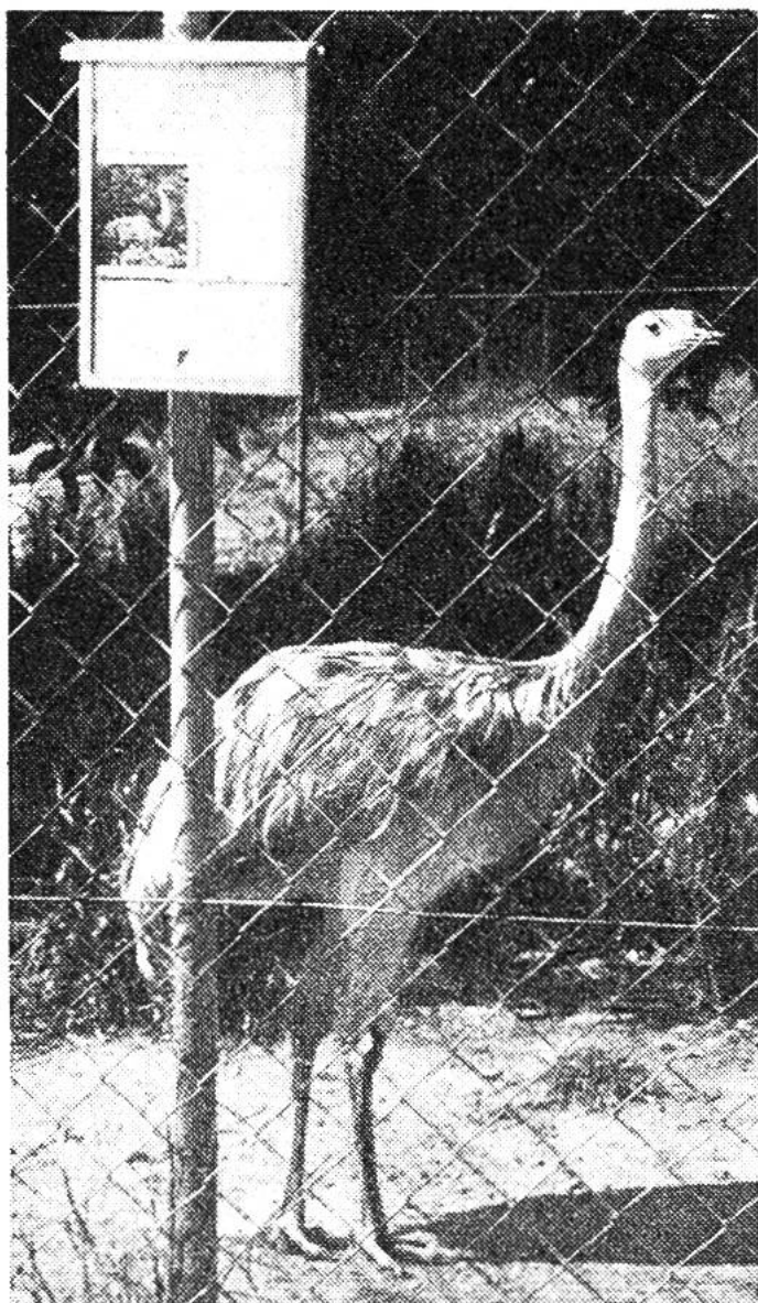
Zu den grundlegenden Aufgaben der Tiergarten-Biologie gehören zweckmässige Namensschilder.

Linie für den Menschen, nicht für die Tiere. Der Mensch soll sich im Zoo erholen und entspannen; er soll sich darin aber auch zoologisches Wissen aneignen. Dabei sind die Anschriften, die Namensschilder, von Bedeutung. Die Tiergarten-Biologie hat herauszufinden, mit welchen technischen und psychologischen Mitteln man dem Zoobesucher am meisten zu bieten vermag. In den Aufgabenkreis der Tiergarten-Biologie gehört weiterhin die Unfallverhütung beim Wärterpersonal. Unfälle im Zoo haben, im Gegensatz etwa zu Fabrikunfällen, hauptsächlich biologische Hintergründe. Es gilt auch, das Publikum vor den Tieren zu sichern; man muss wissen, wie stark ein Gitter,