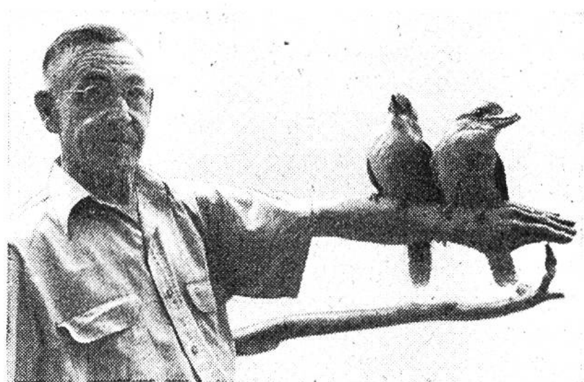
Diese zahmen «Lachenden Hänse» betrachten den Arm ihres Pflegers als einen Ast, auf den man sich setzen kann.

Auch der Mensch spielt, wie erwähnt, in der Tiergarten-Biologie eine Rolle. Schliesslich baut man ja zoologische Gärten in erster