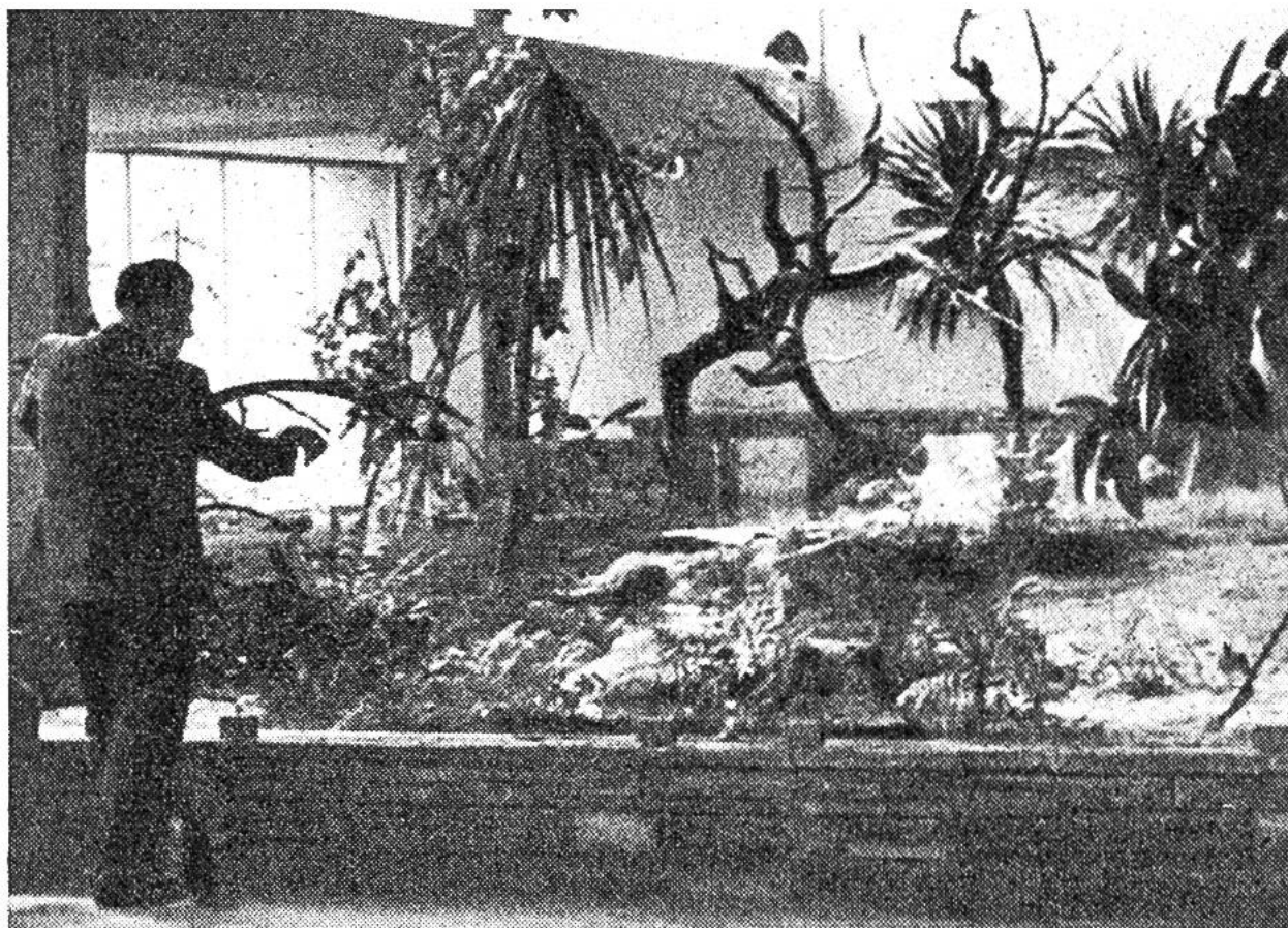
Immer mehr kommt die gruppenweise Haltung von Vögeln in offenen Flugräumen zur Anwendung (Zoo Zürich 1954).

Ersatzfutter noch nicht entdeckt; entsprechend selten sind einstweilen Zuchterfolge. Koalas, die beliebten australischen Beuteltären, kann man nur in Ländern halten, in denen die richtigen Eukalyptusbäume wachsen, weil diese Tiere nur frische Blätter bestimmter Eukalyptus-Arten fressen. Ausserhalb Australiens gibt es daher nur in kalifornischen Zoos Koalas. Vielleicht wird es später gelingen, den entzückenden Pfleglingen die lebenswichtigen Stoffe in Tablettenform mit anderem Futter anzubieten.