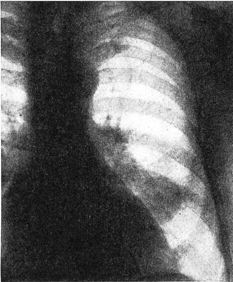
← Lungenkrebs (Fünffranken- stückgrosser Rundschatten →).

allem. Der Gewohnheitsraucher fühlt sich bald von seiner Zigarette abhängig, und das damit verbundene Gefühl ist sicherlich nicht erhebend.