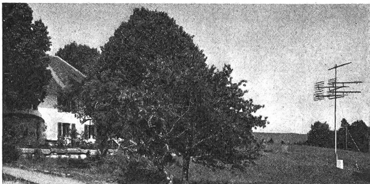
Die Antenne des Drahtfernsehens in Biel steht in erhöhter und störfreier Lage in ländlicher Umgebung und vermittelt deshalb sehr guten Empfang.

auch für die Übertragung von Fernsehprogrammen auf ultrakurzen Frequenzen zu verwenden. Dazu mussten geeignete Vorrichtungen erfunden und andere Anpassungen vorgenommen werden. Diese Arbeiten wurden von Erfolg gekrönt, und es ist somit zum erstenmal in Europa gelungen , das Verteilernetz einer ganzen Stadt ohne Auswechslung der vorhandenen Kabel auch für die Übertragung von drei Fernsehprogrammen zu verwenden. Dabei wird das Netz gleichzeitig von den Abonnenten benutzt, um auch weiterhin nach Belieben drei Radioprogramme niederfrequent zu beziehen, die man mit einem Speziallautsprecher empfängt, oder sechs verschiedene Radioprogramme nach eigener Wahl hochfrequent mit einem normalen Radioapparat durch Anschluss an die Wanddose zu hören.