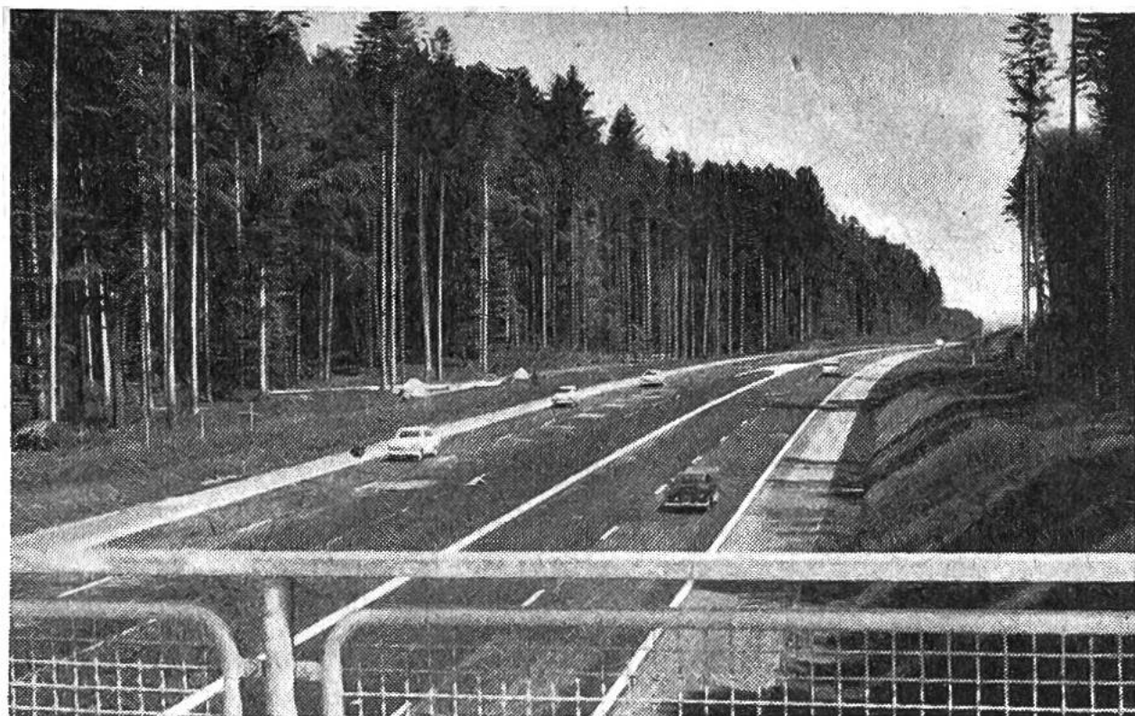
Nationalstrasse N 1. Grauholzstrasse im Betrieb.

der Regel drei Jahre. Im ersten Jahre werden die Kunstbauten, das sind Brücken, Über- und Unterführungen und Stützmauern, erstellt. Im zweiten Jahre führt man mit riesigen Maschinen die Erdarbeiten – wie Dammaufschüttungen und Einschnitte – aus, und im dritten Jahre schliesslich werden mit andern Grossmaschinen (s. Seite 286) Fahrbahn und Strassenbelag eingebaut. Dieses Verfahren für den Bau einer Strecke von durchschnittlich 10 km Länge ist nicht nur in unserem Lande, sondern auch im Autobahnbau unserer Nachbarländer üblich. Die Verwirklichung einer durchgehenden Autobahn hängt aber nicht nur von der Bauzeit der einzelnen Teilstrecken ab, sondern vor allem davon, wie viele Bauabschnitte gleichzeitig und unabhängig voneinander begonnen werden können.