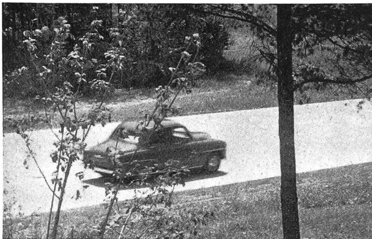
Neun Meter breite Autostrasse Bern-Biel bei Lyss.

Hindernisse auf grössere Entfernung erkennen. Auch bei Nacht und Nässe spiegeln Betondecken nicht. Die Wirkung der lastenverteilenden Platten sichert der Betondecke grosse Tragfähigkeit.