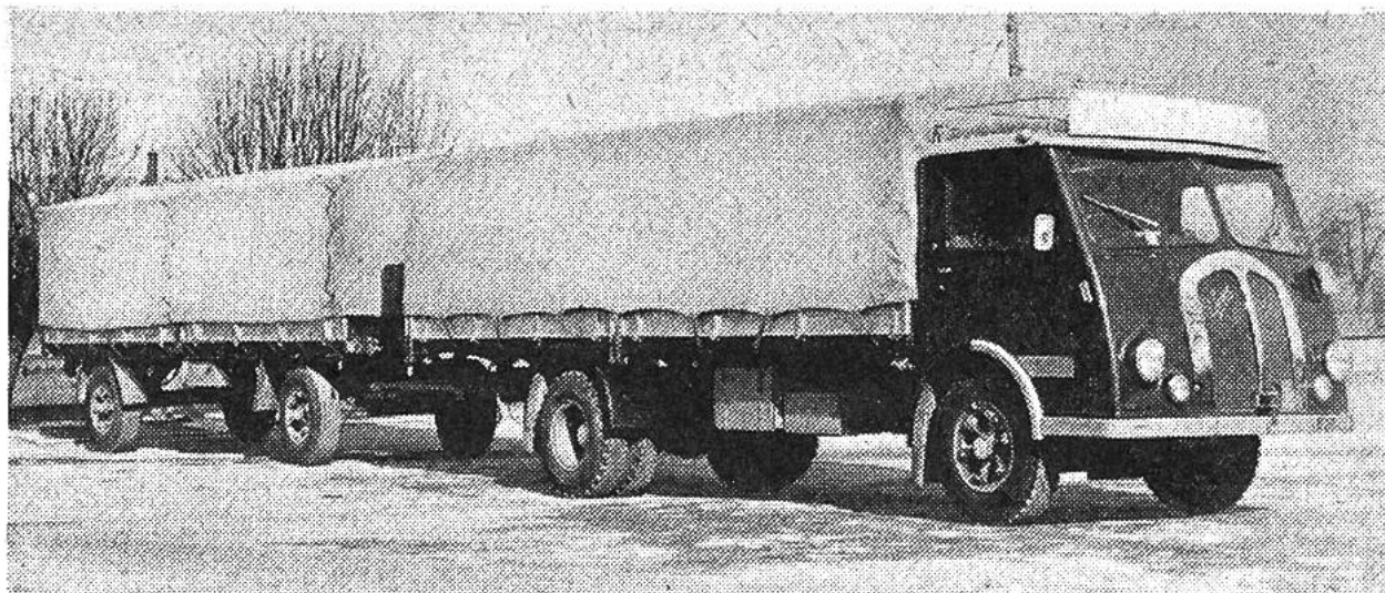
Schweizer Lastwagenzug für Gütertransporte im In- und Ausland.