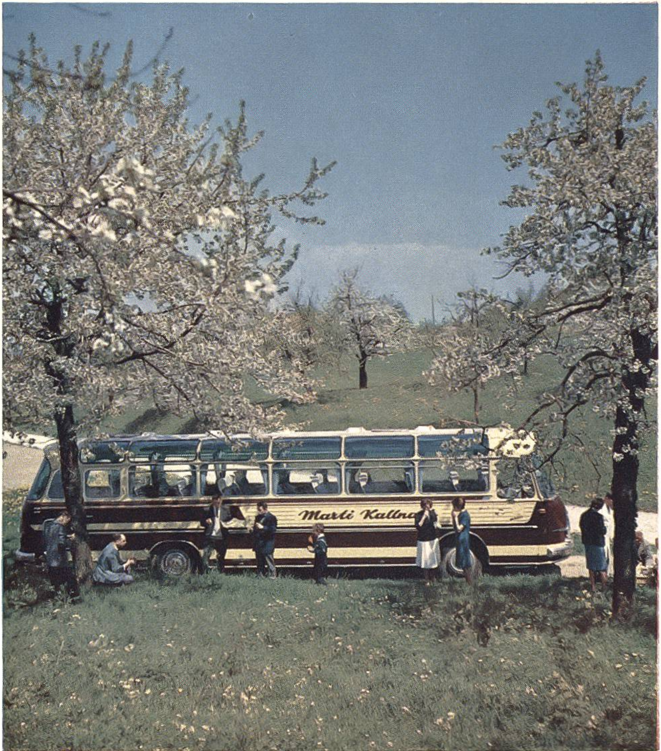
Auf der Fahrt mit dem Reiseкар lernt man die Heimat und fremde Länder kennen.