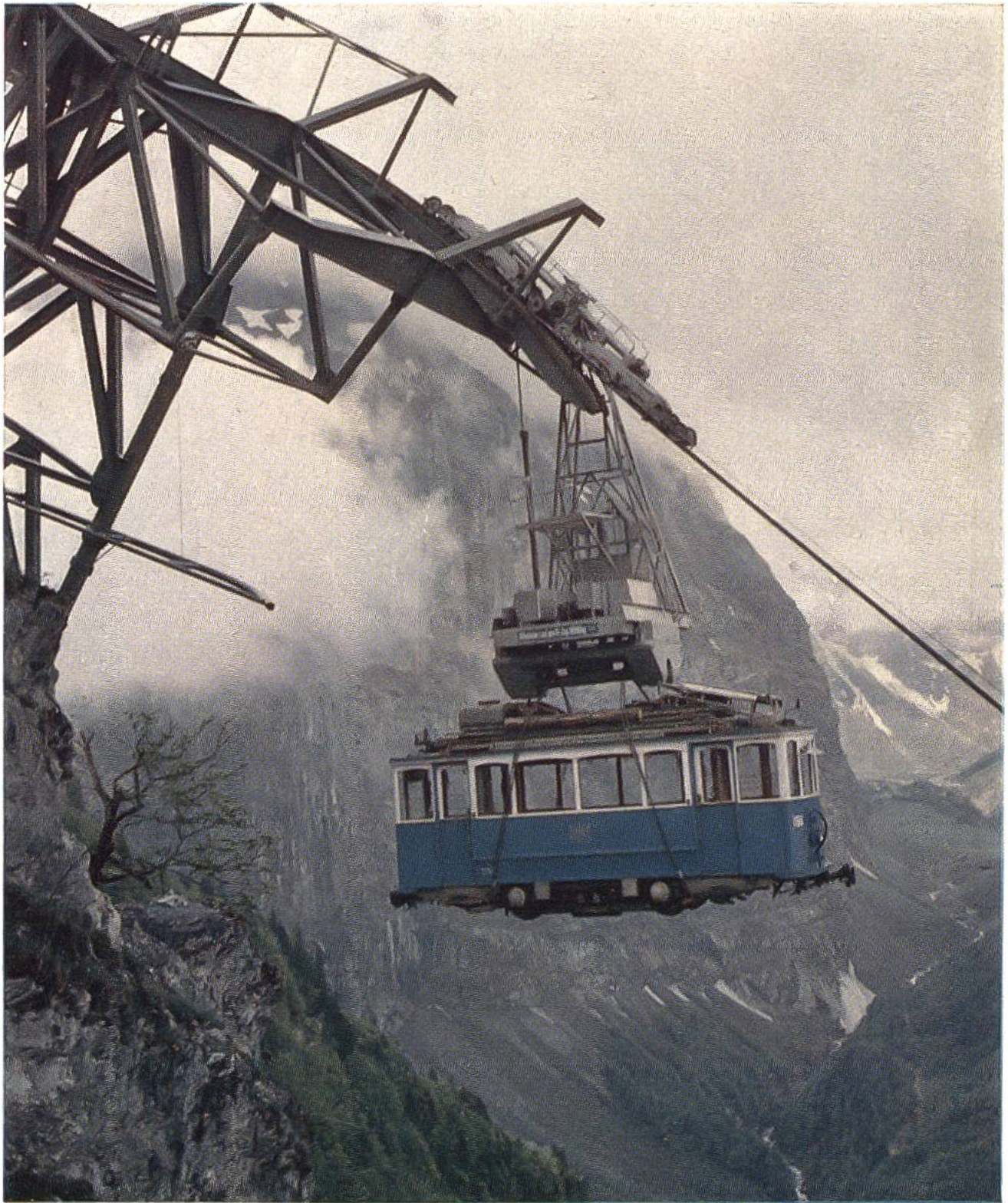
Schwerlastseilbahn Tierfehd (Kraftwerke Linth-Limmern) transportiert einen Zürcher Tramtriebwagen auf die Höhe der Baustelle.