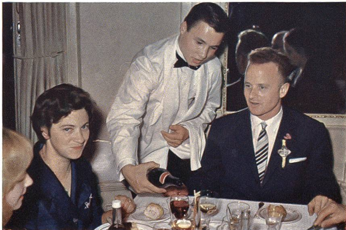
Ein Schüler des Servicekurses beim Einsatz in der Praxis.