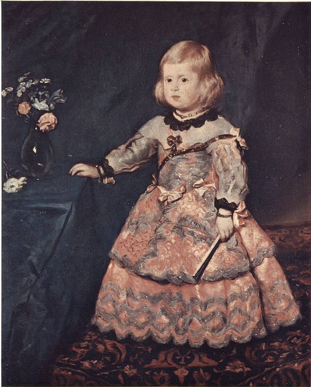
Infantin Margarete, von Diego Velazquez, Sevilla, 1599–1660.