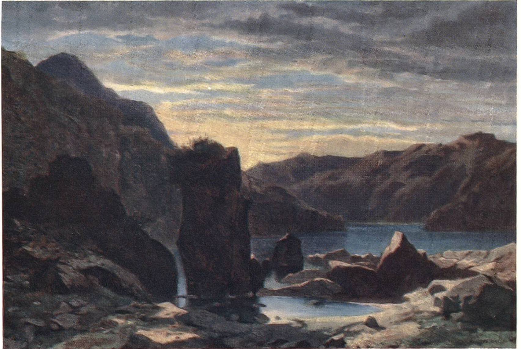
Sonnenuntergang, von Alexandre Calame, * Vevey 1810, † Menton 1864.