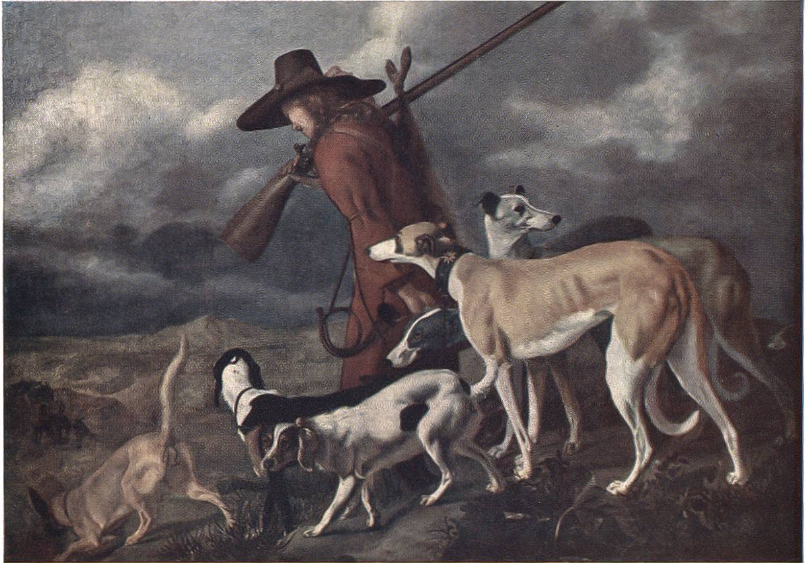
Der Jäger, von Adriaen Cornelisz Beeldemaeker, Den Haag, 1618?–1709. (Rijksmuseum, Amsterdam)