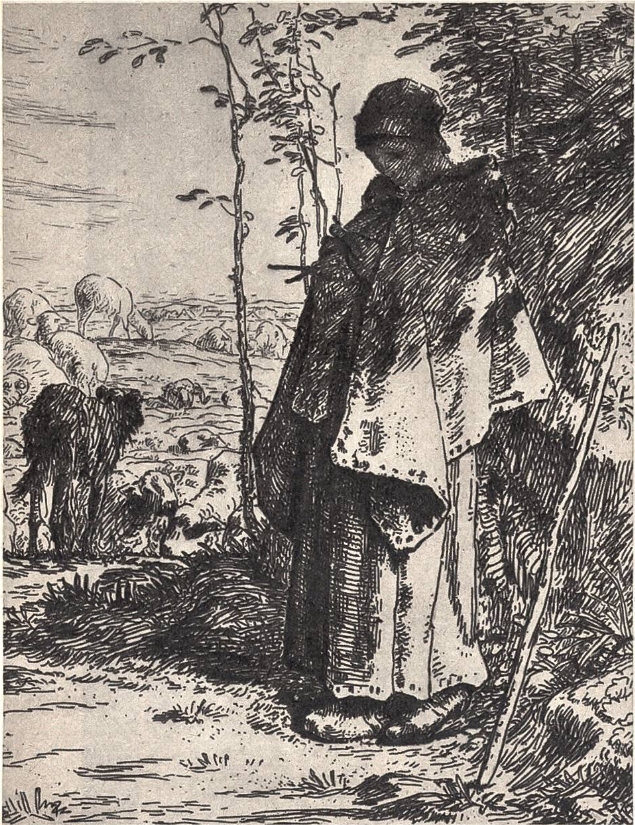
Die Hirtin, Radierung von Jean-François Millet, Barbizon bei Fontainebleau, 1814–1875.