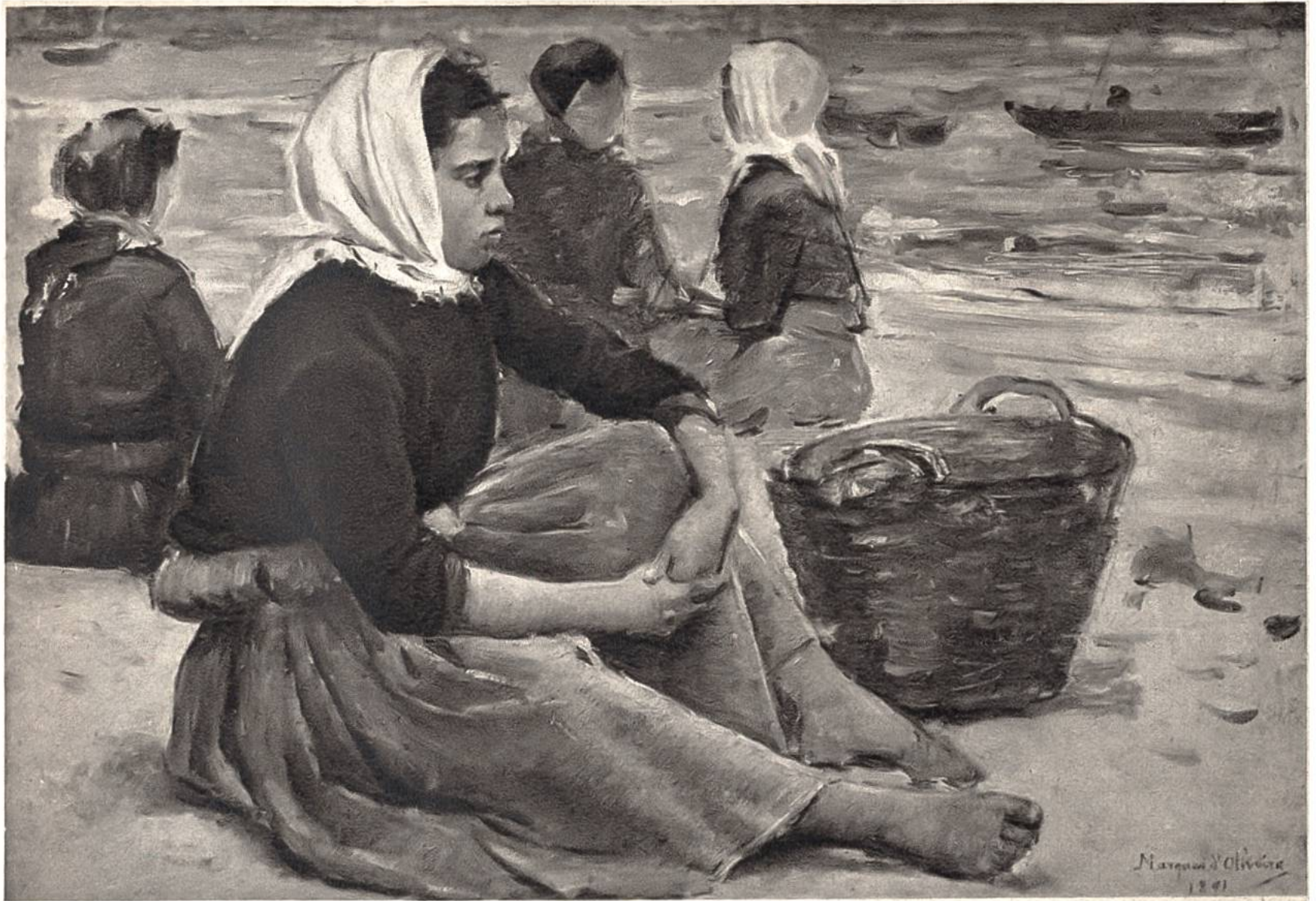
In Erwartung der Fischerbarken, Studie von Marques de Oliveira, Lissabon, 1853–1927. (Nationalmuseum moderner Kunst, Lissabon)