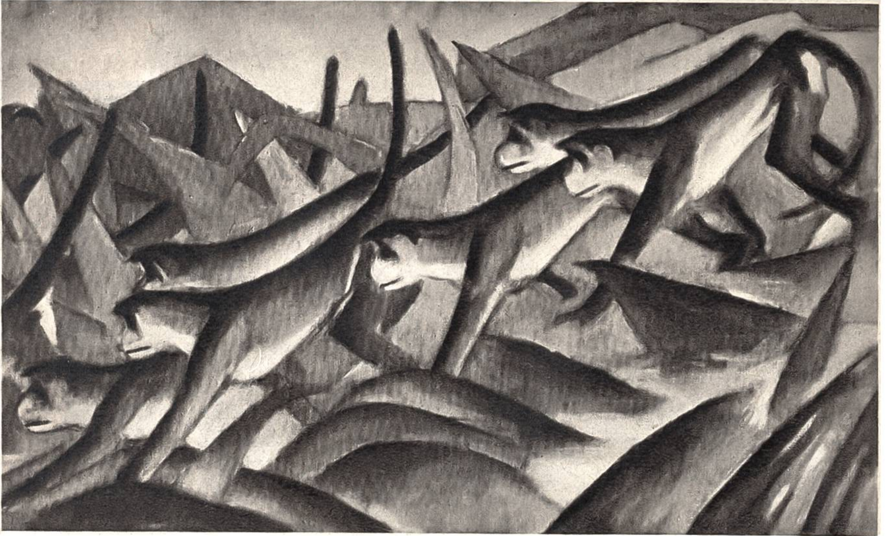
Affenfries, von Franz Marc, München, 1880–1916. (Kunsthalle, Hamburg)