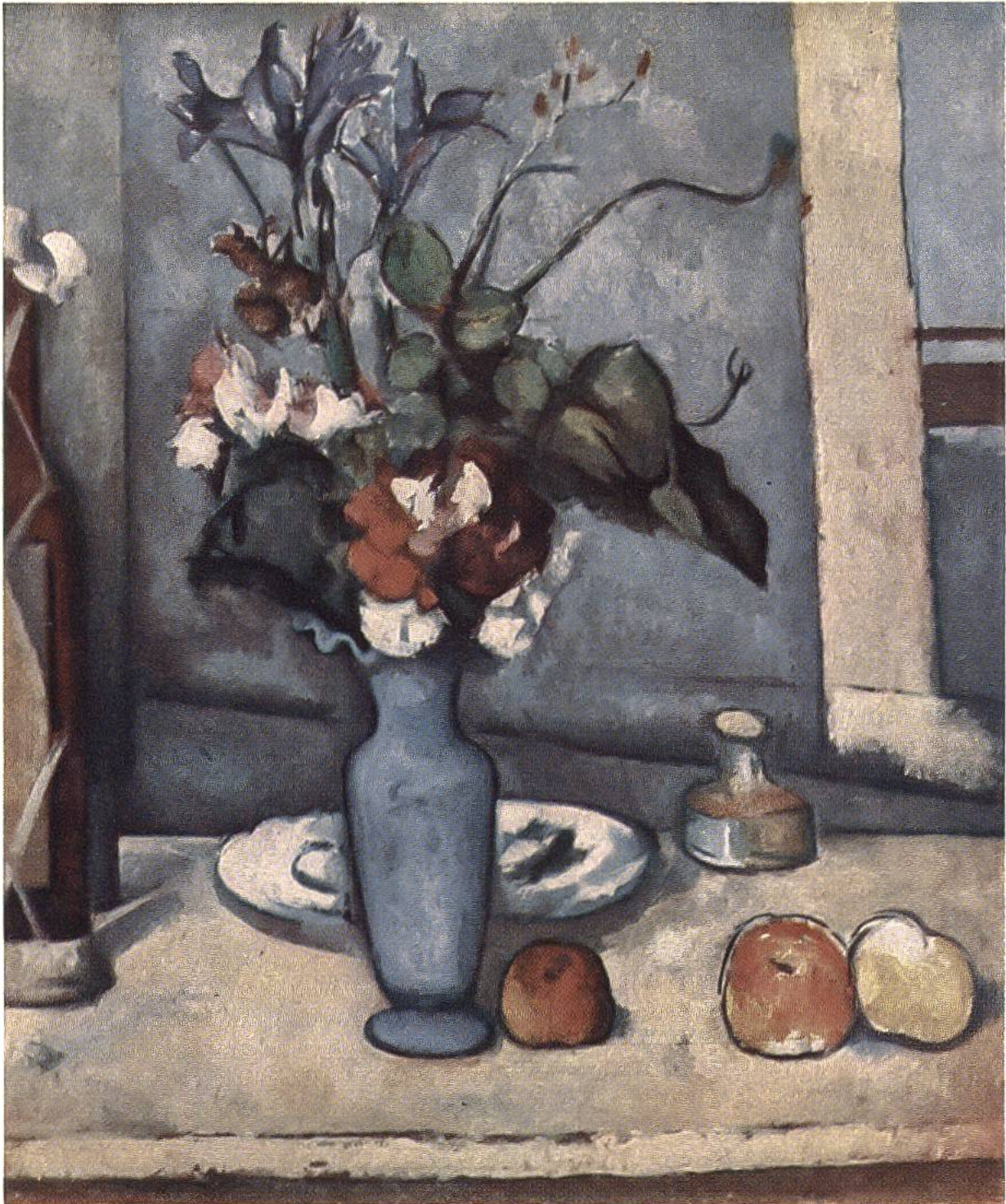
Stilleben mit blauer Vase, von Paul Cézanne, Aix-en-Provence, 1839–1906. (Louvre, Paris)