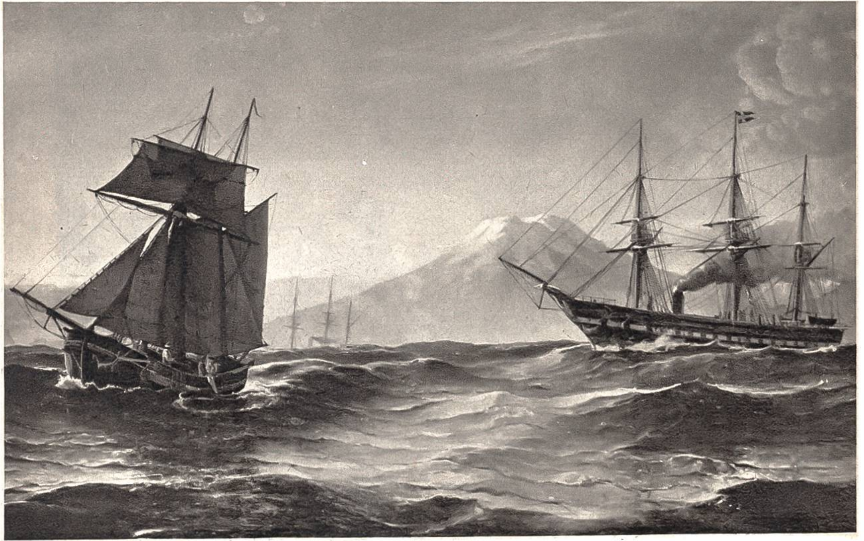
Vor Island, von C.F.Sørensen, Kopenhagen, 1818–1879. (Kunstmuseum, Kopenhagen)