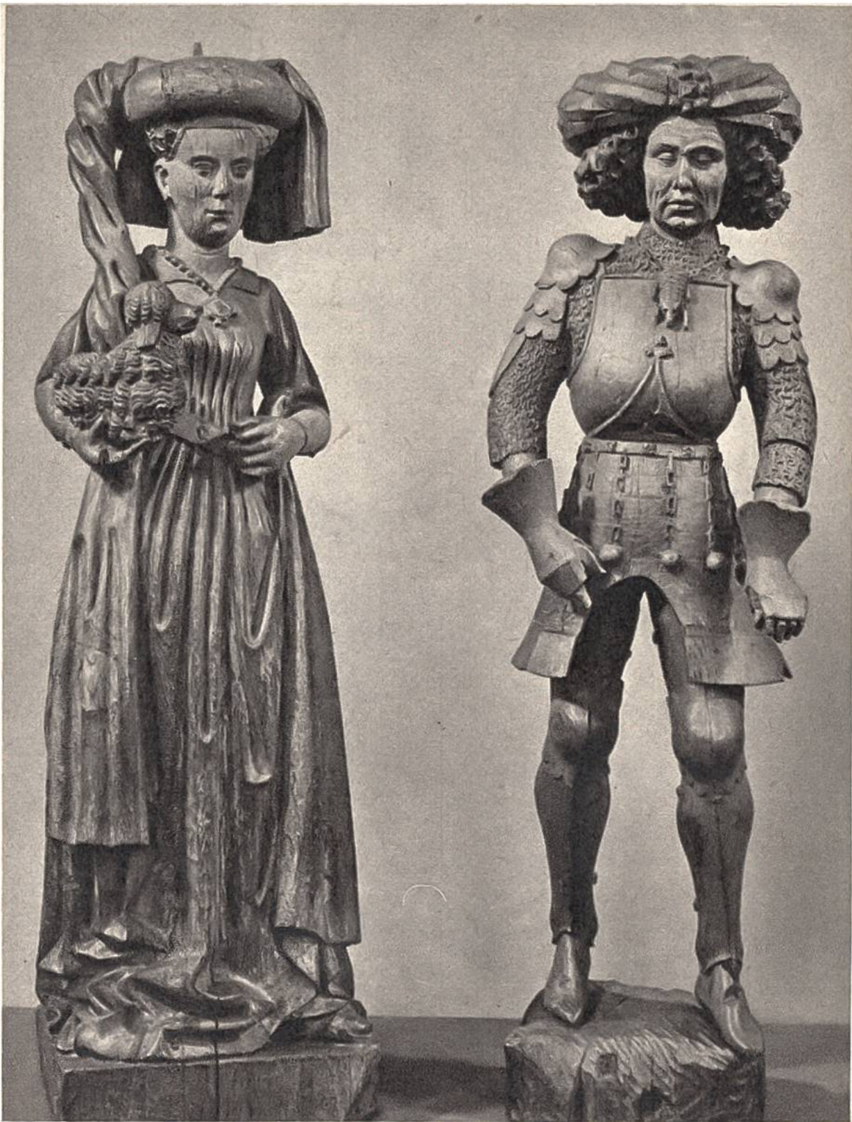
Isabella von Portugal und Philipp der Gute, Eltern Karls des Kühnen. Nordniederländische Eichenholzschnitzerei, ca. 1475. (Rijksmuseum, Amsterdam)