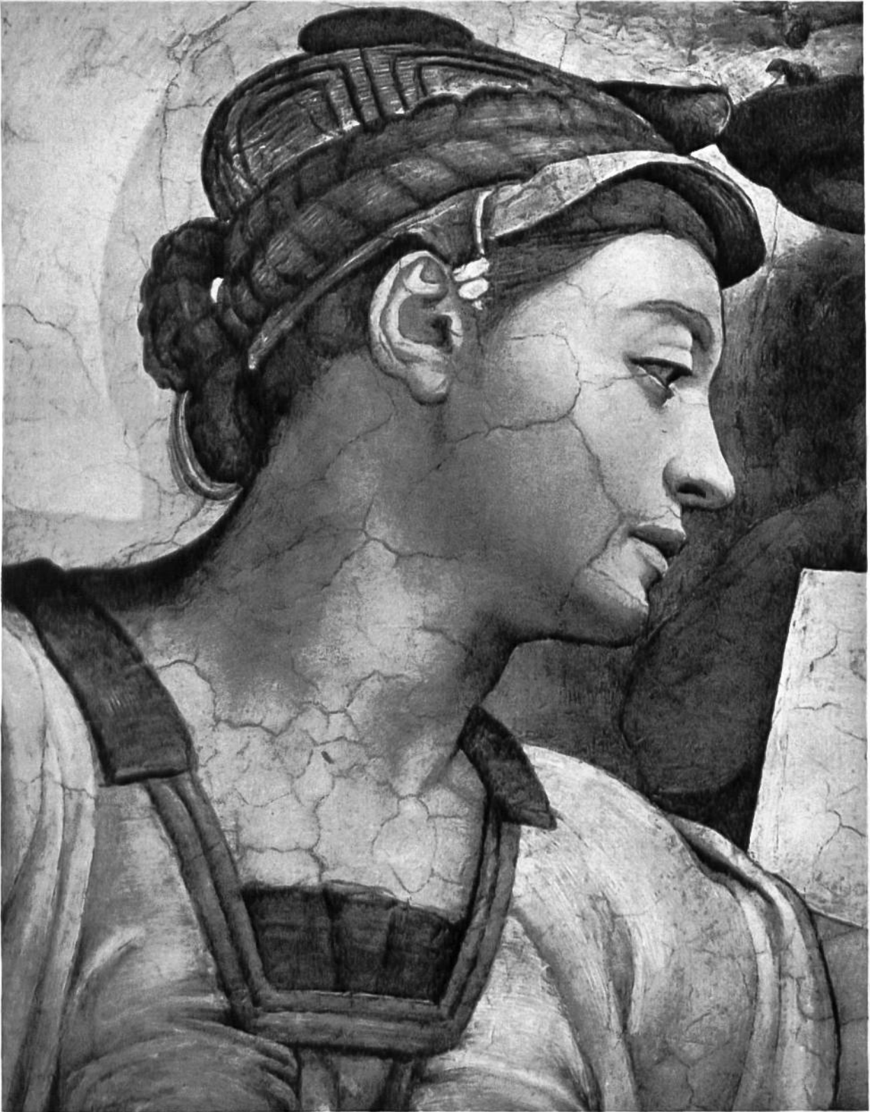
Sibylle von Eritrea, Deckengemälde in der Sixtinischen Kapelle des Vatikans, von Michelangelo, Rom, 1475–1564.