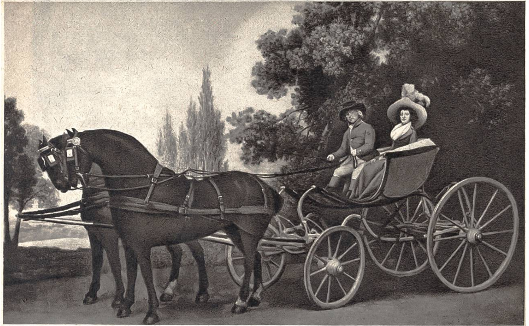
Spazierfahrt im Phaëton (vierrädriger Kutschwagen), von George Stubbs, Liverpool, 1724–1806. (National Gallery, London)