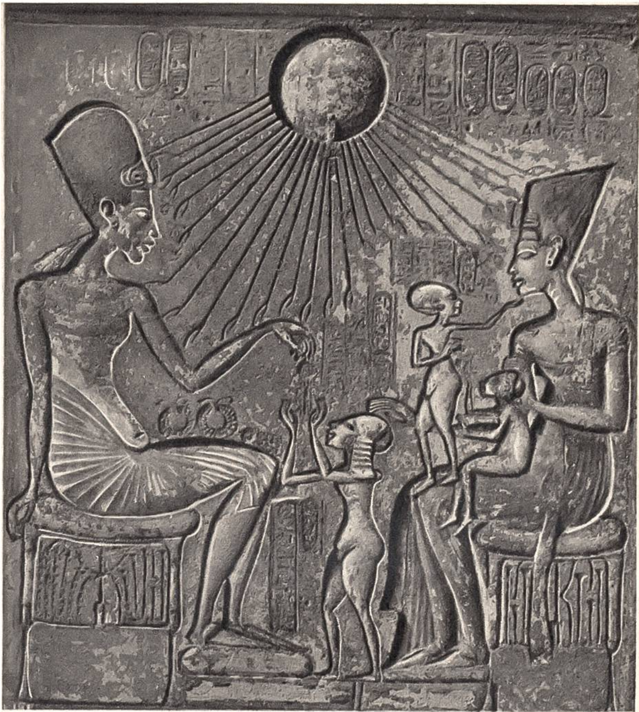
Ägyptische Königsfamilie, Kalksteinrelief von El-Amarna, um 1800 v. Chr. (Ägyptisches Museum, Kairo)