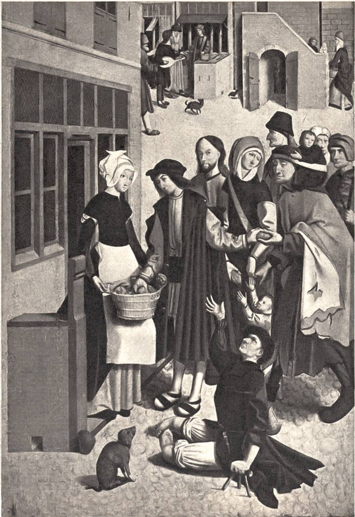
Speisung der Hungernden, Malerei auf Eichenholz vom niederländischen Meister von Alkmaar, vor 1490–1540. (Rijksmuseum, Amsterdam)