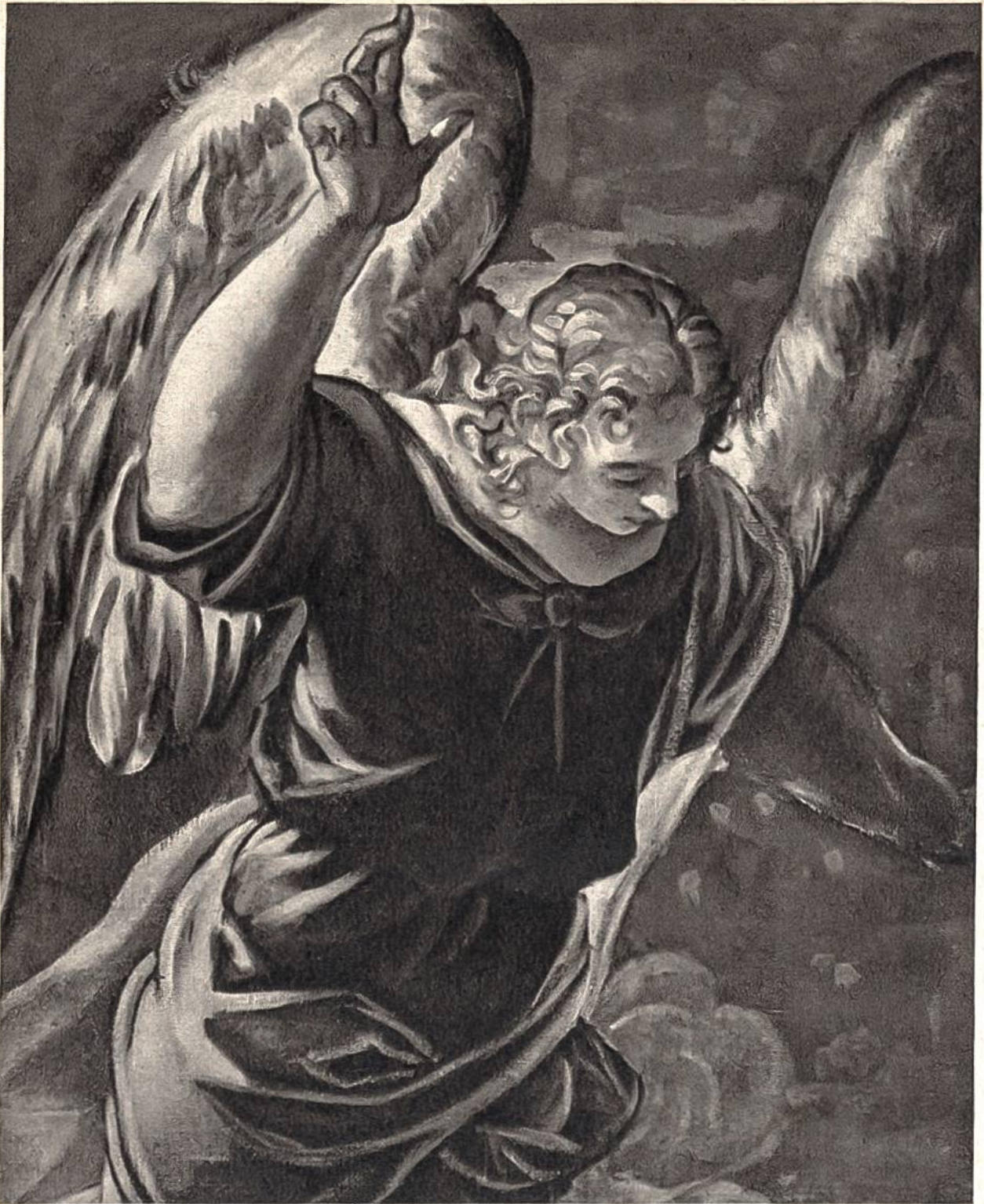
Engel, aus einem Gemälde von Tintoretto, Venedig, 1518–1594. (Rijksmuseum, Amsterdam)