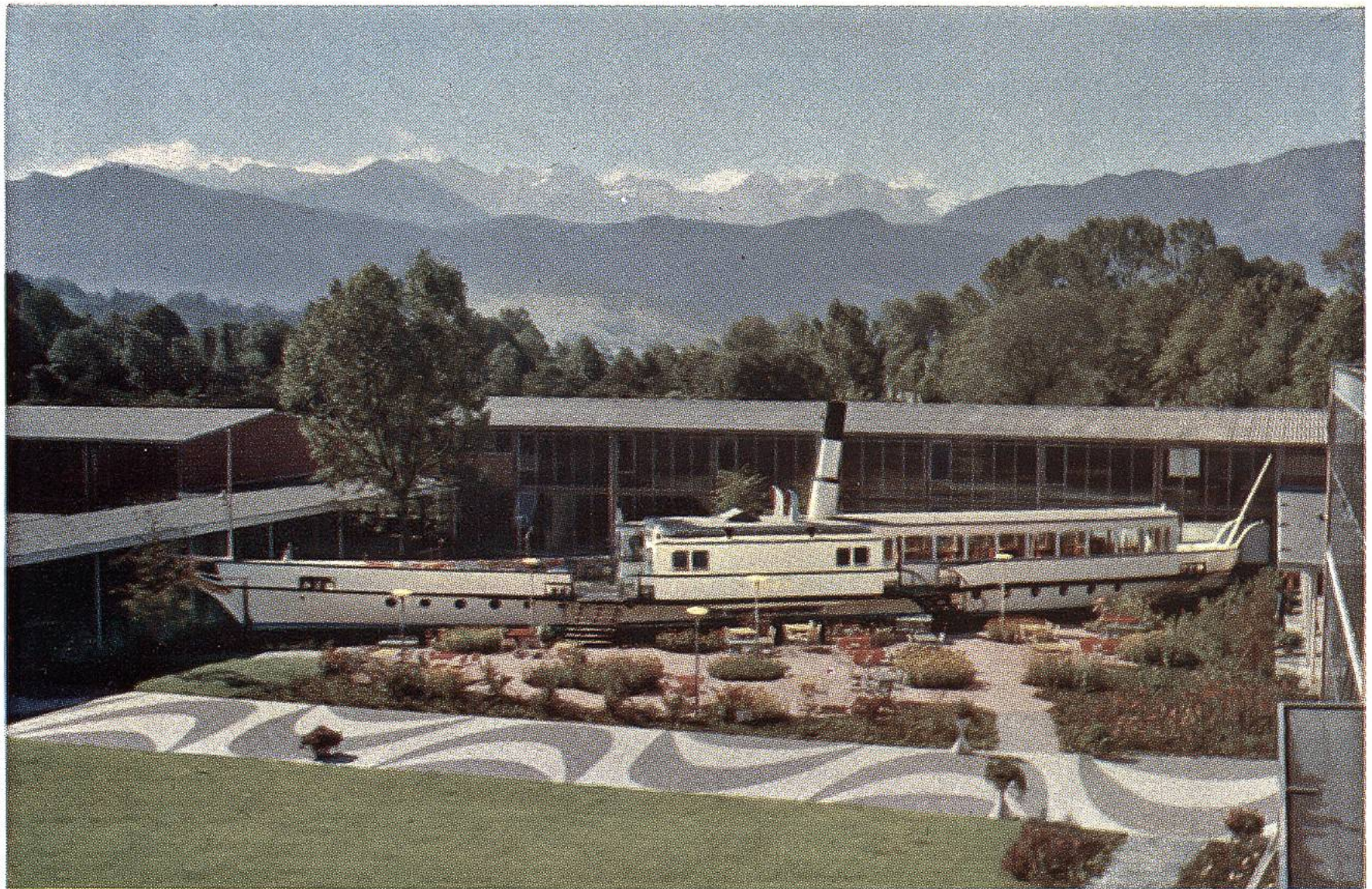
Gartenhof des am Ende der Seepromenade Luzerns gelegenen Verkehrshauses der Schweiz (Schweizerisches Verkehrsmuseum) mit dem Dampfschiff «Rigi», dem ältesten Dampfschiff der Schweiz (1847).