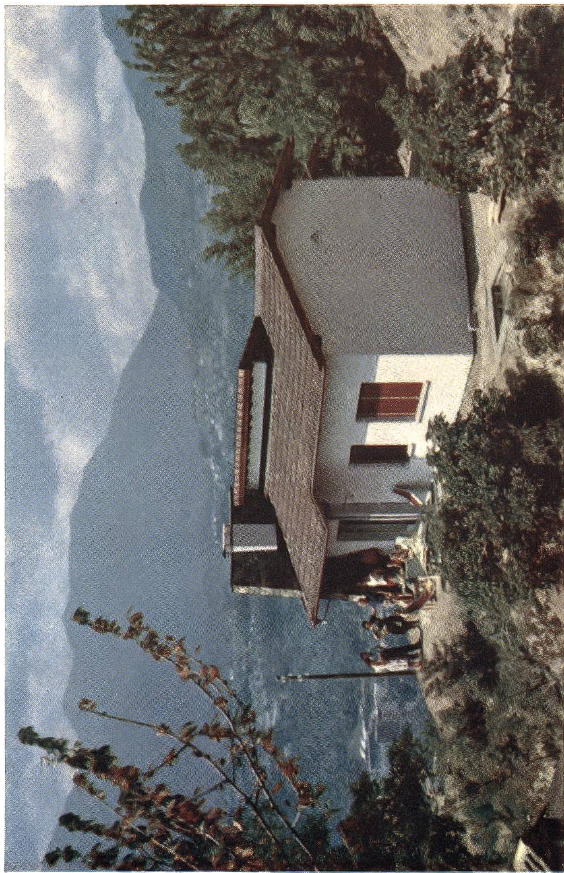
Die «Casa Sciaffusa» im Feriendorf der 25 Kantone in Albonago ob Lugano, das die Schweizer Reisekasse speziell für Ferienaufenthalte kinderreicher Familien erbaut hat.