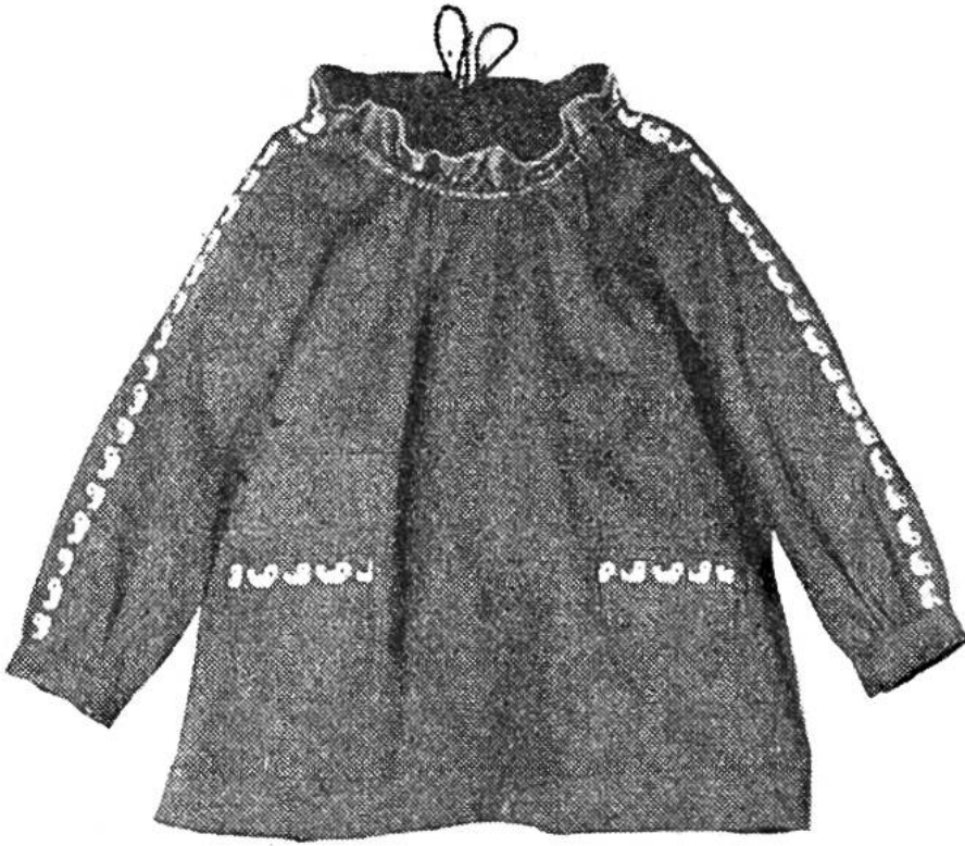
Kitteli mit der fröhlichen Bandgarnitur.