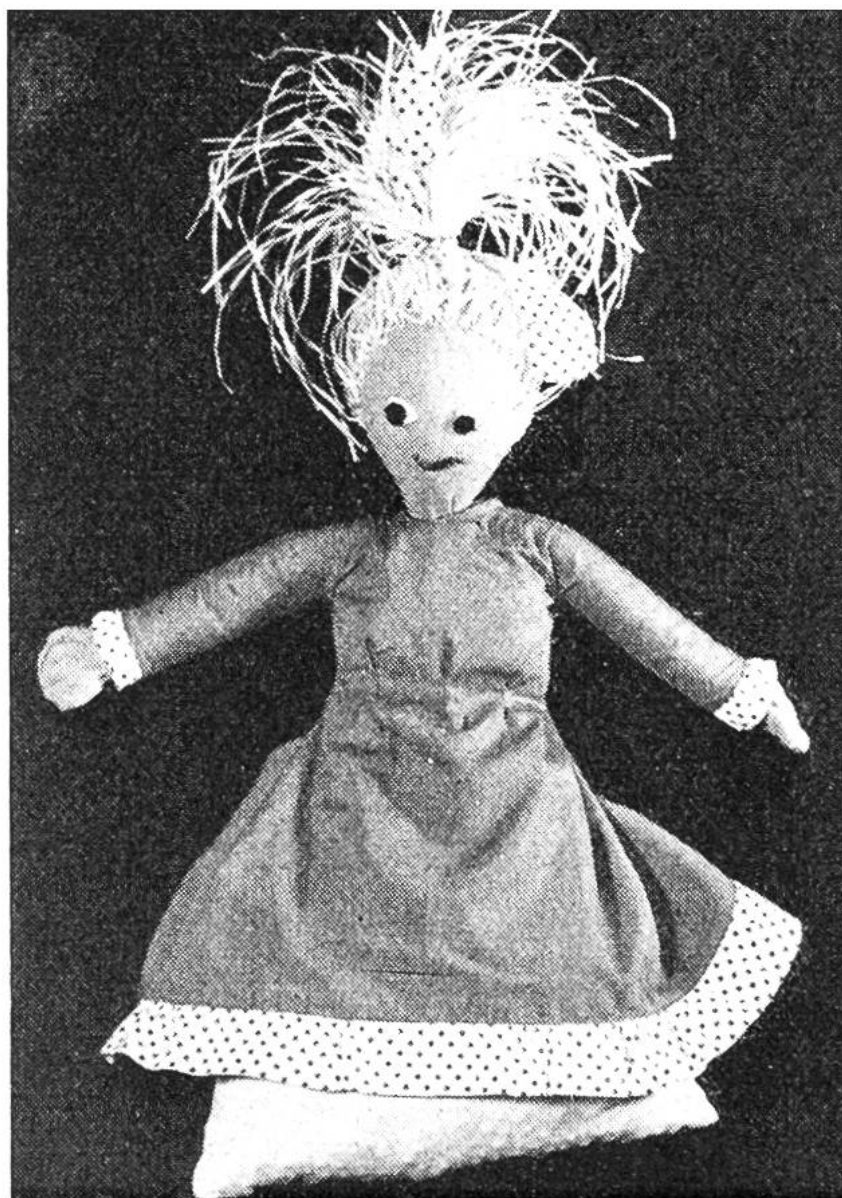
Wärmesack aus Kirschsteinen – als Puppe verkleidet.

Teile mit Überwendlingsstichen, gleichzeitig nähen wir auch die Ausnäher, damit wir eine Kugel erhalten. Wir stopfen den Kopf aus und überziehen ihn mit dem Strumpf. Augen und Mund schneiden wir aus Filz und nähen sie auf den Kopf. Die Haare sind aus weißem Kunstbast gemacht. Wir schneiden Stücke von 50 cm Länge, ziehen diese Stücke mit einer Nadel durch das Gewebe und knüpfen sie. Je mehr Bast wir durchziehen, desto voller und schöner wird die Frisur. Die Haare werden mit einem Band zu einem Roßschwanz zusammengebunden. Nun können wir den Kopf dem kleineren Sack annähen.