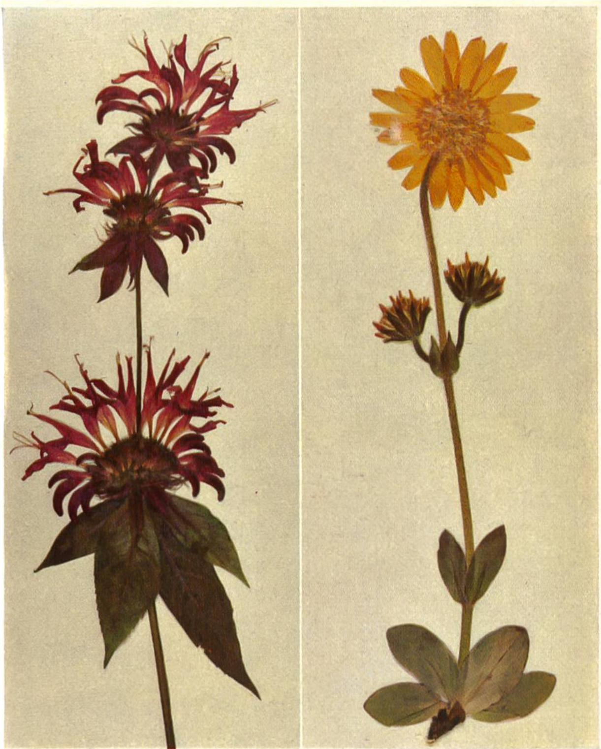
Aus einem Herbarium, das während der Drogistenlehrzeit angelegt wurde. Goldmelisse und Ringelblume.