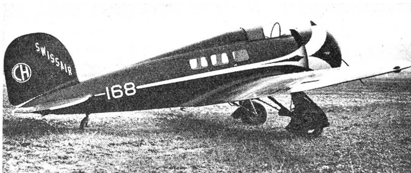
Der Lockheed-Orion, das erste amerikanische Verkehrsflugzeug in Europa. Es wurde von der Swissair 1932 in Betrieb genommen.

der verschiedenen Gesellschaften im Linienverkehr ähneln sich zu stark, als dass sie die Wahl der Passagiere entscheidend zu beeinflussen vermöchten. Die Tarife aller bedeutenden Luftfahrtbetriebe sind gleich. Eine internationale Regelung schliesst Preisunterbietungen aus.