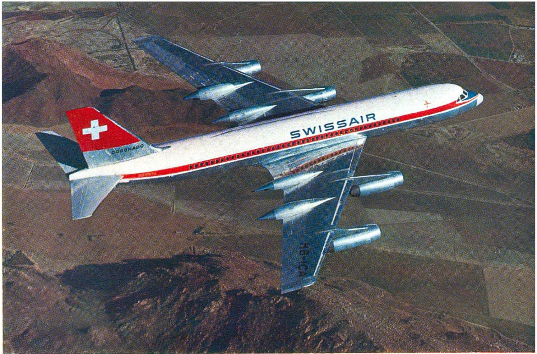
Der Convair-Coronado, seit 1962 im Einsatz nach Südamerika, dem Mittleren und Fernen Osten und Afrika, gilt als das zur Zeit schnellste und wirtschaftlichste Verkehrsflugzeug der Welt.