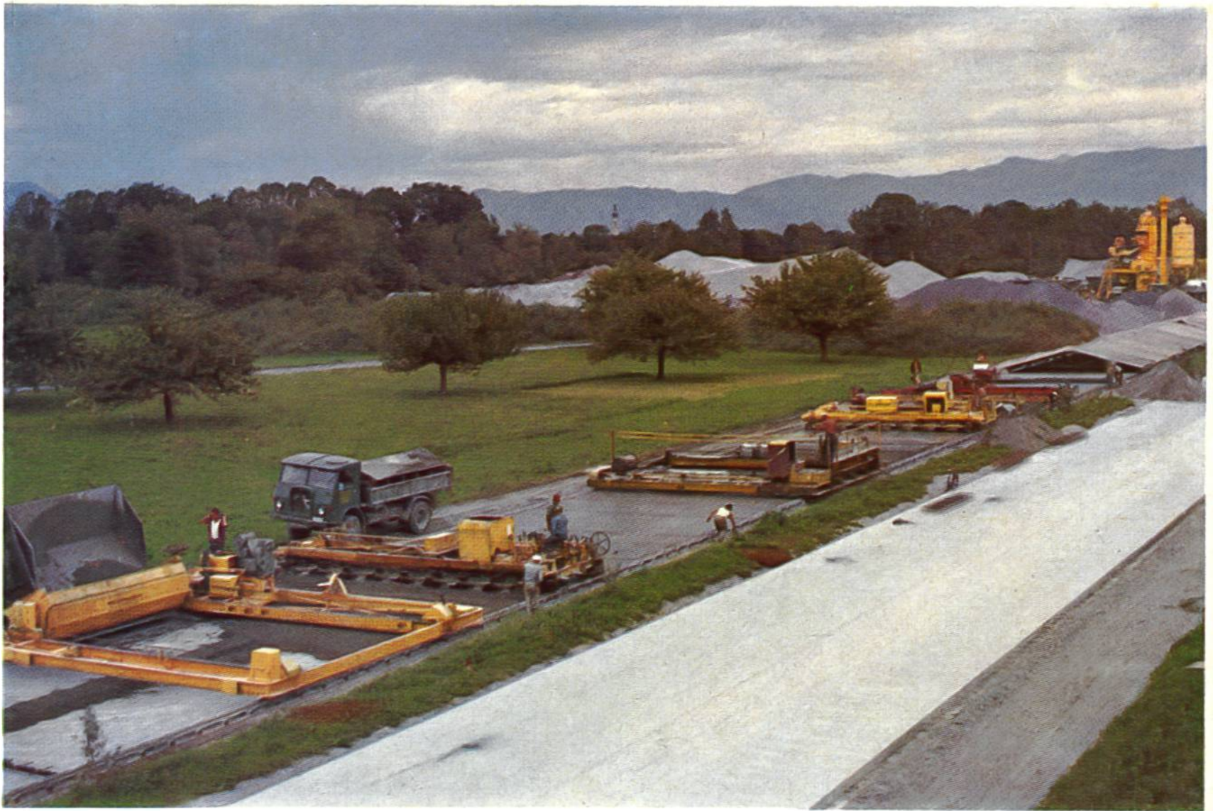
Betonbelagsbau der Nationalstrasse « N 1 » bei St. Margrethen.