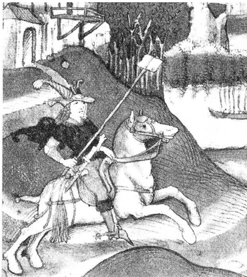
Briefbote mit der Absage des Grafen Gerhard von Valendis an die Stadt Bern im Laupenkrieg 1339.