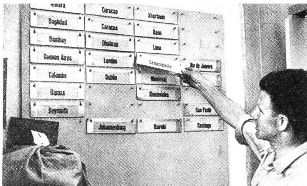
Flughafenpostamt Zürich 58; Anschriften nach aller Welt.

(1861/1862), die Expressendungen (1868), die Feldpost (1870), die Postkarte (1870), der Postcheckdienst (1906), die Rohrpost (1926) usw.