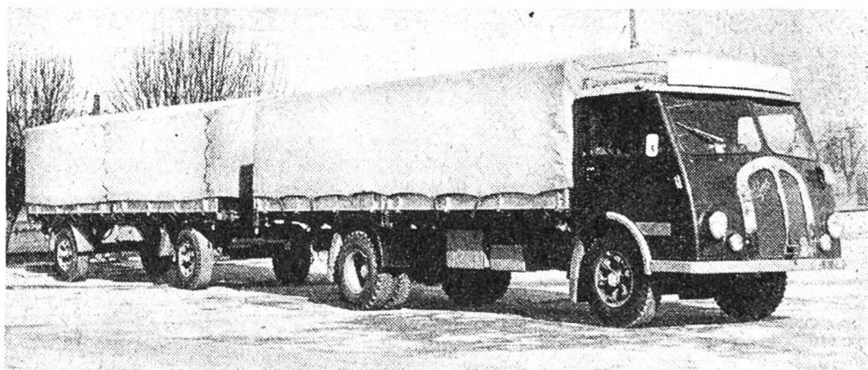
Schweizer Lastwagenzug für Gütertransporte im In- und Ausland.