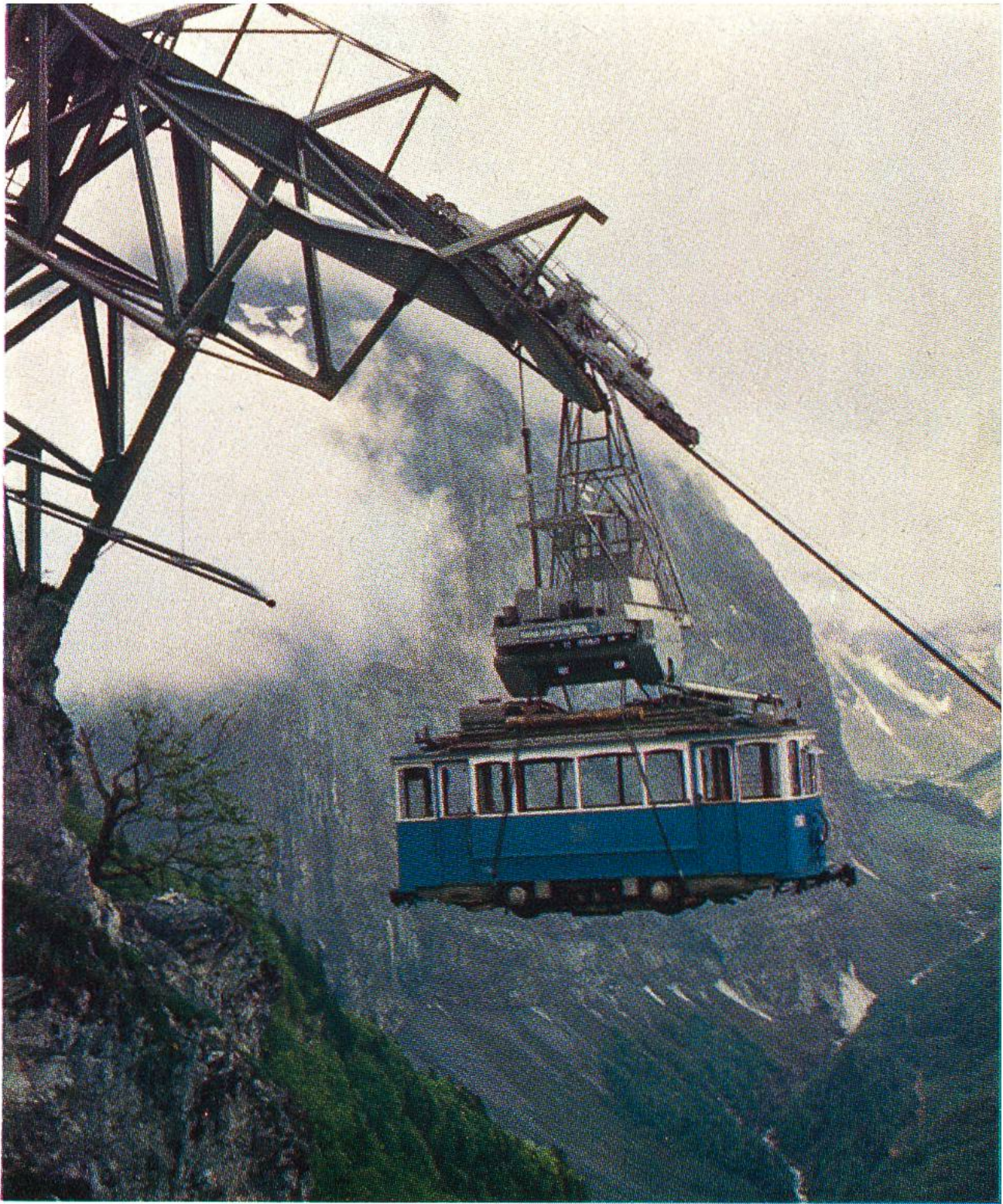
Schwerlastseilbahn Tierfehd (Kraftwerke Linth-Limmern) transportiert einen Zürcher Tramtriebwagen auf die Höhe der Baustelle.