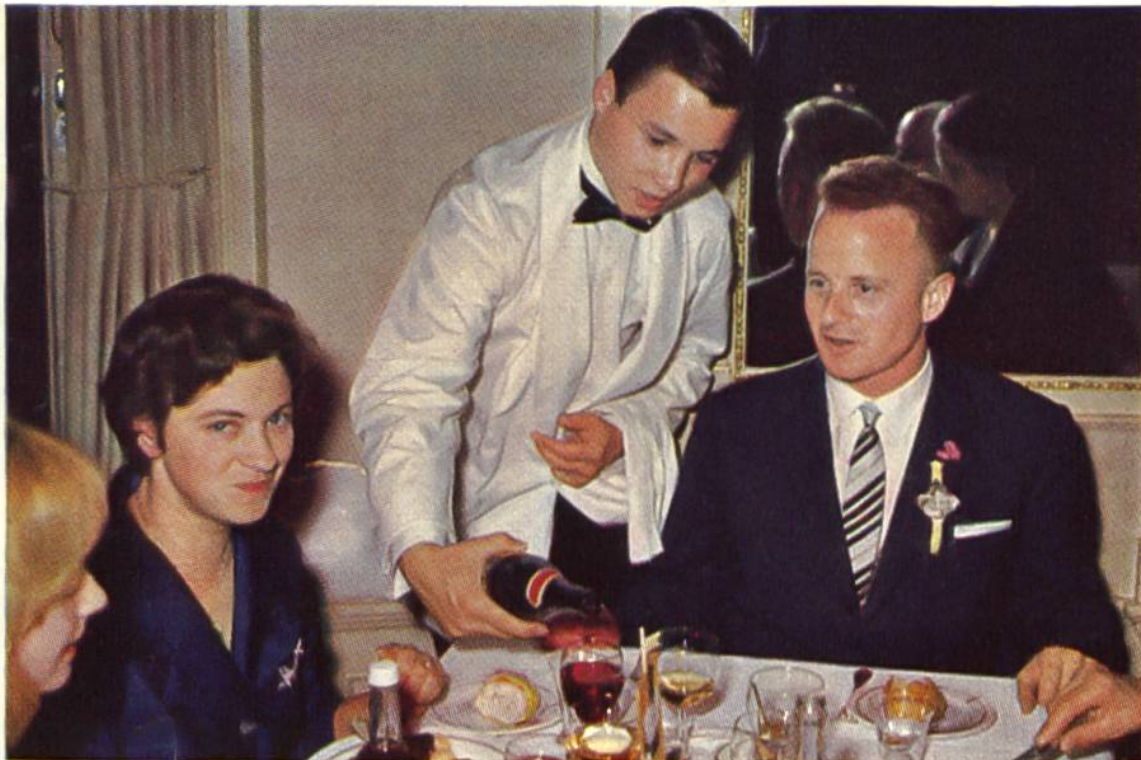
Ein Schüler des Servicekurses beim Einsatz in der Praxis.