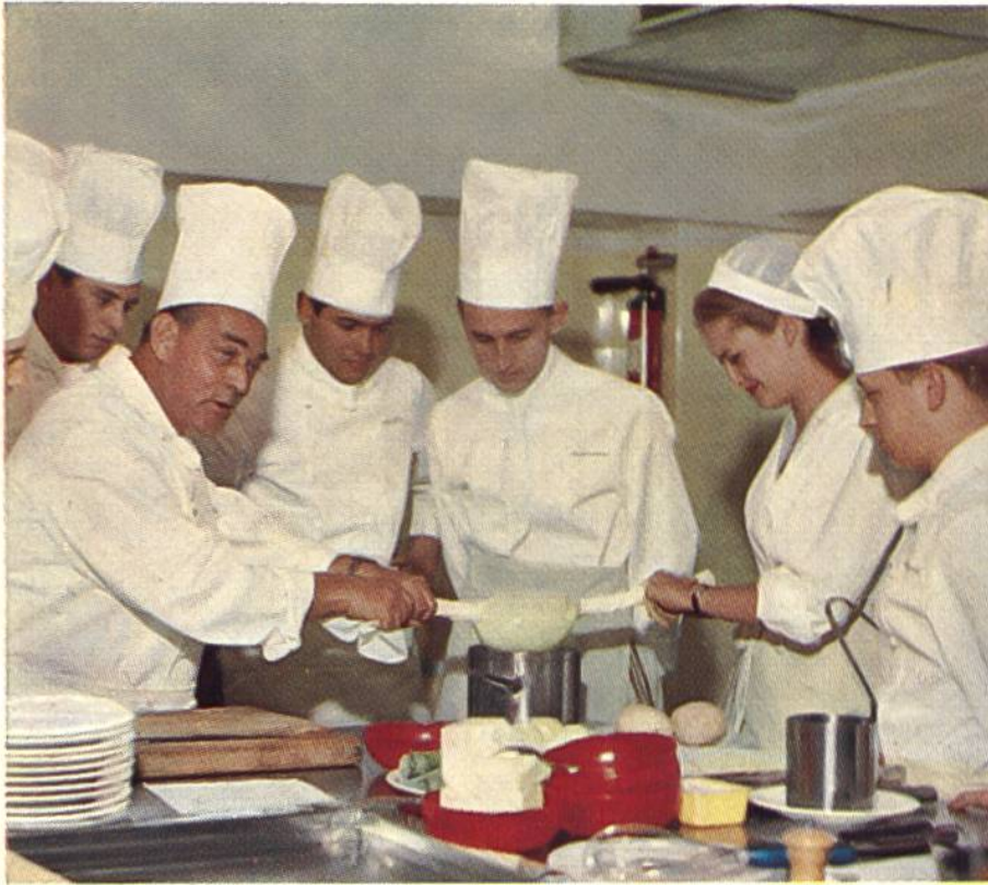
Anschauungsunterricht im Küchenkurs der Hotelfachschule Lausanne.