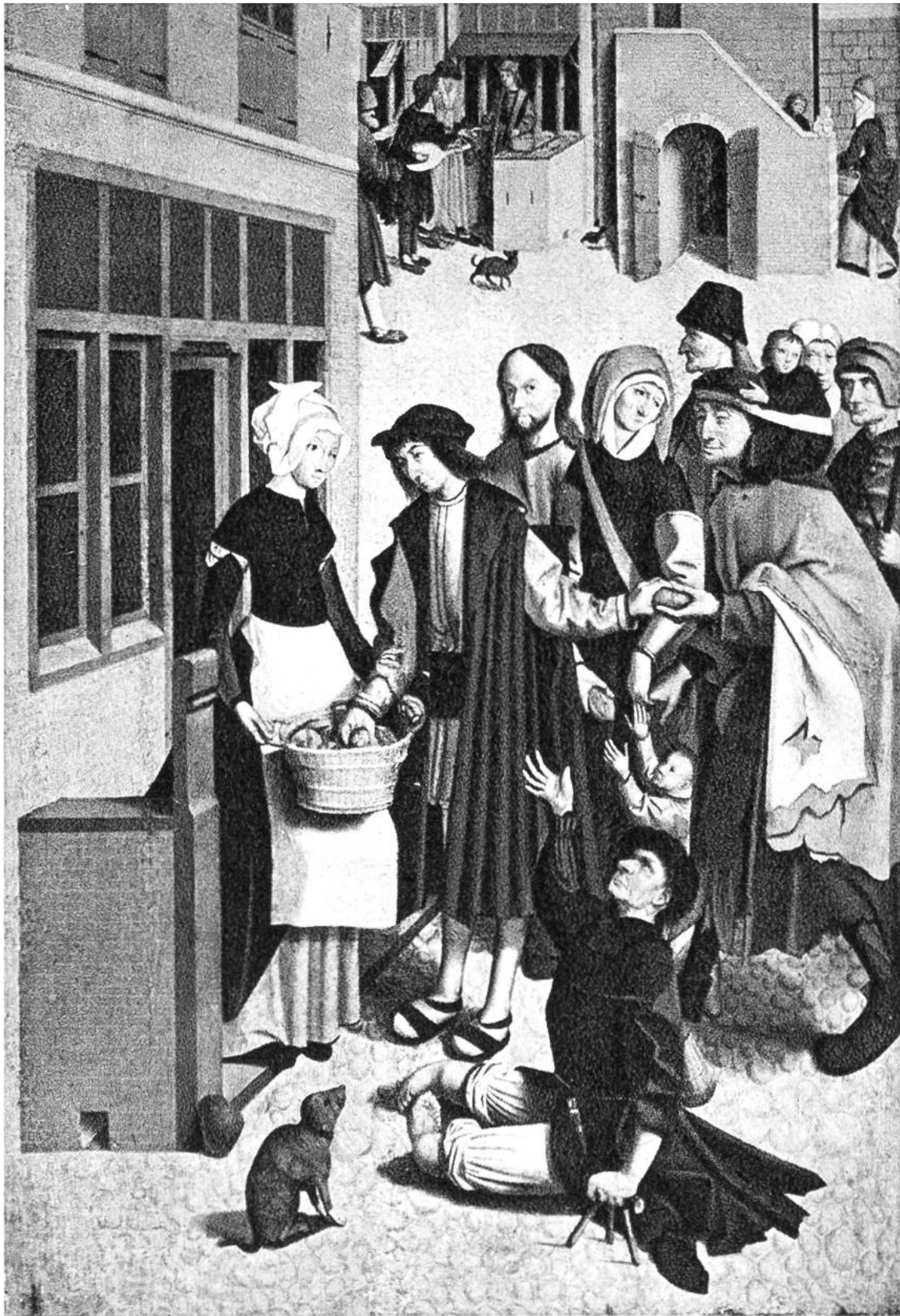
Speisung der Hungernden, Malerei auf Eichenholz vom niederländischen Meister von Alkmaar, vor 1490–1540. (Rijksmuseum, Amsterdam)