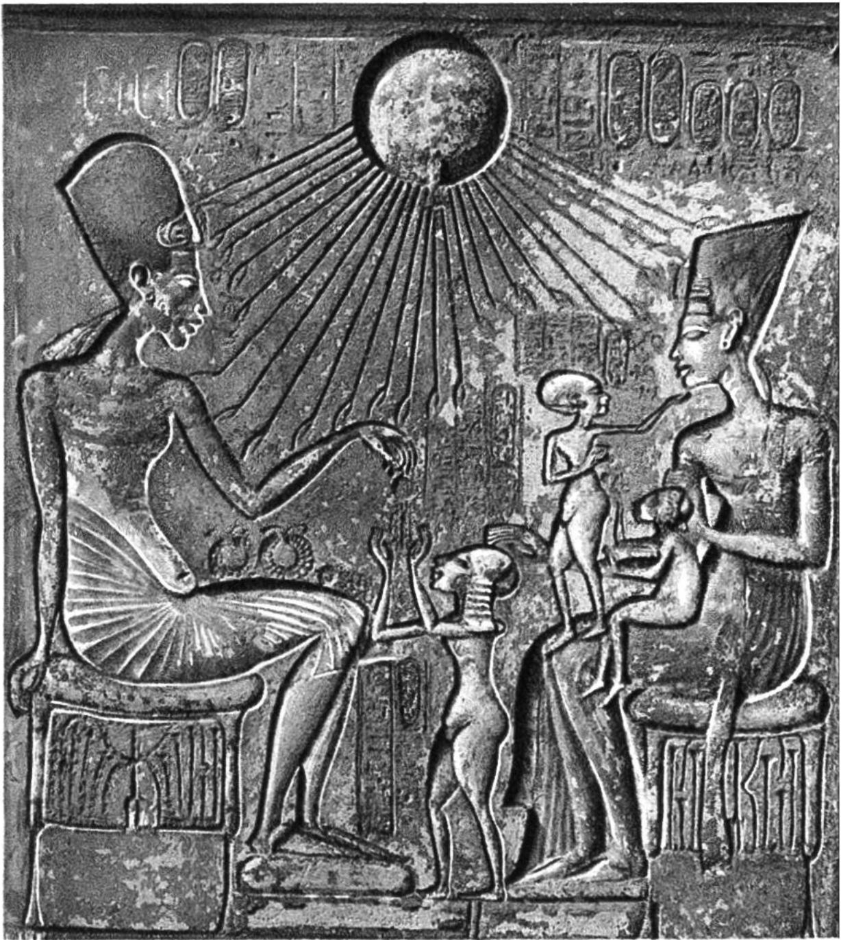
Ägyptische Königsfamilie, Kalksteinrelief von El-Amarna, um 1800 v. Chr. (Ägyptisches Museum, Kairo)