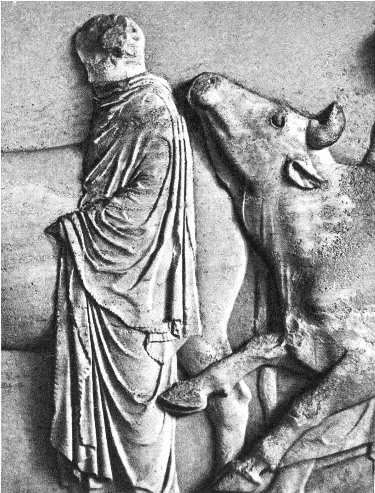
Teilstück aus dem Festzug der Panathenäer vom Parthenon-Fries auf der Akropolis, Athen. Flachrelief, 5. Jahrhundert v. Chr. (Akropolis-Museum, Athen)