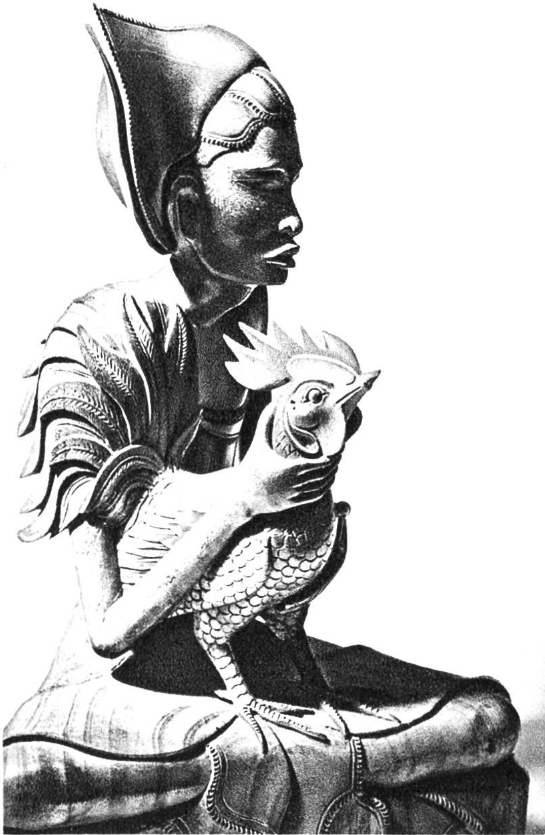
Mann mit Kampfhahn. Moderne Holzplastik aus Bali, Indonesien. (Tropenmuseum, Amsterdam)