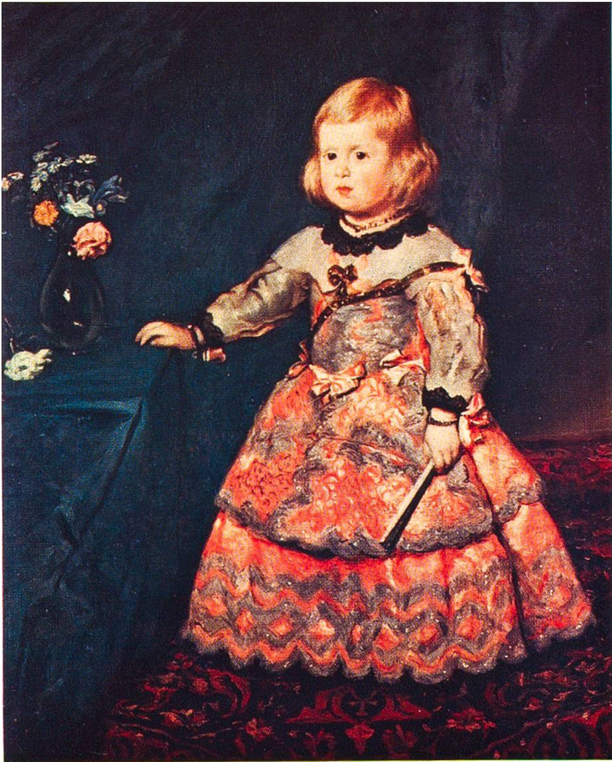
Infantin Margarete, von Diego Velazquez, Sevilla, 1599–1660. (Kunsthistorisches Museum, Wien)