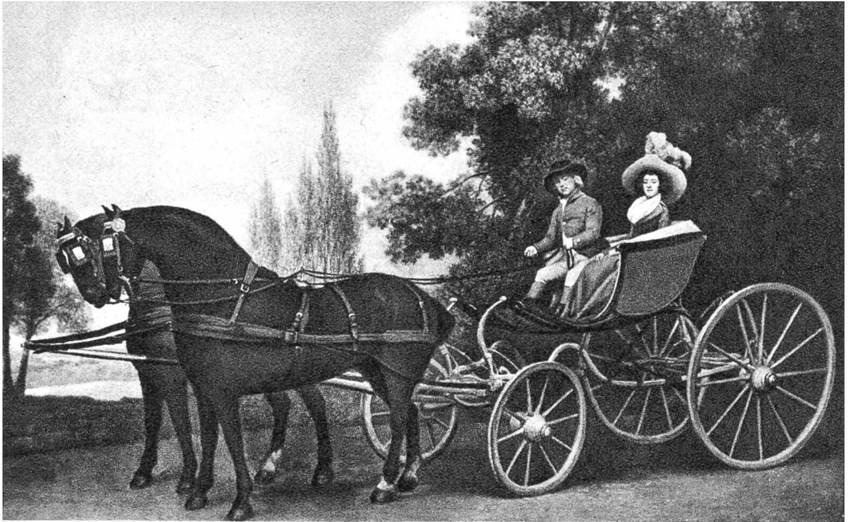
Spazierfahrt im Phaeton (vierrädriger Kutschwagen), von George Stubbs, Liverpool, 1724–1806. (National Gallery, London)