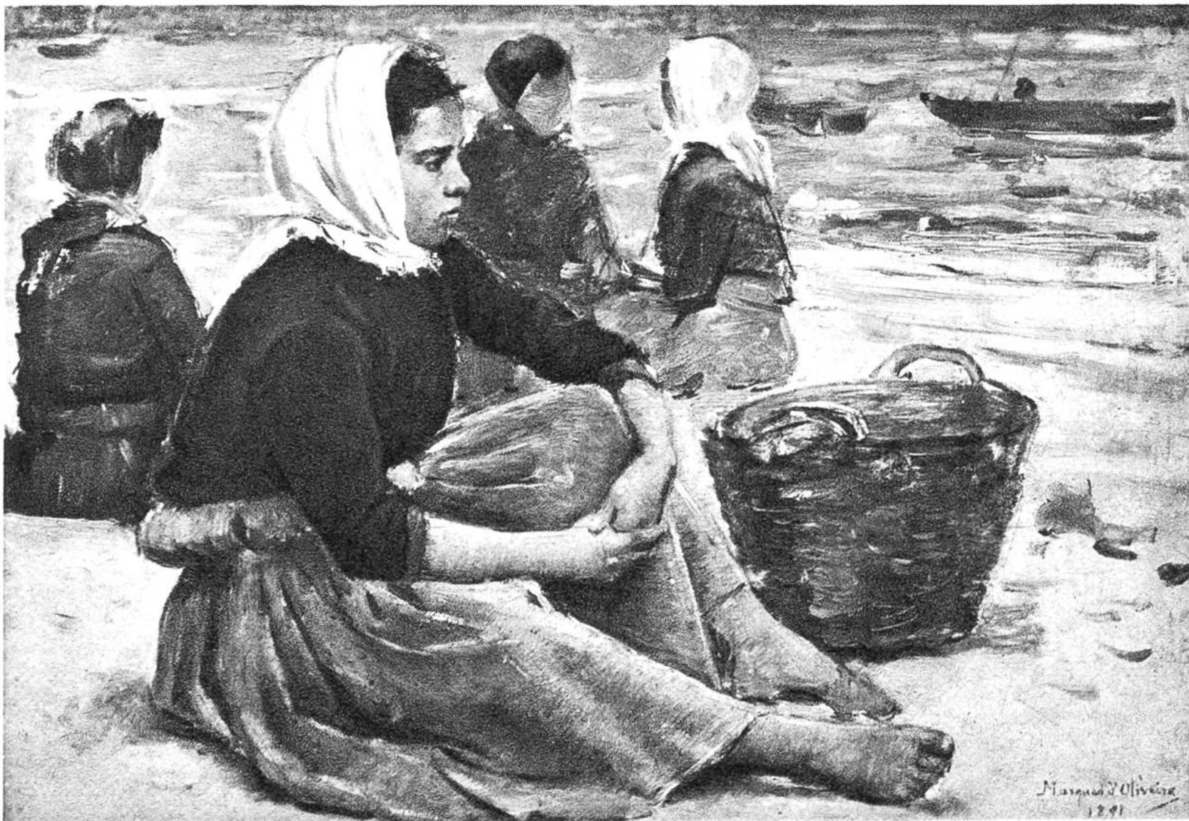
In Erwartung der Fischerbarken, Studie von Marques de Oliveira, Lissabon, 1853–1927. (Nationalmuseum moderner Kunst, Lissabon)