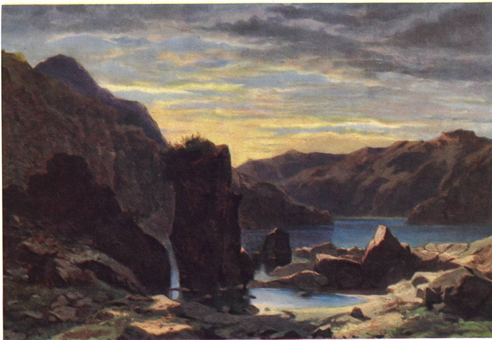
Sonnenuntergang, von Alexandre Calame, * Vevey 1810, † Menton 1864.