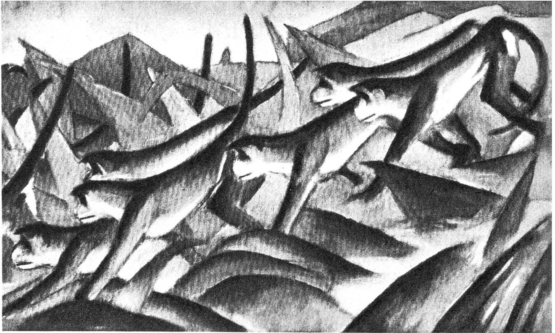
Affenfries, von Franz Marc, München, 1880–1916. (Kunsthalle, Hamburg)