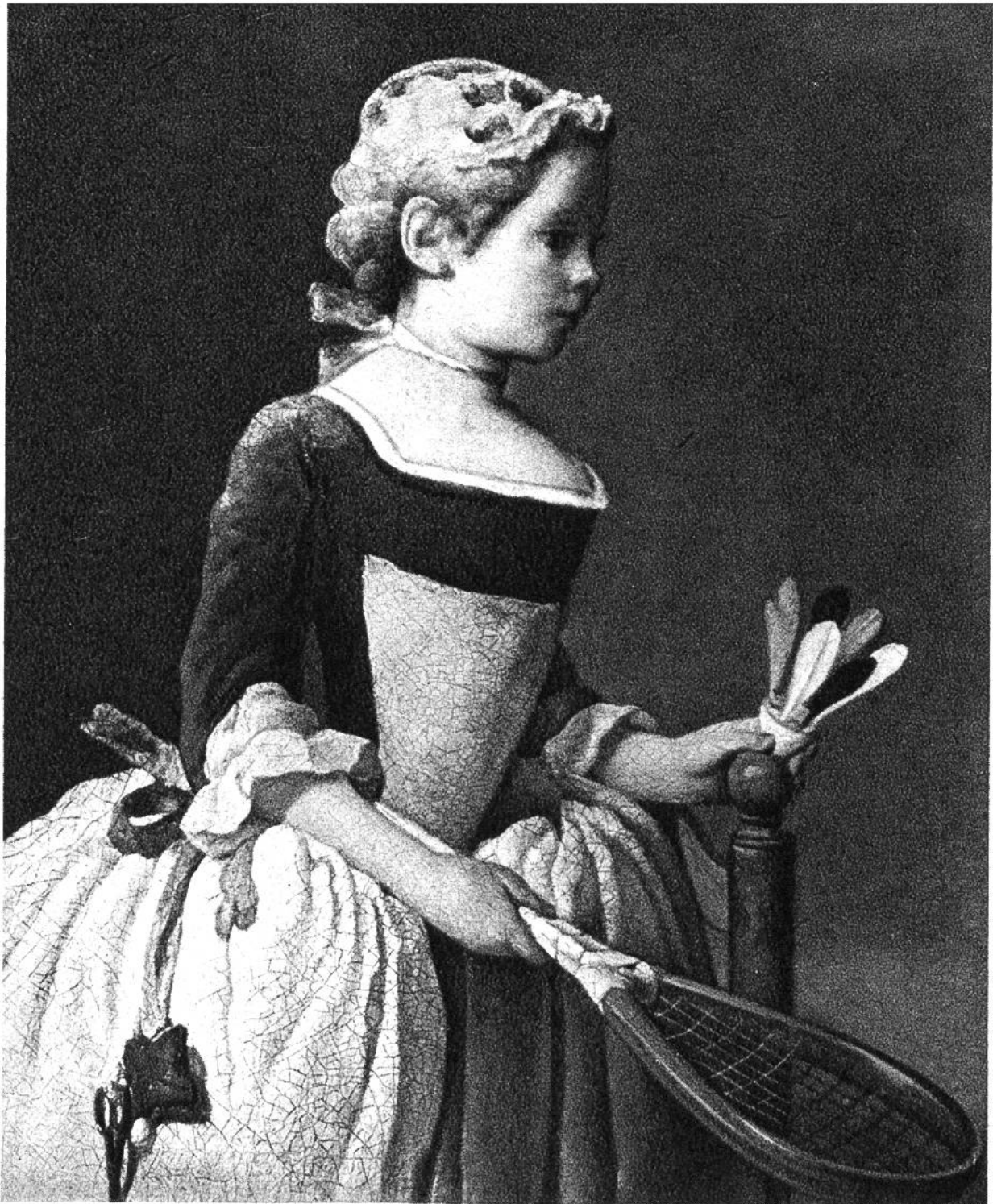
Federballspielerin, von J.B.S.Chardin, Paris, 1699–1779. (Nationalmuseum, Stockholm)