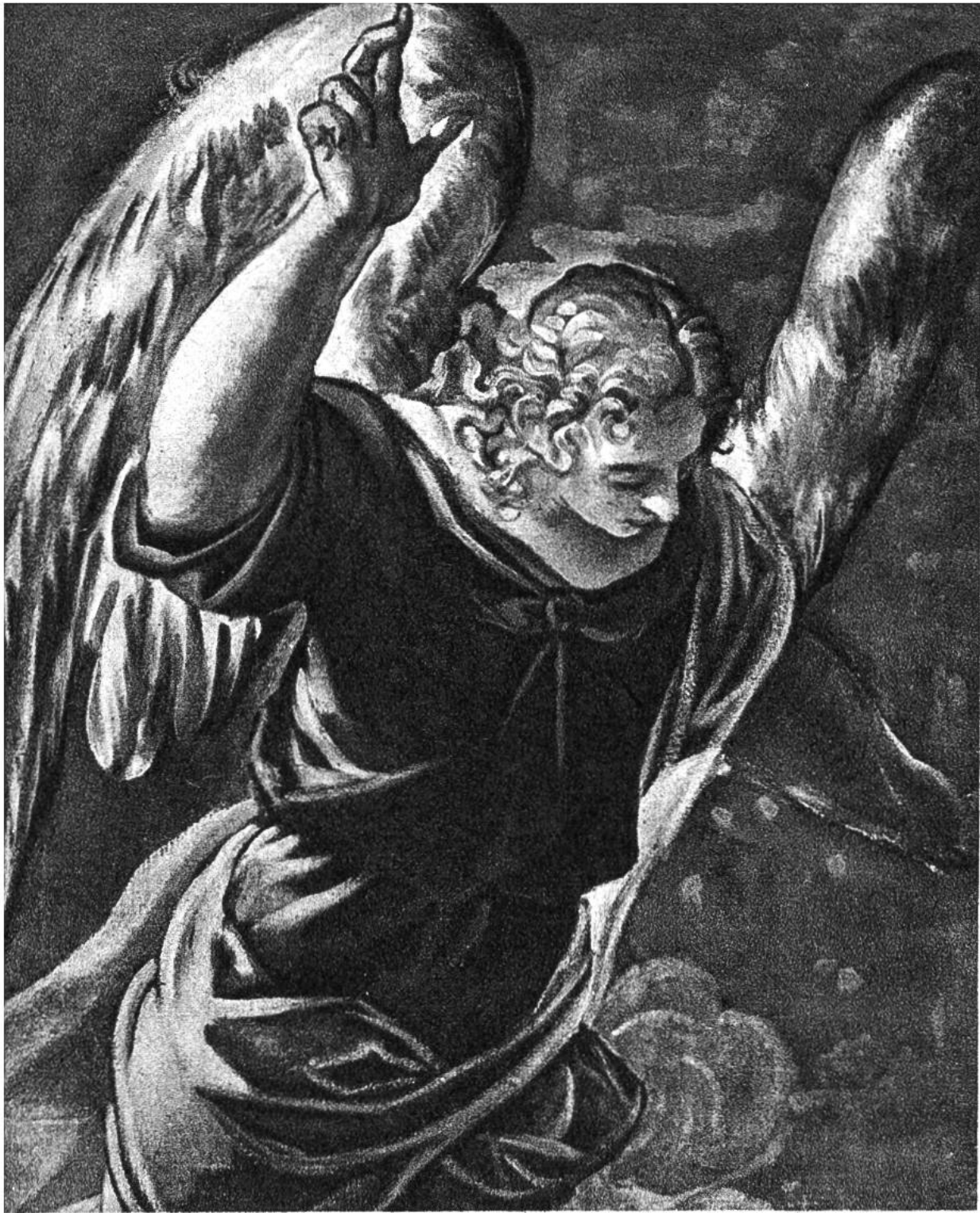
Engel, aus einem Gemälde von Tintoretto, Venedig, 1518–1594. (Rijksmuseum, Amsterdam)