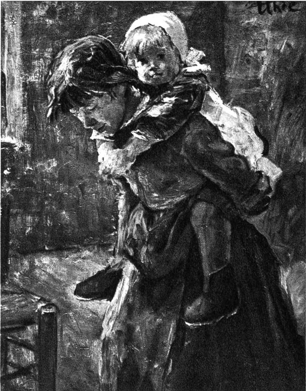
Die grosse Schwester, von Fritz von Uhde, München, 1848–1911. (Stiftung Oskar Reinhart, Winterthur)