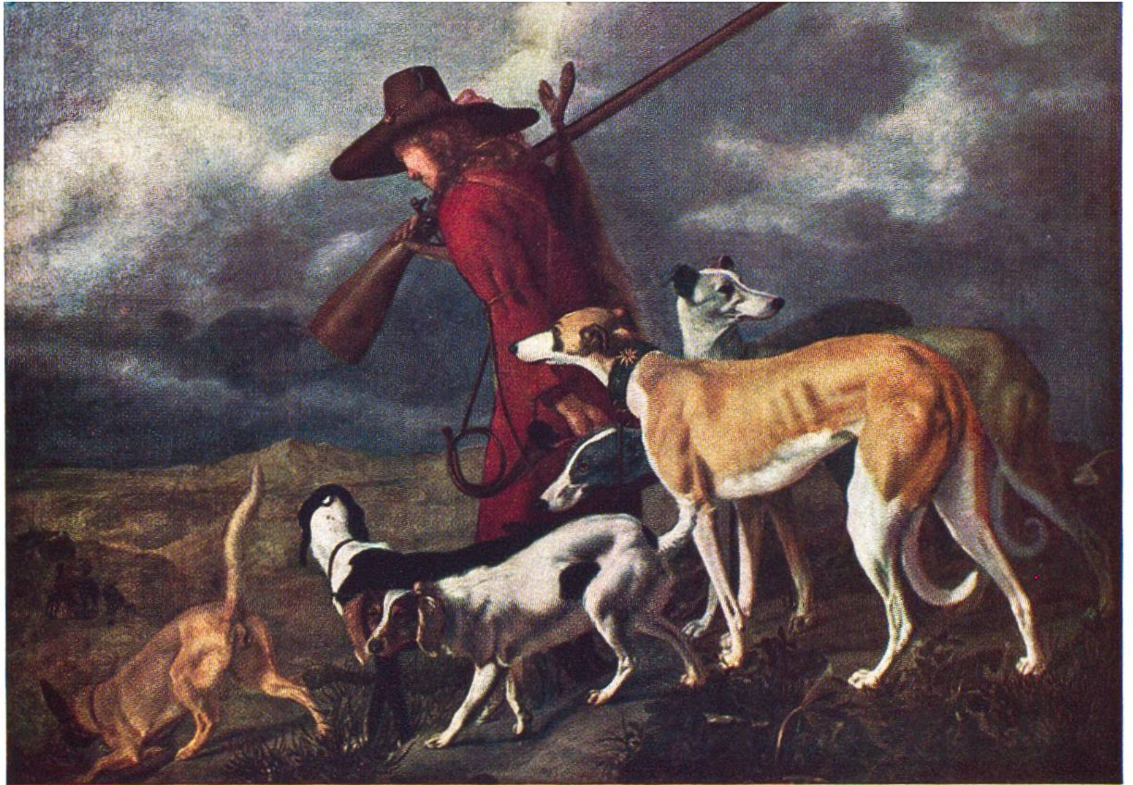
Der Jäger, von Adriaen Cornelisz Beeldemaeker, Den Haag, 1618?–1709. (Rijksmuseum, Amsterdam)