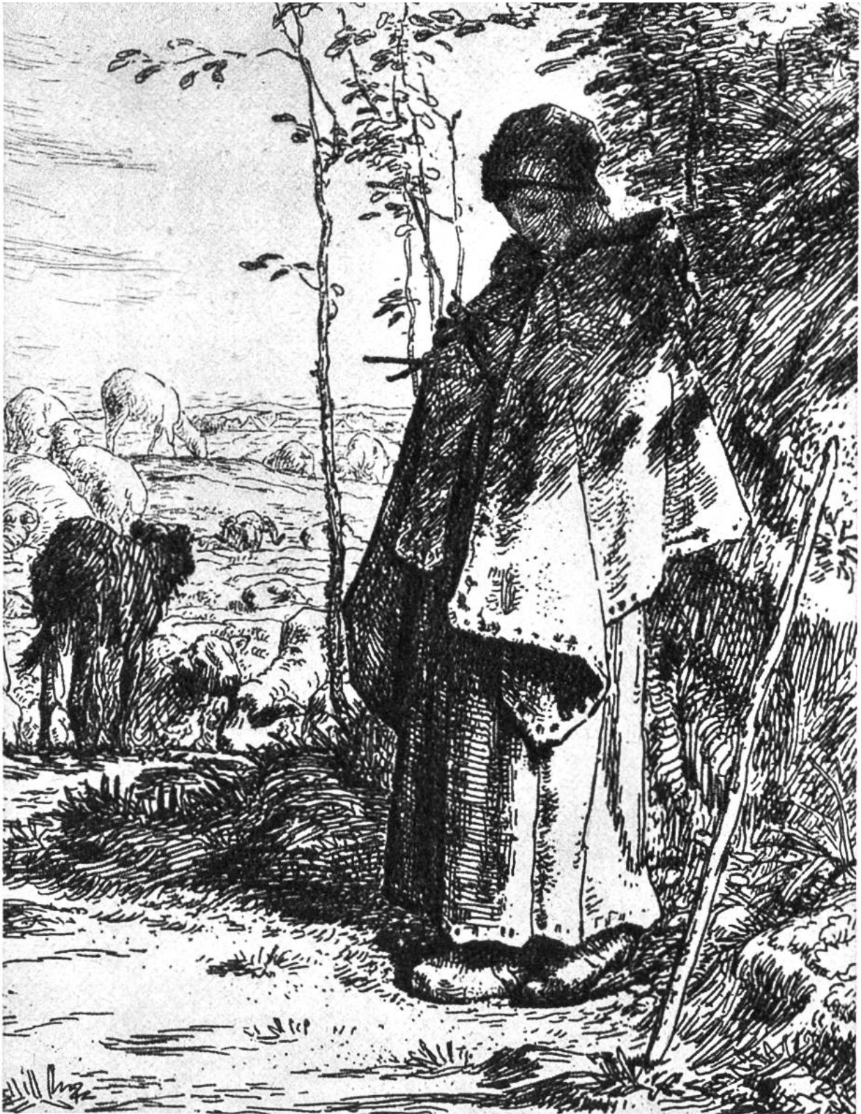
Die Hirtin, Radierung von Jean-François Millet, Barbizon bei Fontainebleau, 1814–1875.