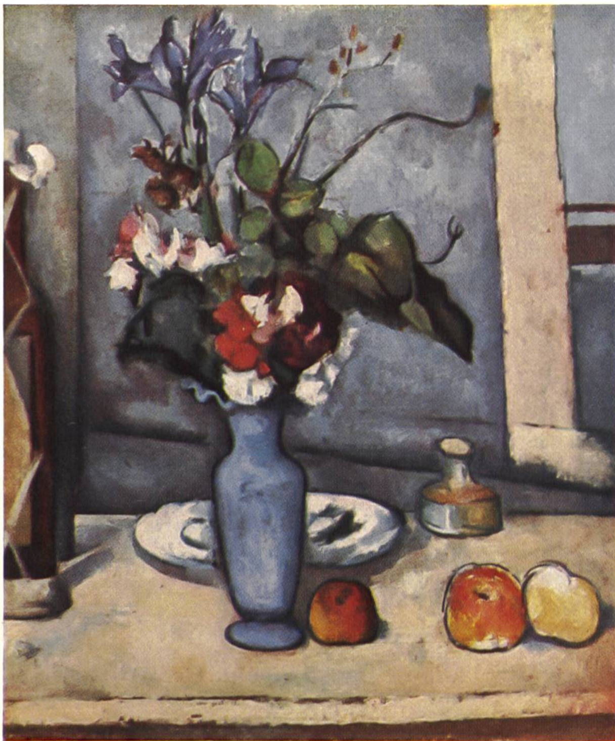
Stilleben mit blauer Vase, von Paul Cézanne, Aix-en-Provence, 1839–1906. (Louvre, Paris)