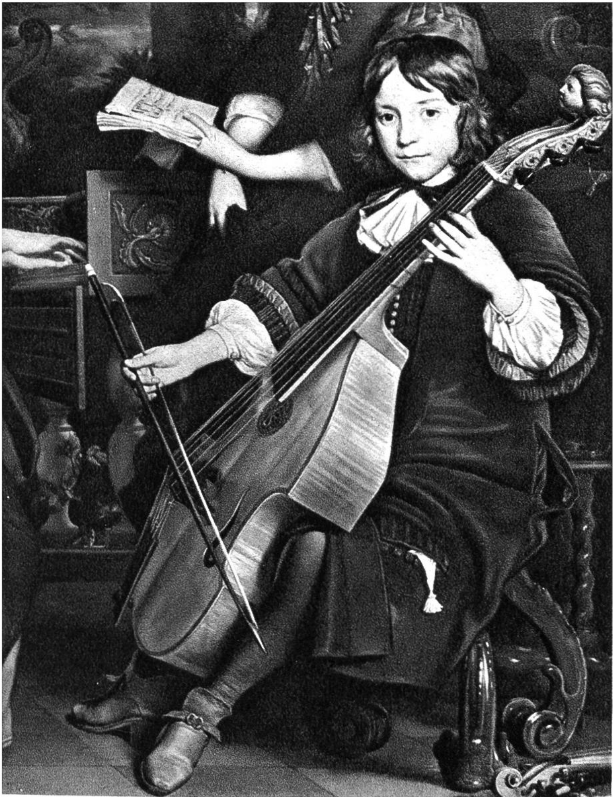
Musizierende Familie (Teilstück), von A. van den Tempel, Amsterdam, 1622–1672. (Rijksmuseum, Amsterdam)