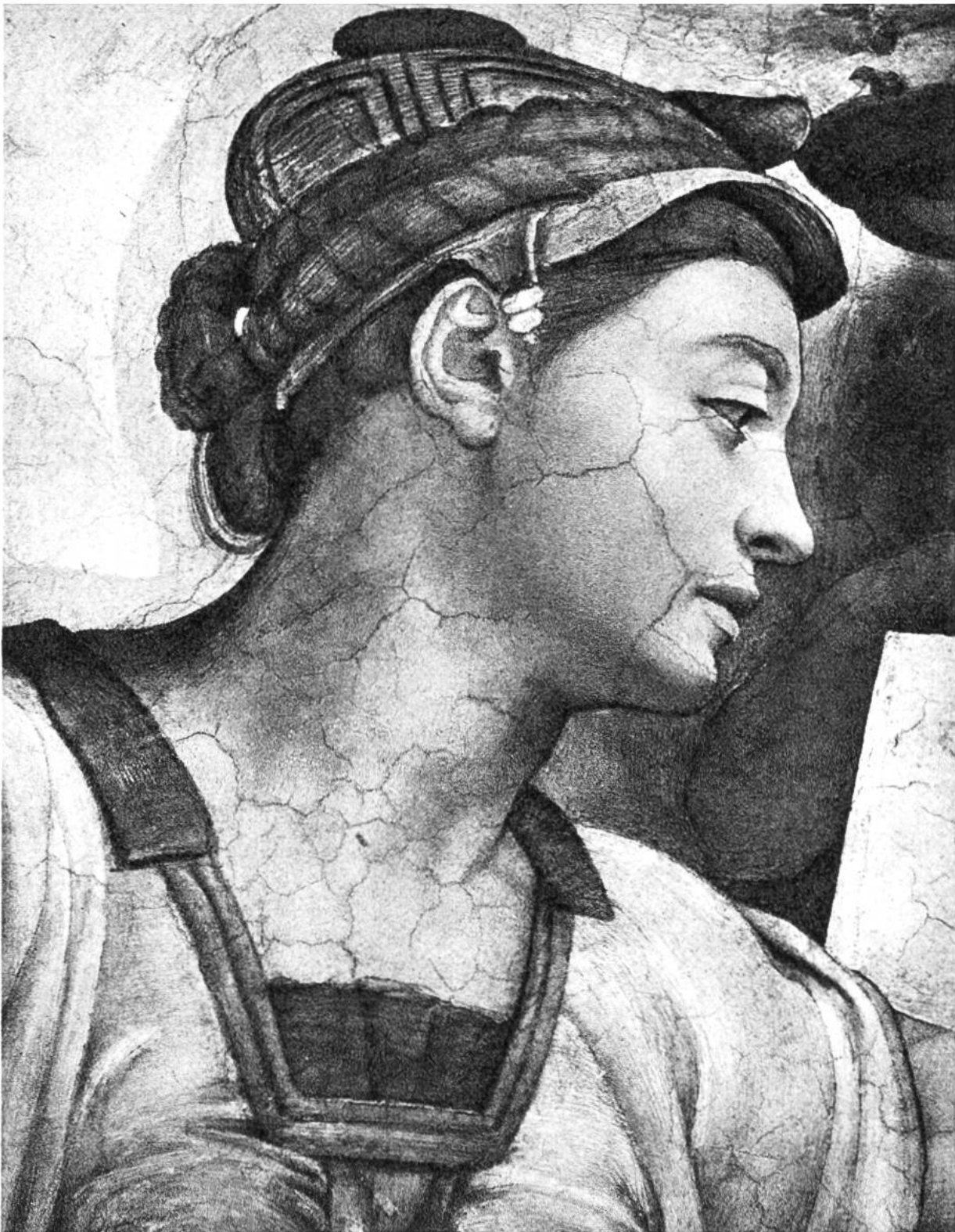
Sibylle von Eritrea, Deckengemälde in der Sixtinischen Kapelle des Vatikans, von Michelangelo, Rom, 1475–1564.