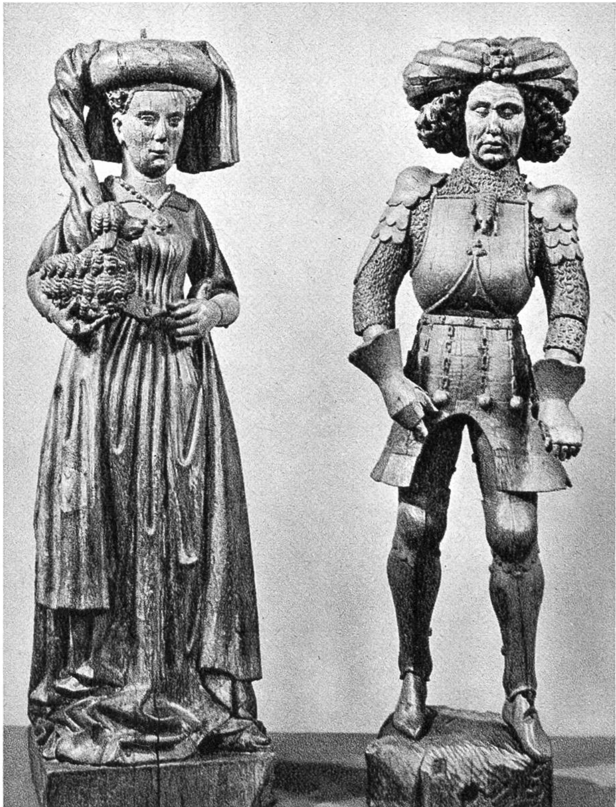
Isabella von Portugal und Philipp der Gute, Eltern Karls des Kühnen. Nordniederländische Eichenholzsznitzerei, ca. 1475. (Rijksmuseum, Amsterdam)