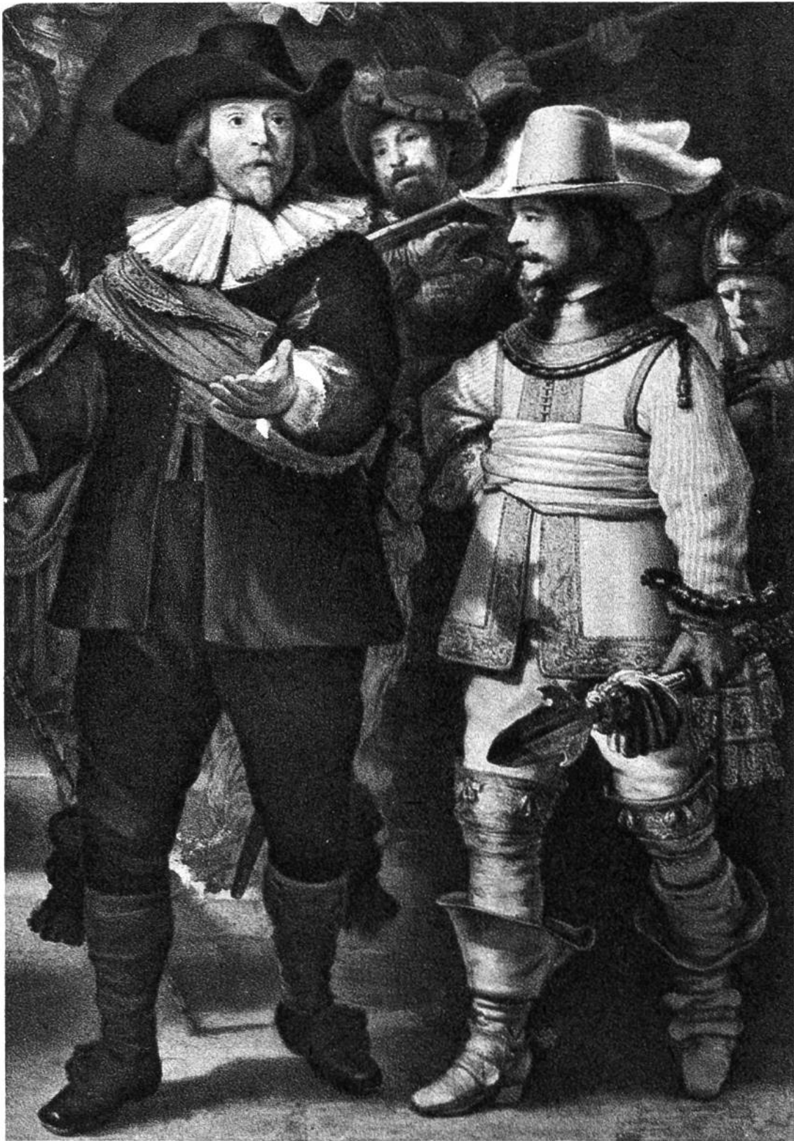
Die Nachtwache (Teilstück), von Rembrandt van Rijn, Amsterdam, 1606–1669. (Rijksmuseum, Amsterdam)