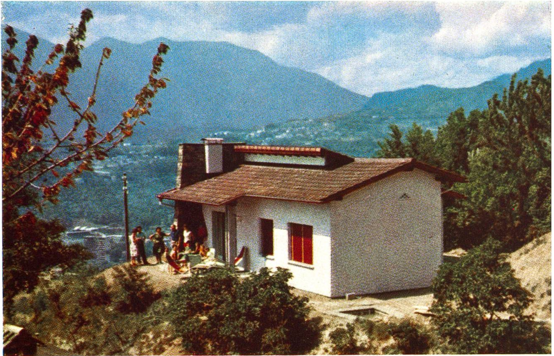
Die «Casa Sciaffusa» im Feriendorf der 25 Kantone in Albonago ob Lugano, das die Schweizer Reisekasse speziell für Ferienaufenthalte kinderreicher Familien erbaut hat.