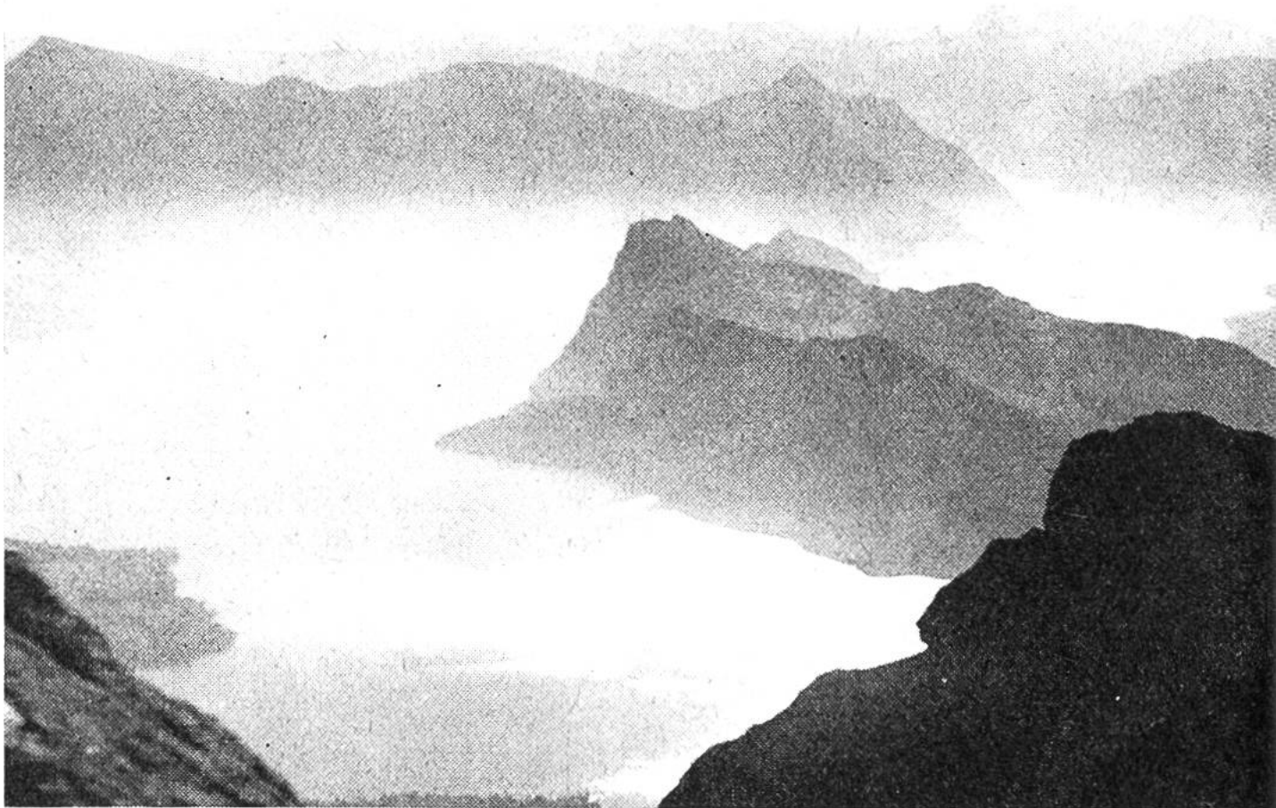
Blick vom Pilatus über Bürgenstock, Rigi und Vierwaldstättersee.