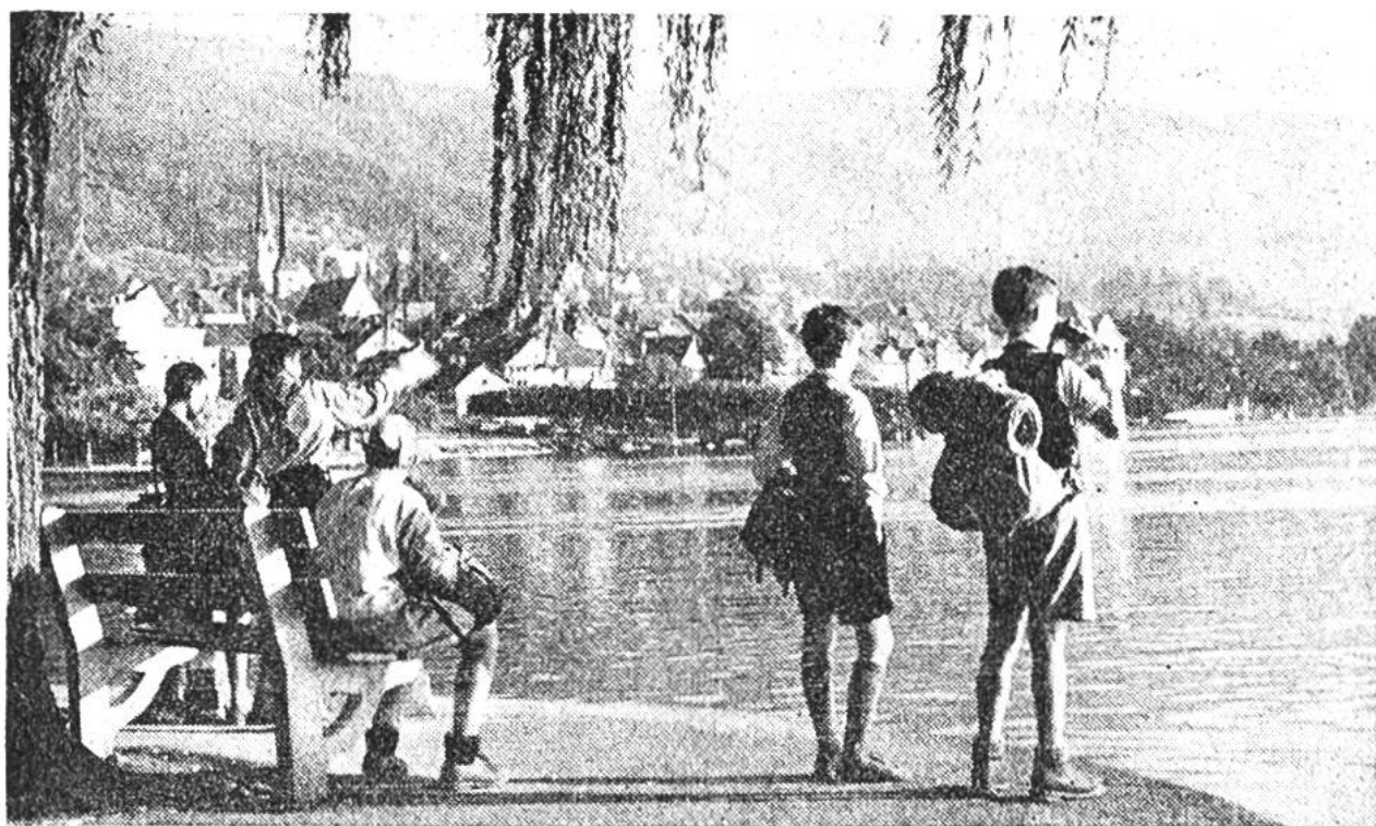
Schulsausflug an den Zugersee, inmitten eines der vielen abwechslungsreichen Wandergebiete in unserem Land. (Siehe auch Seite 164.)

sich eindeutig grösserer Beliebtheit. – Neben den von den «Junior Reporters» – den jungen Berichterstatlern – bedienten Zeitungen veröffentlichten rund 400 andere Zeitungen der USA sowie zwei in Millionenauflagen erscheinende Zeitschriften Beiträge und Gratis-Freundschaftsinserate, die dem Fremdenverkehrsland Schweiz gewidmet waren und wesentlich dazu beitrugen, unser Land und die Schweizer den Amerikanern menschlich näherzubringen.