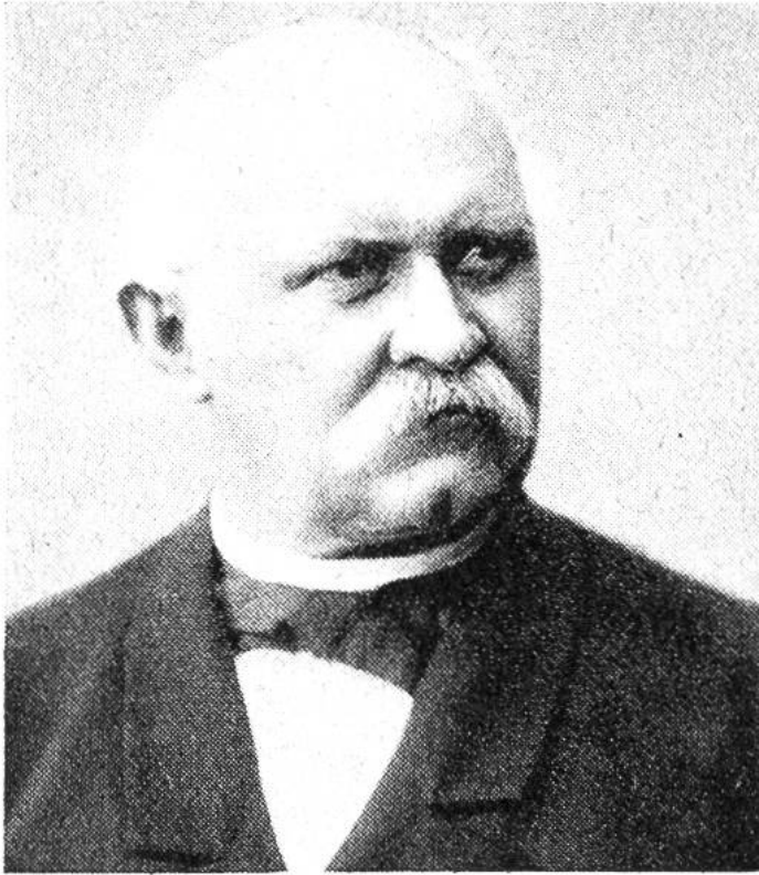
Emil Welti, von Zurzach, Bundesrat 1866–1891.

den Bahnbau der privaten Initiative, also dem privaten Unternehmertum, die Finanzierung zu einem erheblichen Teil ausländischen Geldgebern, die Vollmacht jedoch, den Bau und den Betrieb zu bewilligen (d. h. Konzessionen zu erteilen), den Kantonen zu überlassen. Man schrak davor zurück, den Schwerpunkt der Verkehrspolitik auf den Bund zu übertragen, aus Angst, das zu starke Anwachsen der Bürokratie könnte den Bund übermächtig werden lassen. In den ersten Staatskalendern nach 1849 gab es noch kein Post- und Eisenbahndepartement, sondern ein Post- und Baudepartement. Sein erster Chef war Bundesrat Wilhelm Matthias Naeff. Jahre hindurch hatte er die Funktionen des Generalpostmeisters selbst zu versehen. Markante Persönlichkeiten, die sich als Bundesräte um die Gestaltung des Verkehrswesens in der Pionierzeit verdient machten, waren ferner Jakob Dubs, Verfasser der Botschaft zum Eisenbahngesetz vom 23. Dezember 1872, welches das Recht zur Erteilung von Eisenbahnkonzessionen auf den Bund übertrug, Karl Schenk, der einige Jahre das Eisenbahn- und Handelsdepartement leitete; Emil Welti war der erste Vorsteher des Post- und Eisenbahndepartements; Joseph Zemp bleibt in der Eisenbahngeschichte mit