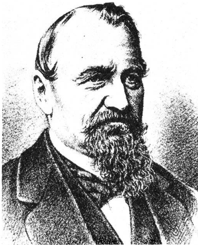
Jakob Dubs, von Affoltern a. A., Bundesrat 1861–1872.

griffen «Vollzug der Gesetzgebung» und «Aufsicht». Dass der mit seinen Aufgaben vertraute Beamte sich nicht mit eingefahrenen Geleisen begnügen kann und darf, sondern stets den Blick auf neue Möglichkeiten ausrichten muss, ist einleuchtend, zumal der Verwaltung auch die Vorbereitung der Gesetzgebung vorgeschrieben ist. In einer Demokratie wie der schweizerischen, die stets darauf bedacht sein muss, die Zustimmung der Bürger zu erhalten, verlangt dies ein be-