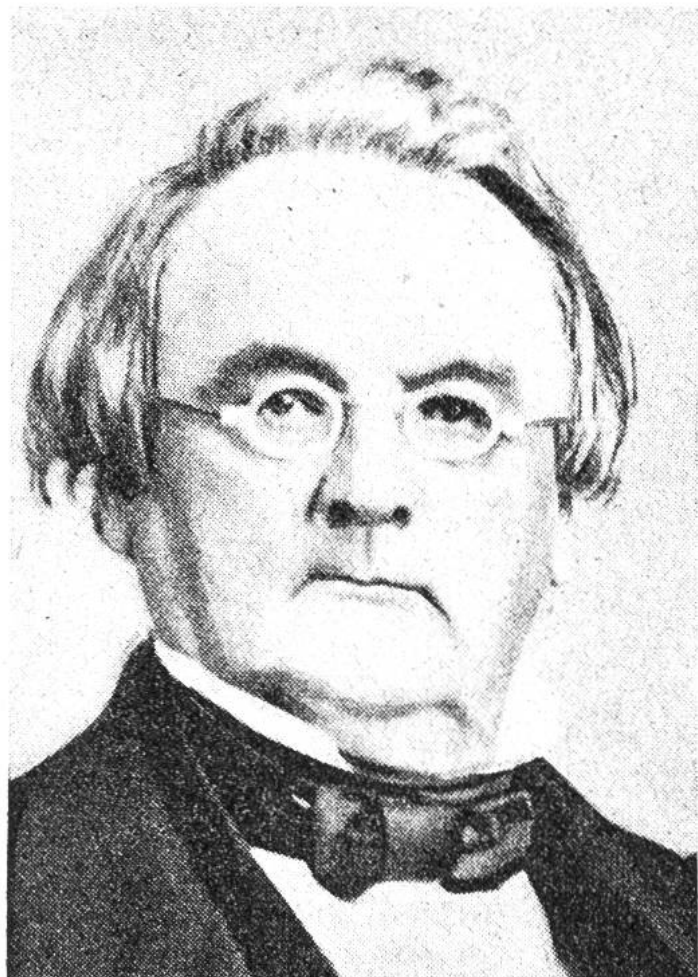
Wilhelm Matthias Naeff, von Altstätten, Bundesrat 1848–1875.

Diese Vorherrschaft des Technischen ist somit ein besonderes Merkmal des Departements. Vom Verkehr erwartet der Benutzer, dass er tadellos funktioniert. Zur Wahrung der Interessen des öffentlichen Verkehrs gehört folglich die Sorge für die Qualität der Verkehrsleistung. Sie wird beurteilt nach der Sicherheit, die bei aller hochgetriebenen Geschwindigkeit als oberstes Gebot zu gelten hat, nach der Pünktlichkeit, der Regelmässigkeit, der Billigkeit und nicht zuletzt nach der Bequemlichkeit. Die Sorge für die Qualität der