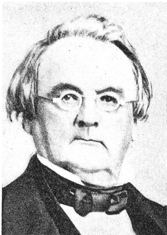
Wilhelm Matthias Naeff, von Altstätten, Bundesrat 1848–1875.

Diese Vorherrschaft des Technischen ist somit ein besonderes Merkmal des Departements. Vom Verkehr erwartet der Benutzer, dass er tadellos funktioniere. Zur Wahrung der Interessen des öffentlichen Verkehrs gehört folglich die Sorge für die Qualität der Verkehrsleistung. Sie wird beurteilt nach der Sicherheit, die bei aller hochgetriebenen Geschwindigkeit als oberstes Gebot zu gelten hat, nach der Pünktlichkeit, der Regelmässigkeit, der Billigkeit und nicht zuletzt nach der Bequemlichkeit. Die Sorge für die Qualität der