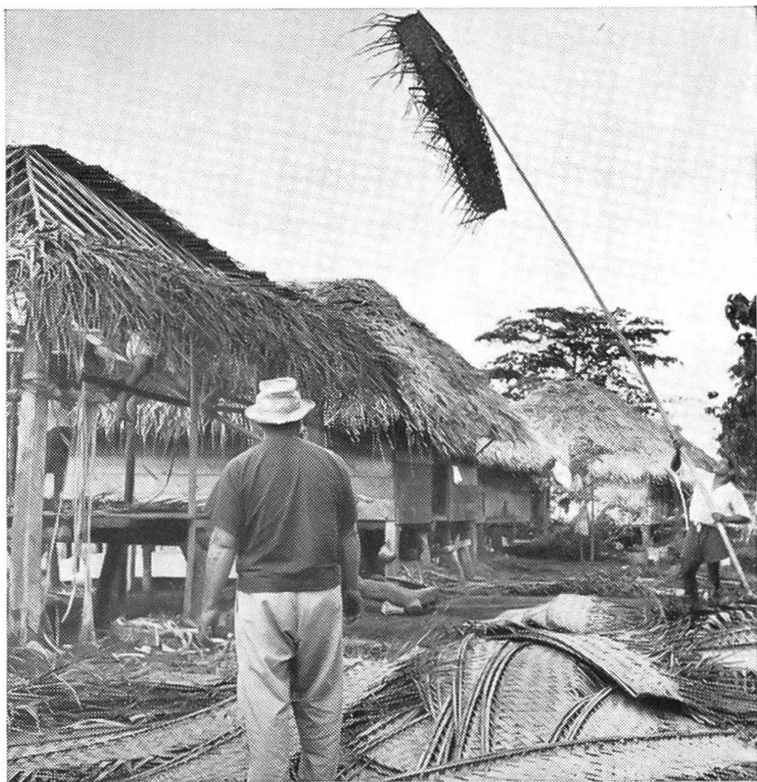
Le stuoie vengono issate sul tetto mediante lunghe pertiche.

Occorrono parecchie di queste stuoie, lunghe 180 cm e larghe 50 cm. Per una casa di media grandezza ne abbisognano circa 750 pezzi, mentre che per una casa più grande bisogna calcolarne fino a 1500 pezzi. La sovrapposizione delle diverse stuoie avviene di regola nello stesso modo usato da noi, per cui la sovrapposizione si fa dal basso all'alto, alla distanza di 10 cm tra una e l'altra stuoia. Anche qui la stabilità avviene col solito uso delle cinghie di corteccia.