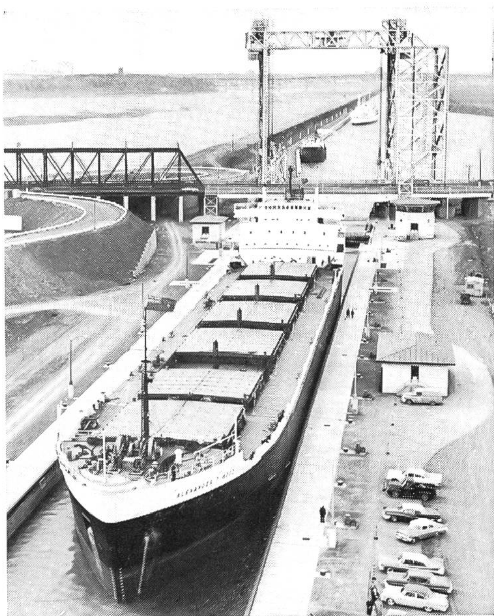
La nave «Alexander T. Wood» di 14326 tonnellate di stazza, superate le chiuse di San Lambert, si avvia verso i laghi canadesi, risalendo il fiume San Lorenzo.

Così dal 1954 gli Stati Uniti d'America e il Canada sfruttano questa importante via d'acqua non solo per i traffici marittimi, ma anche per le forze idriche. Il 26 giugno 1959, la regina Elisabetta II e il presidente Eisenhower hanno inaugurato ufficialmente questa nuova arteria di navigazione fluviale. In questo modo gli Stati Uniti d'America hanno, per così dire, creato una quarta costa marittima, lungo la quale sorgono milioni di città, di centri industriali e fertilissime regioni agricole.