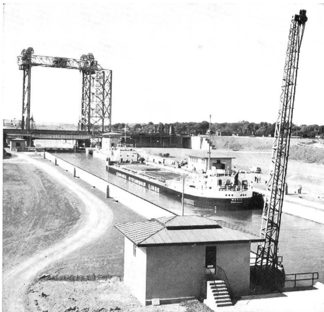
Una delle grosse chiuse sopra Montreal.

il bacino del San Lorenzo, così le chiuse, che regolano i vari dislivelli del terreno, vengono sfruttate come forze idriche a pelo d'acqua di particolare interesse per l'economia del Canada. Evidentemente queste chiuse regolano il deflusso delle acque, migliorando in questo modo la navigazione fra le tratte.