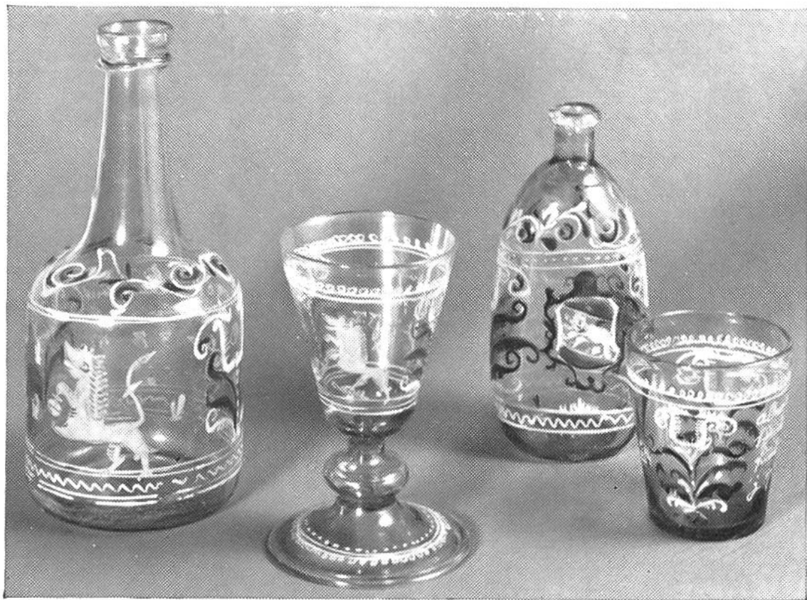
Bottiglie e bicchieri a colori vivaci di fabbricazione locale (Entlebuch) secolo 18.mo e 19.mo.

delabri vengono perlopiù situati nel mezzo e sono di preferenza d'argento o di porcellana.