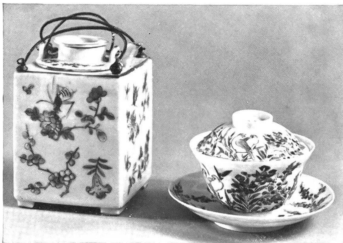
Teiera e tazza di porcellana cinese, 18.mo secolo

se già esistevano come prodotti della fabbrica Hafner di Winterthur, nota particolarmente per la confezione delle famose stufe con testate di terracotta a colori. Nel 18.mo secolo lo stile andava raffinandosi tanto nella casa borghese, come in quella patrizia. Così la tavola veniva apparecchiata con vari tipi di terraglie e con porcellane fini.