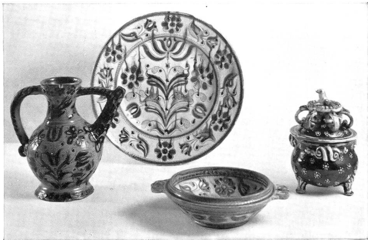
Maioliche locali di Faenza, 18.mo secolo.

Nel medioevo la tavola per la mensa era ancora poco apparecchiata; spesso bastava un solo piatto di portata, posto nel mezzo, dal quale i commensali si servivano, così come oggi ancora si può vedere in alcune regioni della Svizzera.