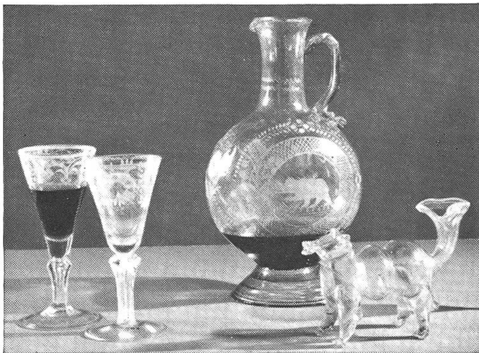
Bicchieri e bottiglia in vetro molato del 18.mo secolo.

La porcellana europea venne fabbricata solo nel 1710 in Germania, dove tuttora esistono le note fabbriche di Meissen, di Nymphenburg, di Frankenthal, di Ludwigsburg e altre ancora.