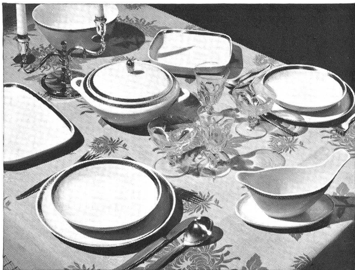
Servizio moderno di porcellana di Langenthal.

Così venivano confezionati vasi decorativi per fiori, con disegni di tulipani e margherite stilizzati. Altra terraglia con disegni rustici veniva da parecchie fabbriche, sparse un po' ovunque nel Cantone di Berna e caratterizzate da disegni a tinte vivaci.