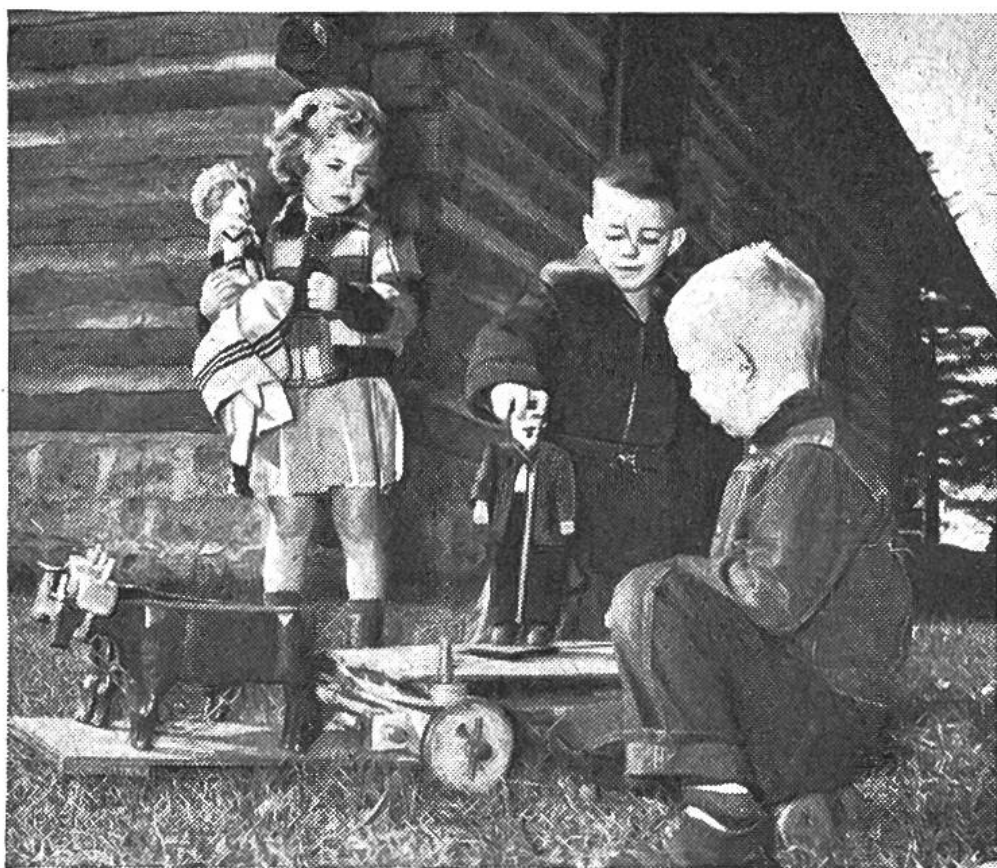
Schnitzen ist eine Freizeitbeschäftigung einiger Glarner. Wird dieses Spielzeug gezogen, so dreht sich der Bauer auf dem Wagen im Kreise.