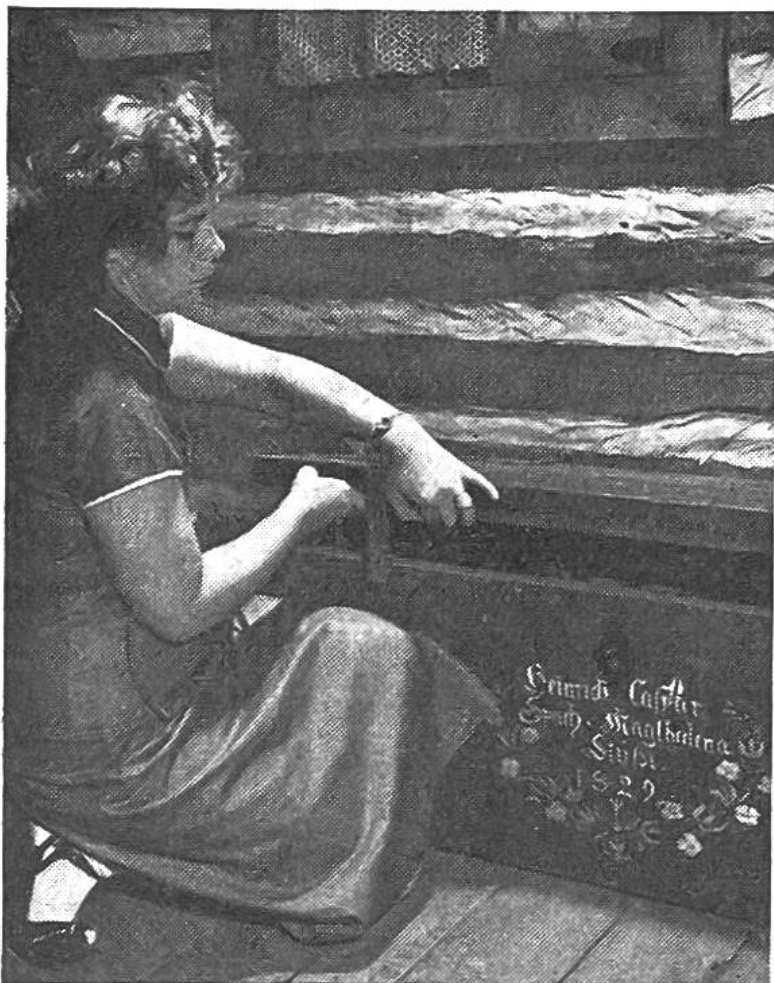
In schweren Holztruhen schleppten die Einwanderer ihre Kleider und Geräte nach Amerika. Eine Truhe aus dem Jahre 1829 ist noch heute im Museum zu sehen.