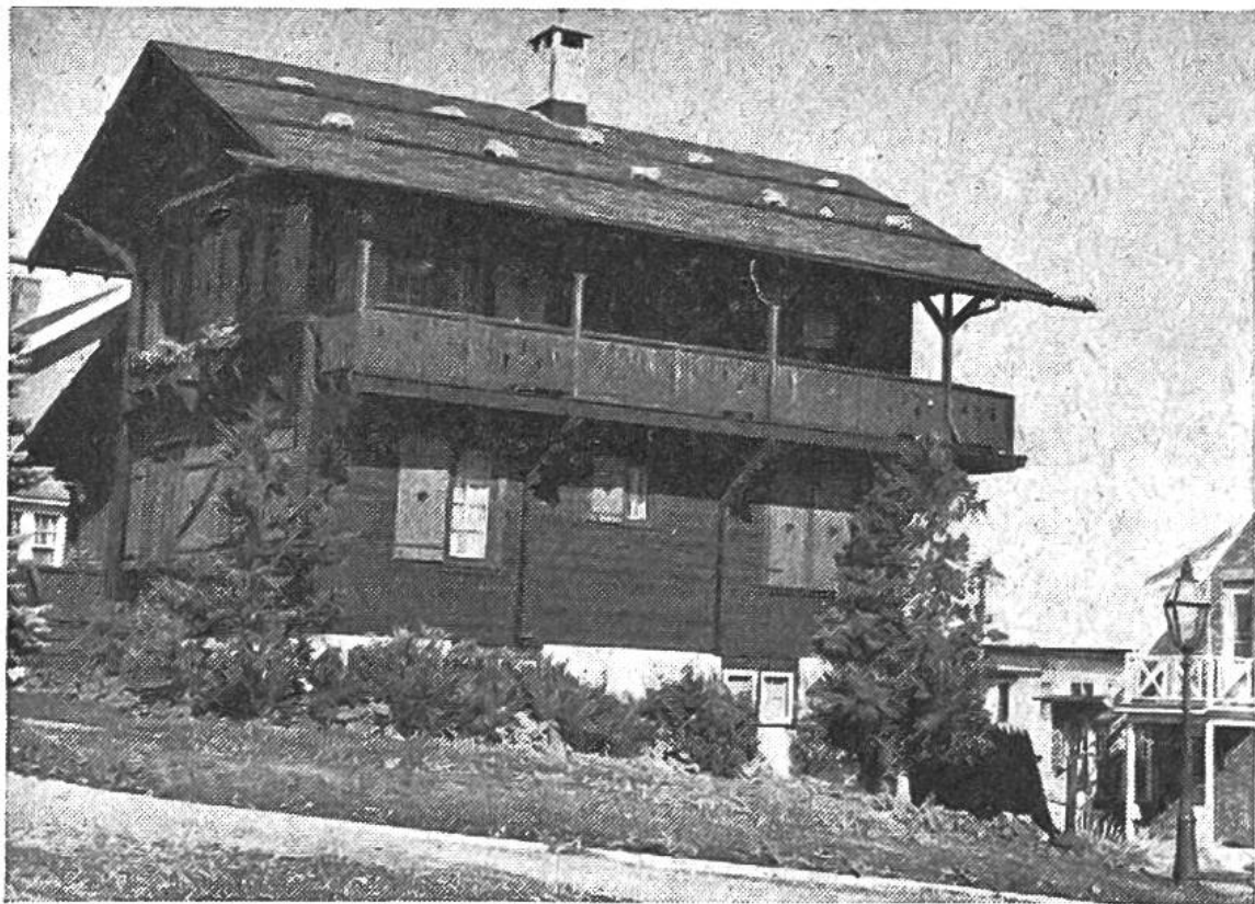
8000 km von der Schweiz entfernt steht dieses Chalet inmitten der Kleinstadt Neu-Glarus.