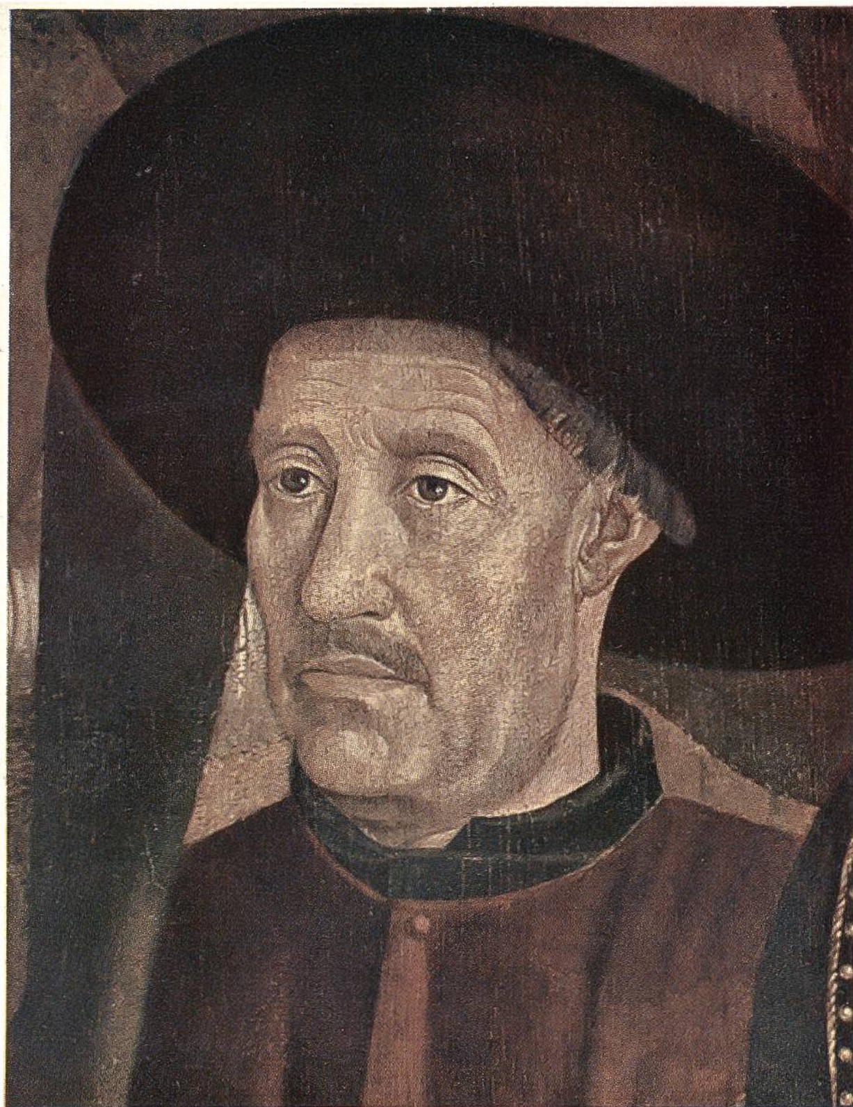
Heinrich der Seefahrer (Teilstück), von Nuno Gonçalves, Lissabon, 15. Jahrhundert. (Kunstmuseum, Lissabon.)