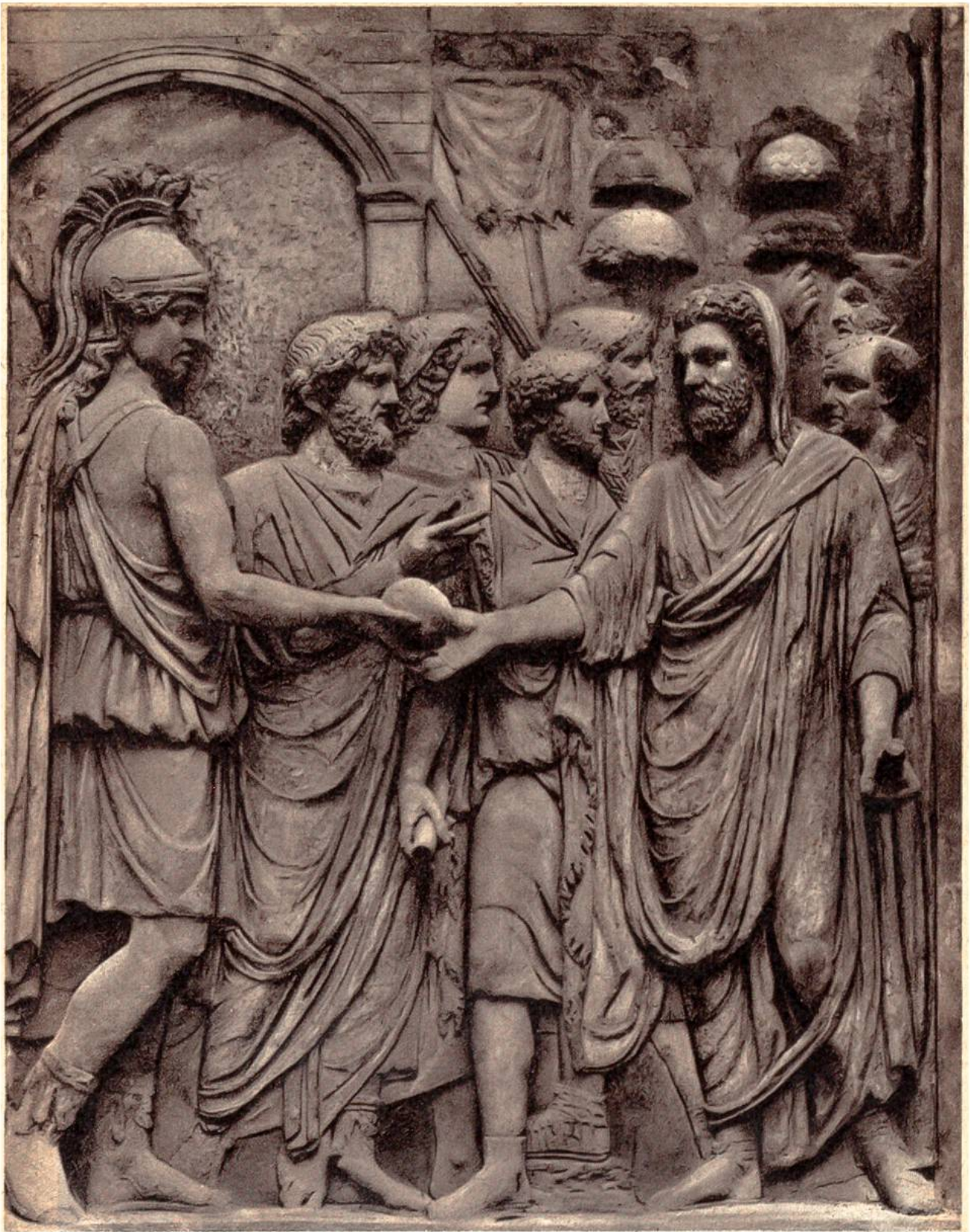
Dem römischen Kaiser Claudius werden die Symbole der Herrschaft überreicht (41 n. Chr.). Antikes Relief. (Palazzo dei Conservatori, Rom.)