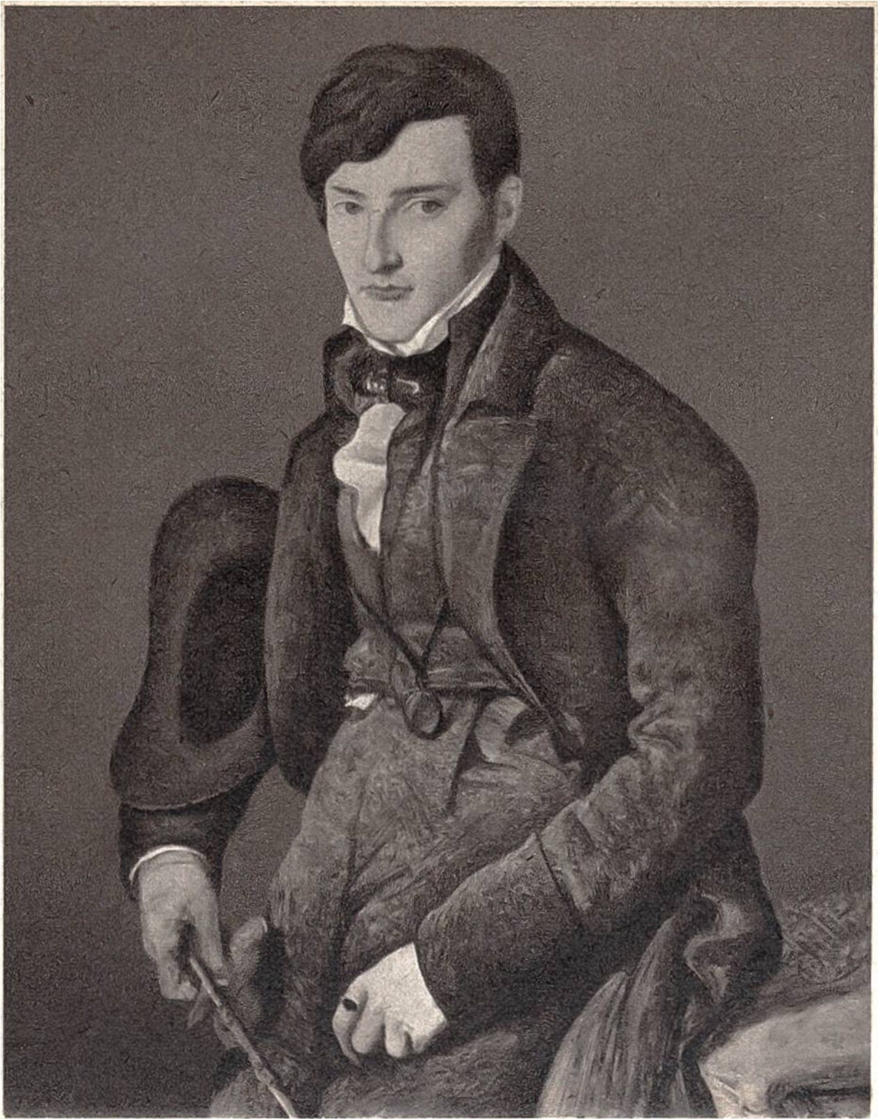
Porträt des Botanikers Gilibert, von J.-A.-D. Ingres, Paris, 1780–1867. (Museum, Montauban.)