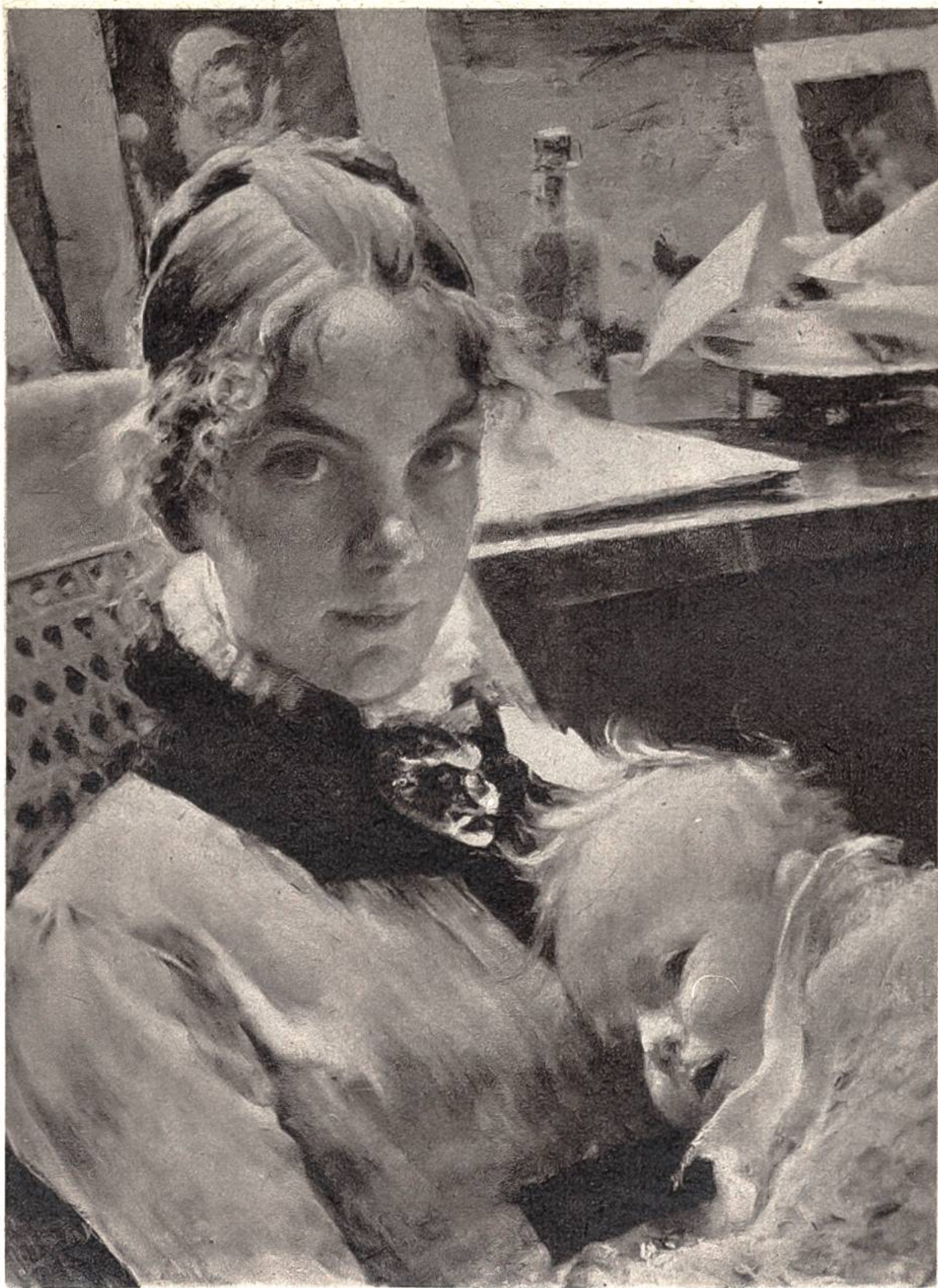
Atelier-Idyll, von Carl Larsson, Lundborn, 1853–1919. (Nationalmuseum, Stockholm.)