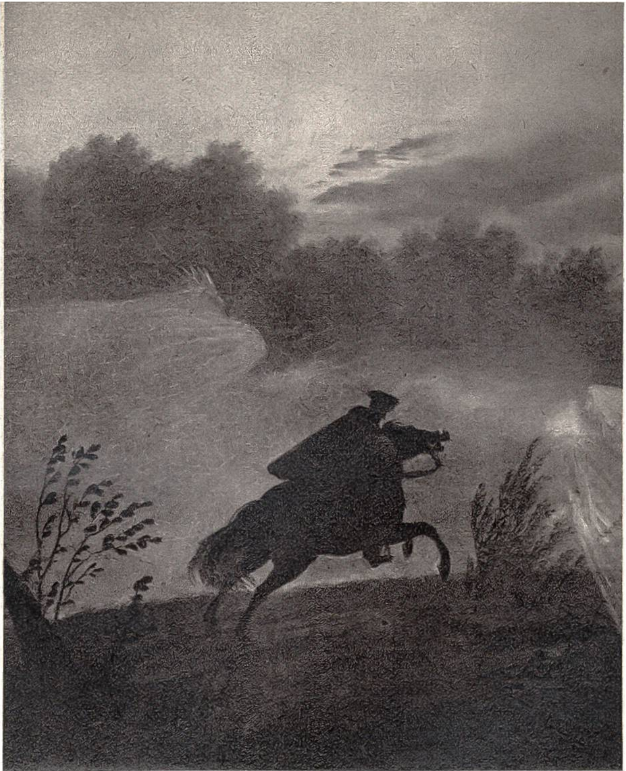
Der Erbkönig, von Carl G. Carus, Dresden, 1789–1869. (Kunsthalle, Hamburg.)