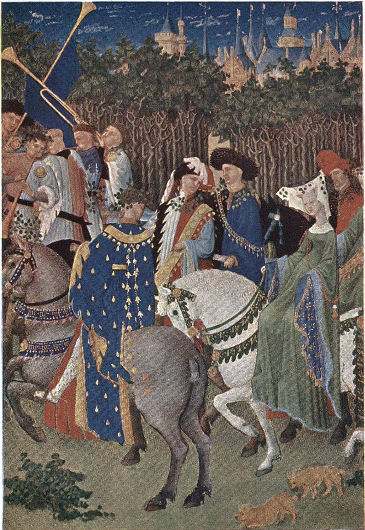
«Maikönigin» und Vornehme reiten, mit Blattgirlanden geschmückt, unter Trompetenklängen durch den Frühlingswald. Französische Miniatur im «Stundenbuch» des Herzogs de Berry, 15. Jahrhundert. (Musée Condé, Chantilly.)