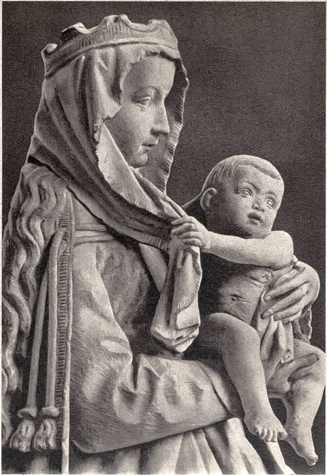
Maria mit dem Kinde. Steinskulptur von Nicolaus Gerhaert von Leyen, Oberrhein, um 1460. (Museum für Kunst und Gewerbe, Hamburg.)