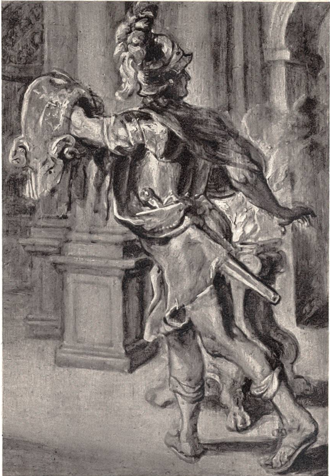
Jason mit dem Goldenen Vlies, von Peter Paul Rubens, Antwerpen, 1577–1640. (Kunstmuseum, Brüssel.)