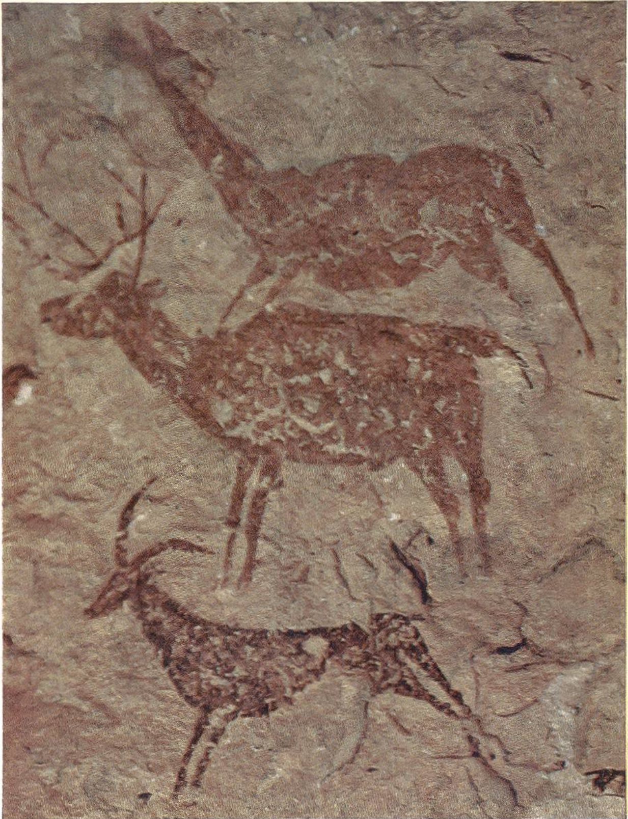
Hirschkuh, Hirsch und Wildziege. Felsmalerei an einer ostspanischen Fundstelle, Provinz Valencia, aus der Mittelsteinzeit (ca. 5000 v. Chr.).