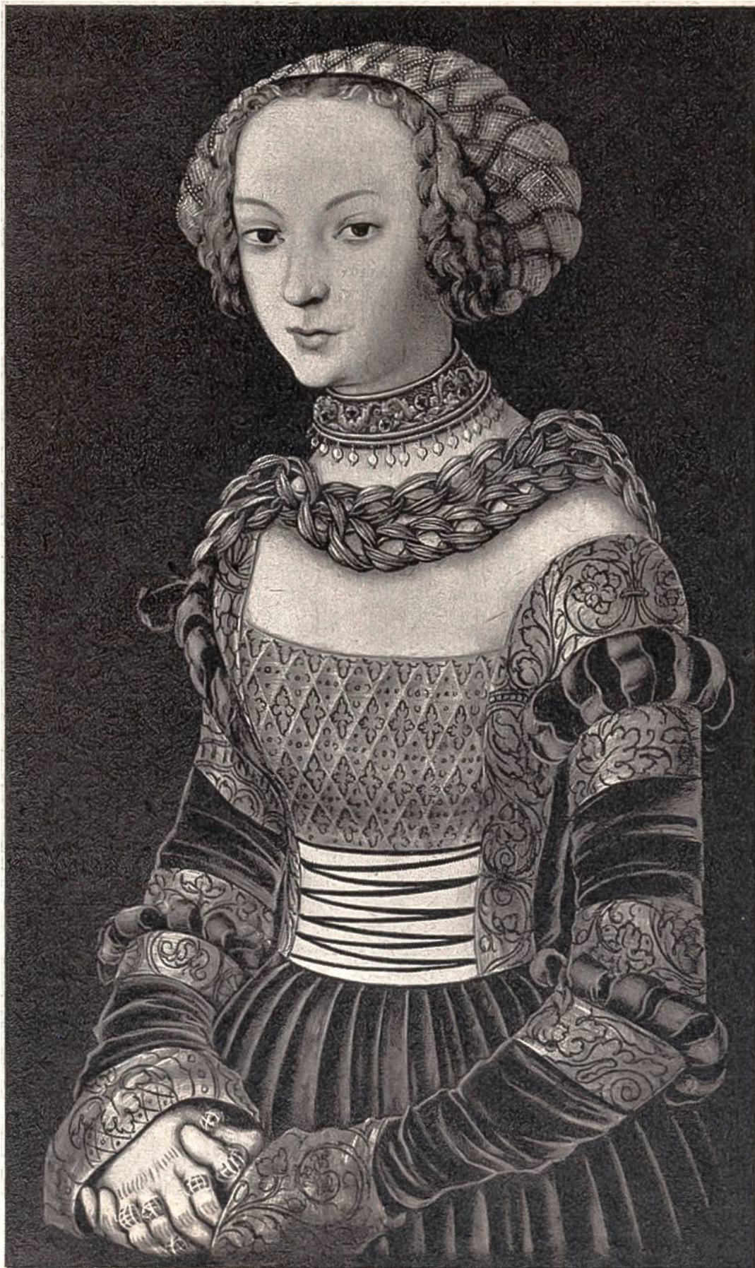
Porträt einer jungen Dame, von Lucas Cranach dem Älteren, Weimar, 1472–1553. (Kunstmuseum, Kopenhagen.)