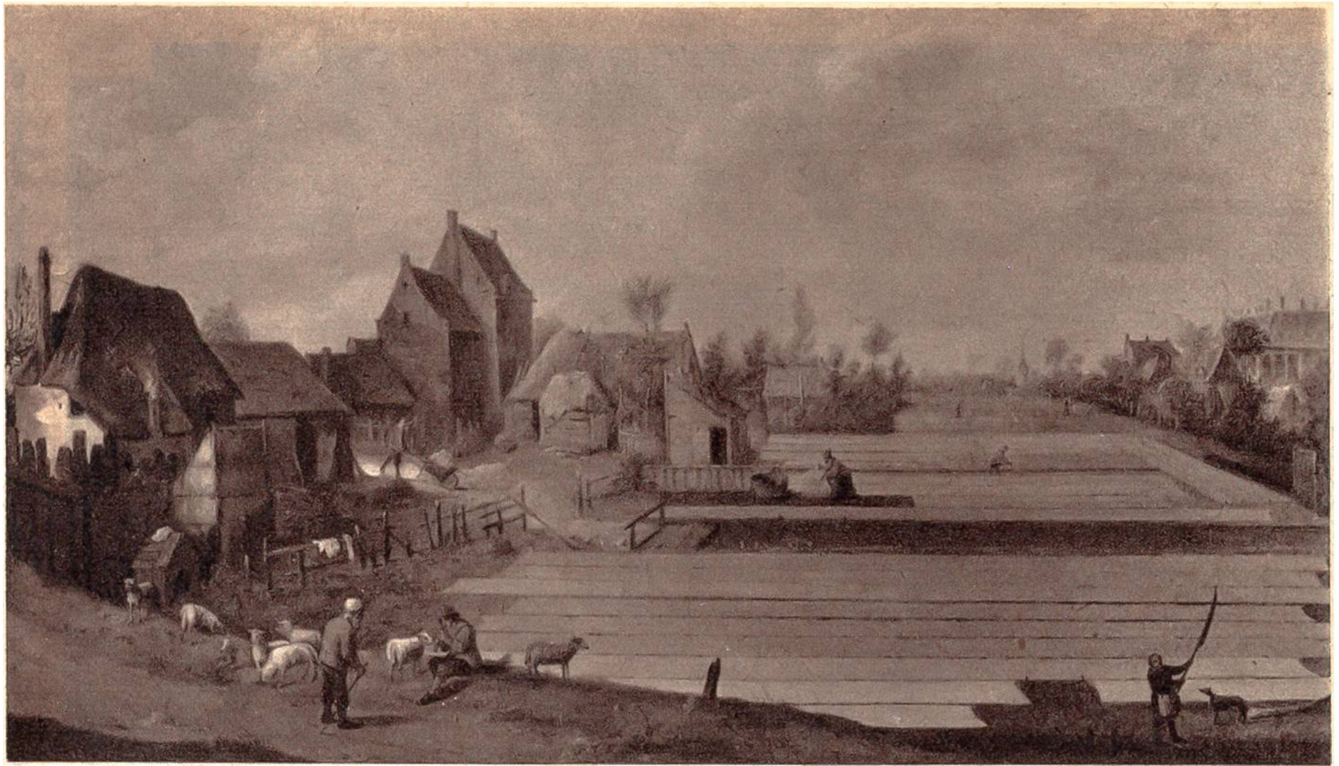
Die Bleiche, von David Teniers dem Jüngeren, Antwerpen, 1610–1690. (Kunsthalle, Hamburg.)