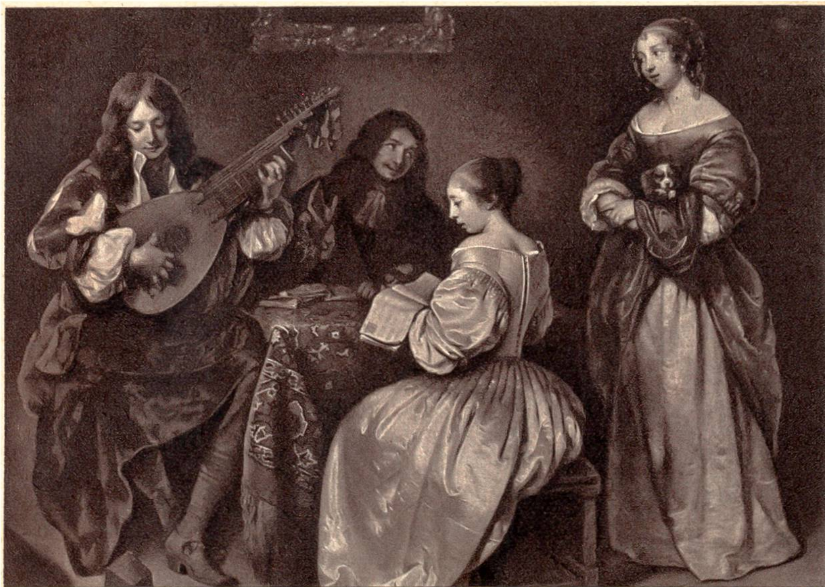
Musikalische Unterhaltung, von Caspar Netscher, Den Haag, 1639–1684.