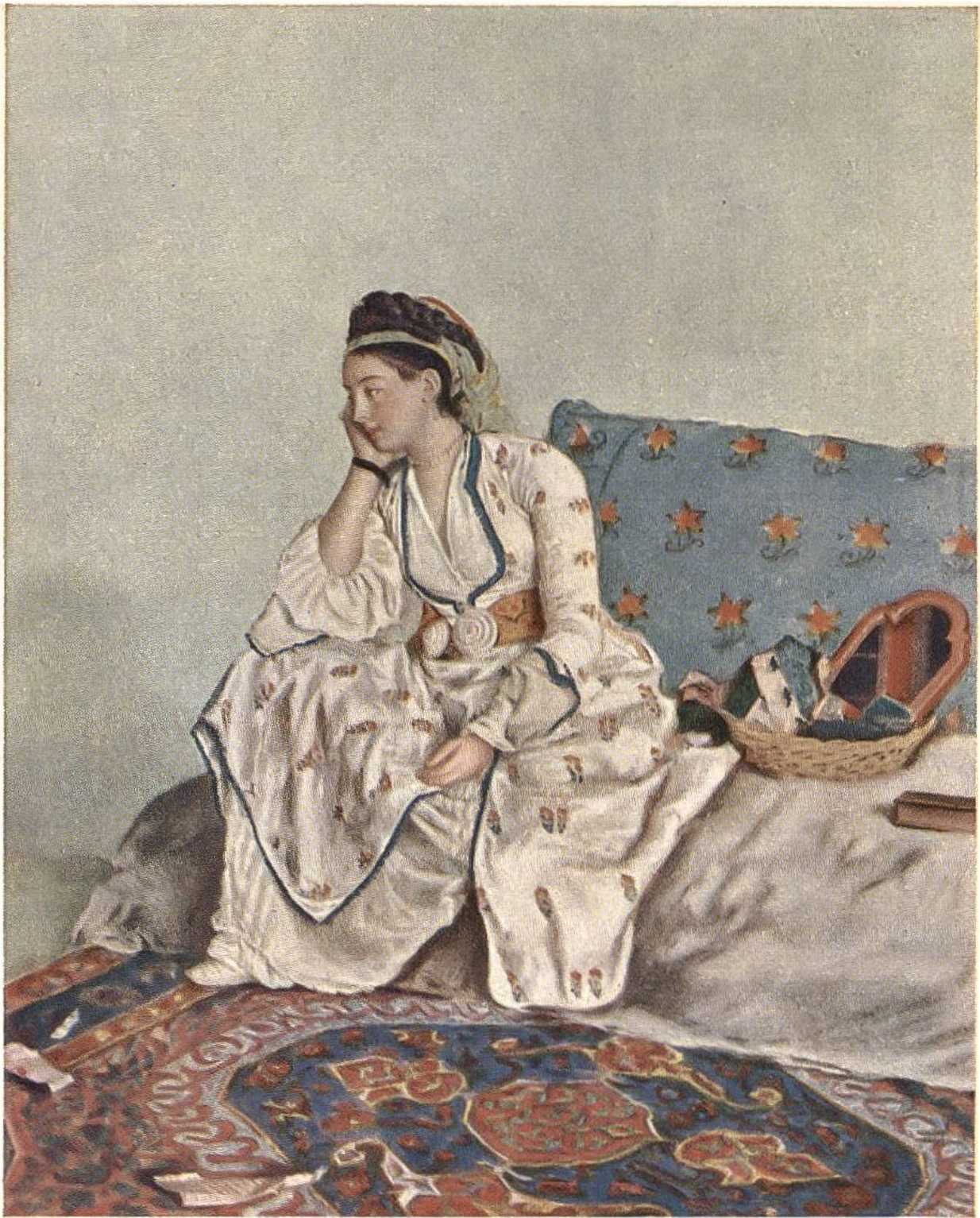
Die Gräfin von Coventry, von Jean Etienne Liotard, Genf, 1702–1789. (Kunstmuseum, Genf.)