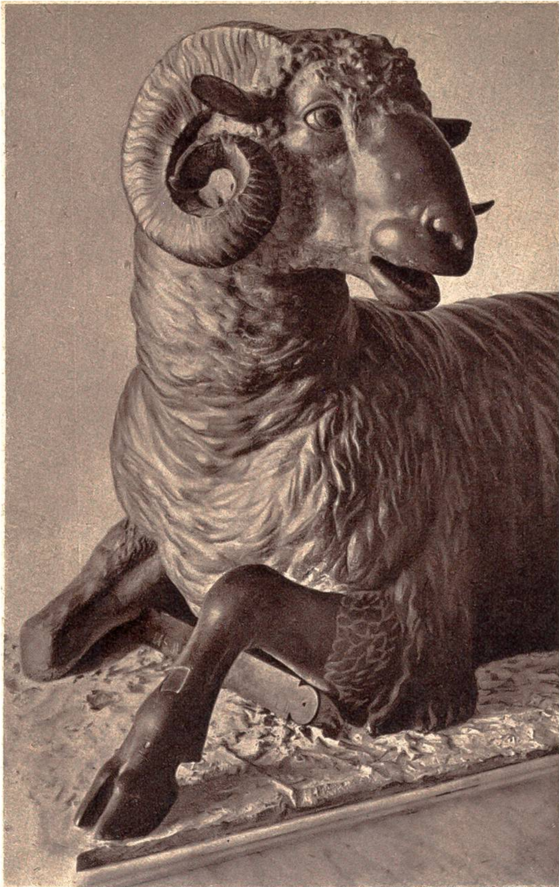
Widder, Teilstück einer griechischen Figur aus dem 3. Jahrhundert v. Chr., in Syrakus gefunden. (Nationalmuseum, Palermo.)