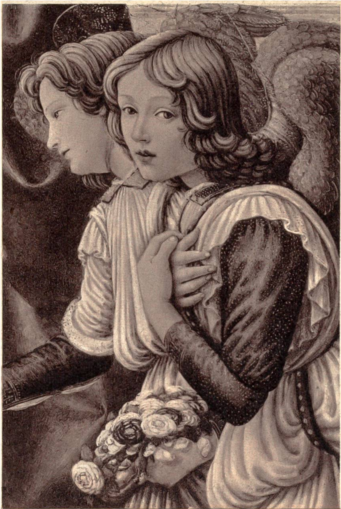
Engel mit Blumen, Teilstück eines Gemäldes von Filippino Lippi, Florenz, um 1457–1504. (Galleria Pitti, Florenz.)