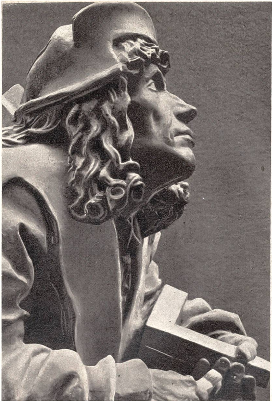
Selbstbildnis von Anton Pilgram, Bildhauer und Architekt, an dem von ihm 1513 erbauten Fusse der Orgel im Wiener Stephansdom.