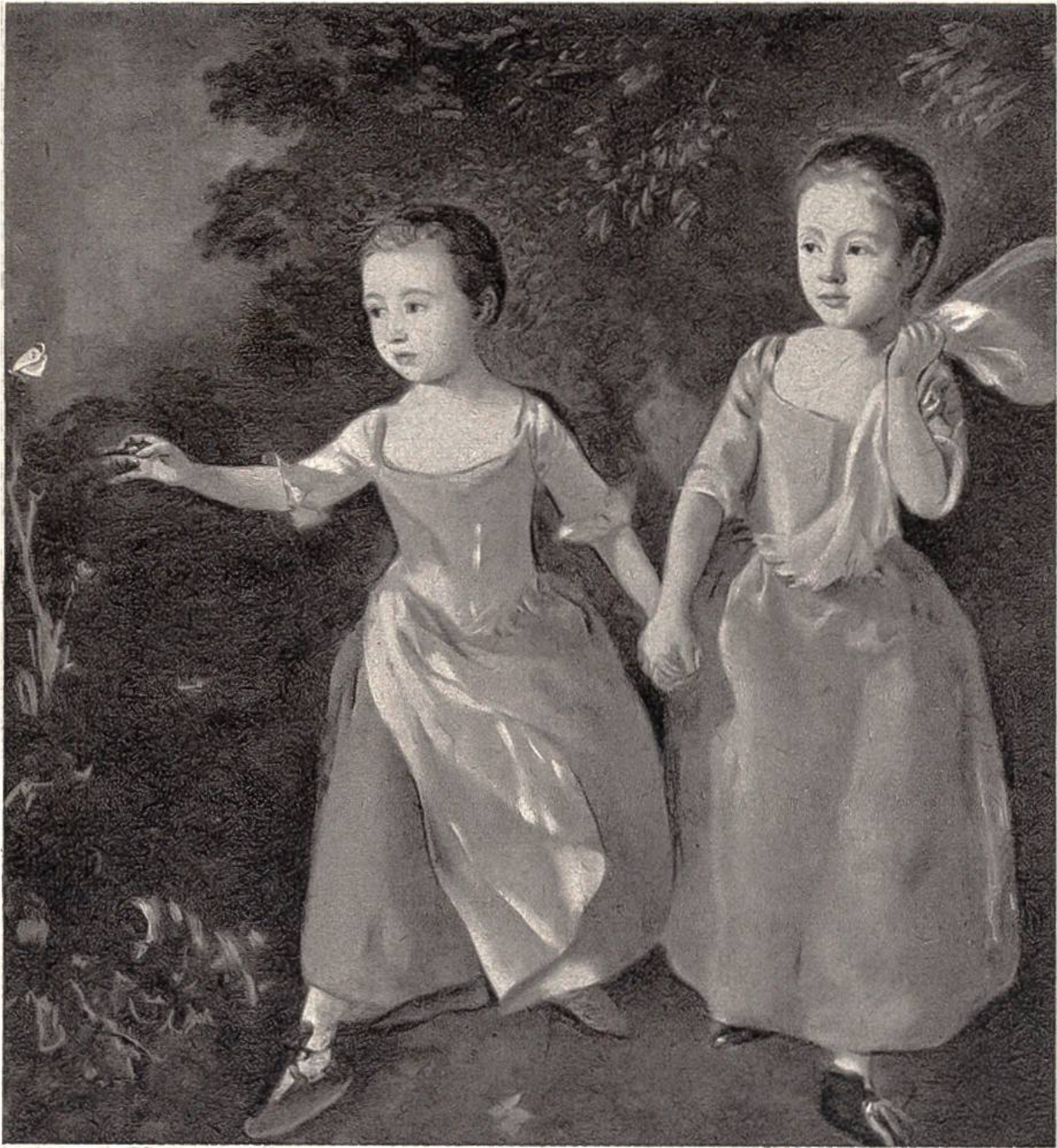
Die Töchter des Malers beim Schmetterlingsfang, von Thomas Gainsborough, London, 1727–1788. (National Gallery, London.)