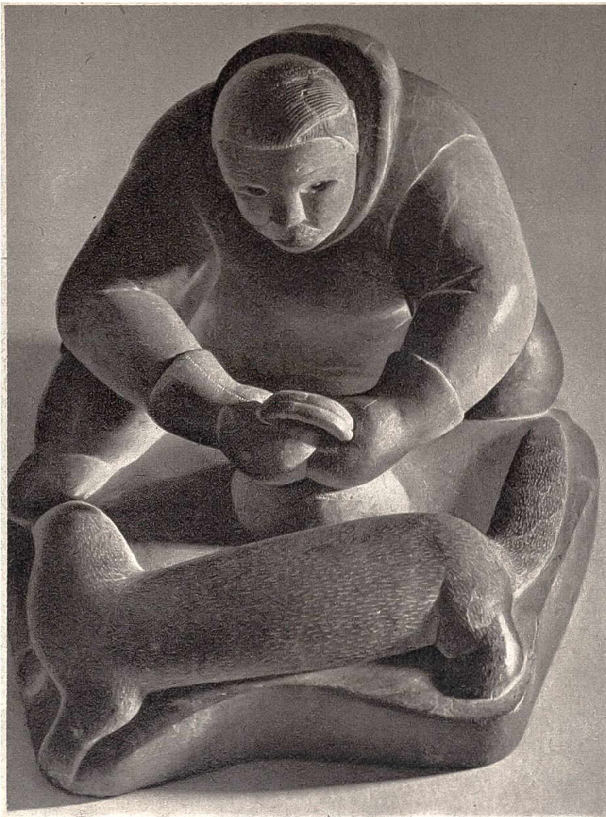
Eskimo mit Eisfuchs. Moderne Specksteinskulptur aus Arktisch Kanada.