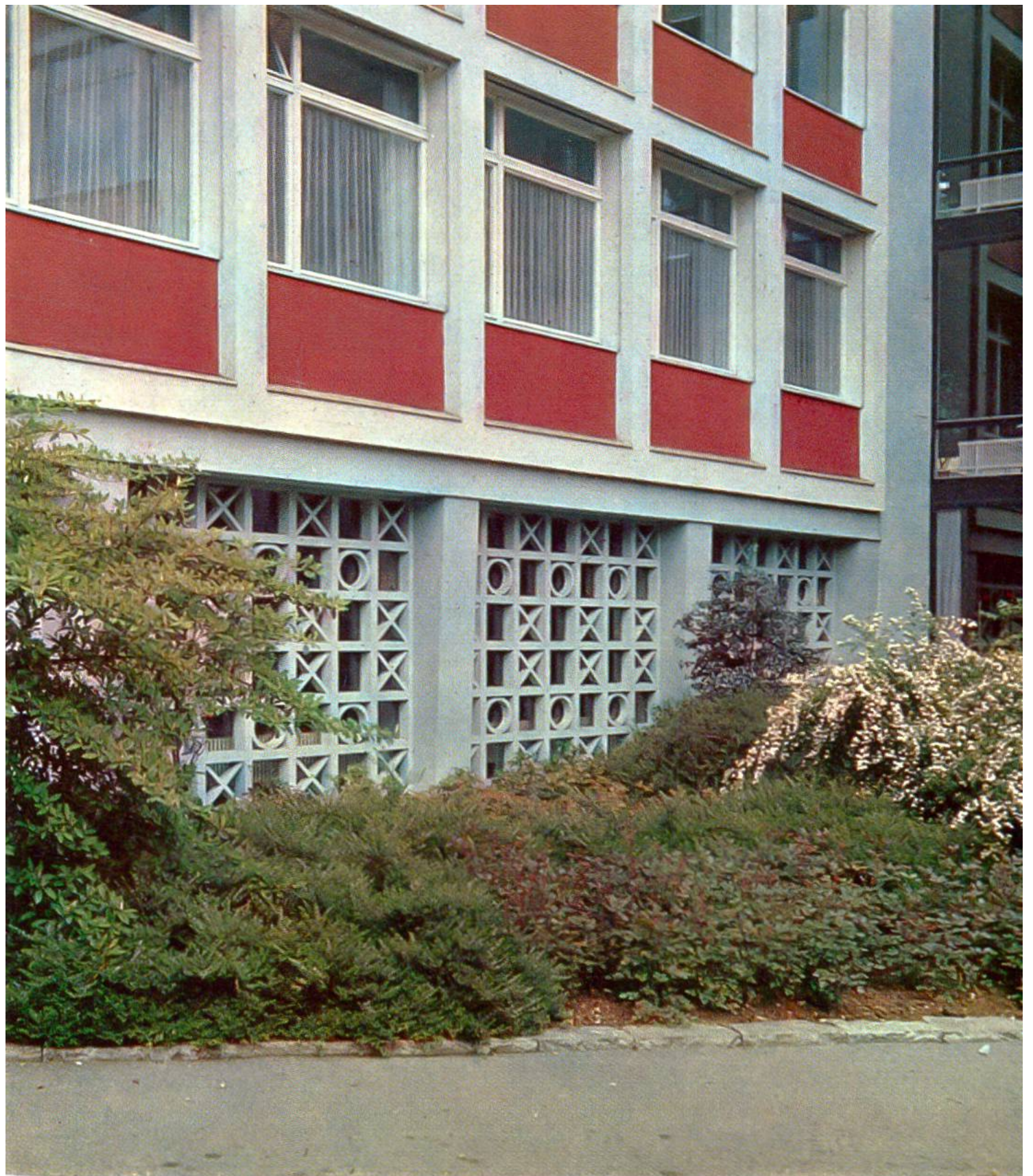
Kaufmännische Berufsschule, Bern. Stahl, Glas, Beton und Farbe des modernen Baues vertragen sich ausgezeichnet mit der Bepflanzung und den Natursteinen der Gartenanlage. (Siehe Seite 266.)