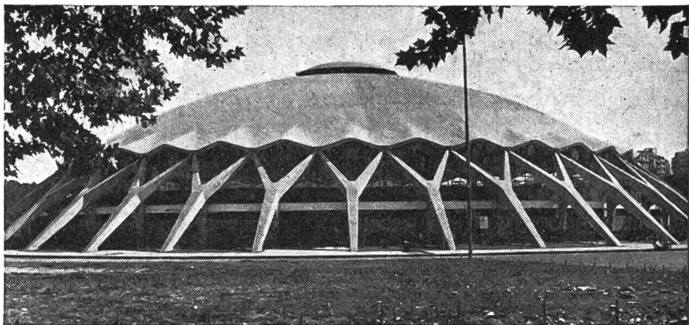
Für die Olympischen Spiele in Rom 1960 erbauter kleiner Sportpalast.

beton als Ersatz für Eisenbeton verwendet. Durch die Vorspannung der Betonelemente mit speziellem Draht oder Kabel wird viel weniger Eisen benötigt; die Querschnitte können bei gleichen Belastungsannahmen erheblich verringert werden.