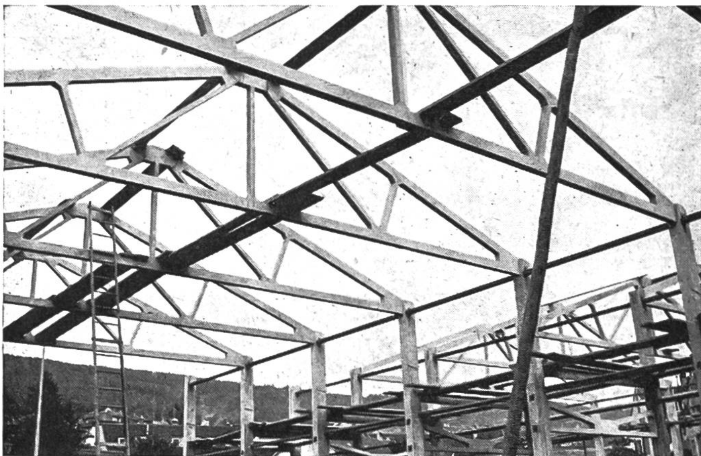
Hallenkonstruktion aus vorfabrizierten Betonelementen.

Hauptsache aus Quarz und andern schwer angreifbaren Mineralien. Abgeschliffene Gesteinstrümmer, vorwiegend Quarz und Alpenkalk mit einer Korngrösse von 5–60 mm, bilden das Kies. Diese Zuschlagstoffe werden im Kieswerk mit den modernsten Maschinen und Einrichtungen ausgebeutet. Die einzelnen Körner fallen unter Ausnützung der Schwerkraft von Maschine zu Maschine, werden gewaschen und aussortiert. Moderne Gewichts-dosieranlagen gestatten nachher wiederum, genaue Mischungen zu erstellen.