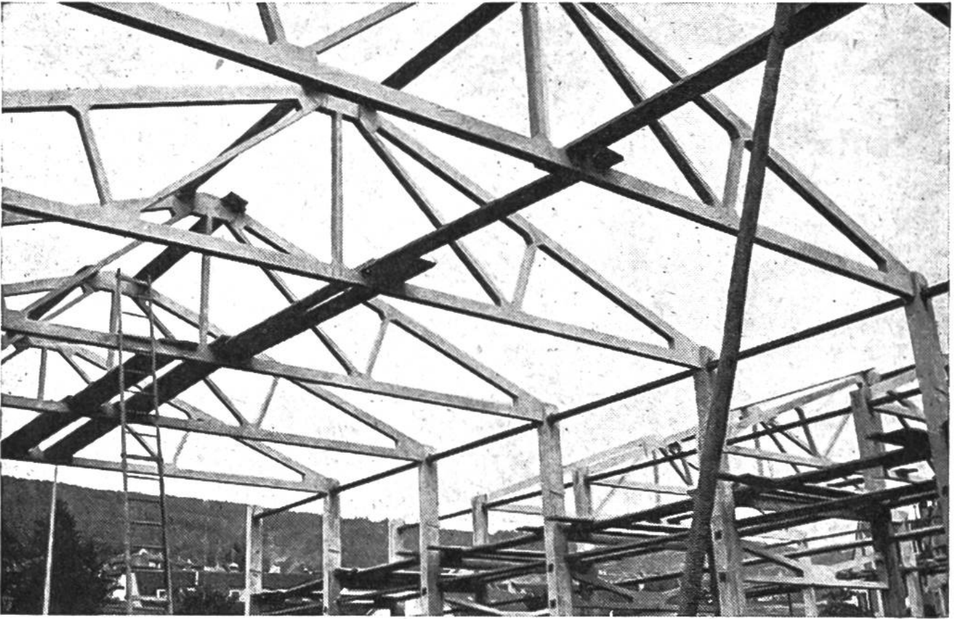
Hallenkonstruktion aus vorfabrizierten Betonelementen.

Hauptsache aus Quarz und andern schwer angreifbaren Mineralien. Abgeschliffene Gesteinstrümmer, vorwiegend Quarz und Alpenkalk mit einer Korngrösse von 5–60 mm, bilden das Kies. Diese Zuschlagstoffe werden im Kieswerk mit den modernsten Maschinen und Einrichtungen ausgebeutet. Die einzelnen Körner fallen unter Ausnützung der Schwerkraft von Maschine zu Maschine, werden gewaschen und aussortiert. Moderne Gewichts-dosieranlagen gestatten nachher wiederum, genaue Mischungen zu erstellen.