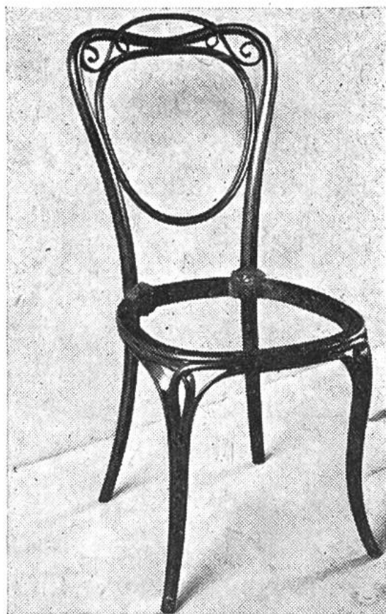
«Thonet»-Stuhl ohne Sitzfläche aus dem Jahre 1836. (Technisches Museum Wien.)

Überall in der modernen Bauweise ist das vorfabrizierte Betonelement sehr geschätzt, hat es doch seine Eignung glänzend bewährt. Beton ist nicht nur feuersicher, rostfrei und wetterfest, sondern auch sehr gefällig im Aussehen und vielfältig in den Anwendungsmöglichkeiten. Kurze Lieferfristen und rasche Montage ermöglichen eine sehr schnelle Bauweise; dadurch wird vielfach auch eine enorme Baukostensenkung erreicht. Dank den hervorragenden Eigenschaften des guten Betons werden noch nach Jahrzehnten, ja nach Jahrhunderten die kommenden Generationen Zeugen unseres Schaffens sein.