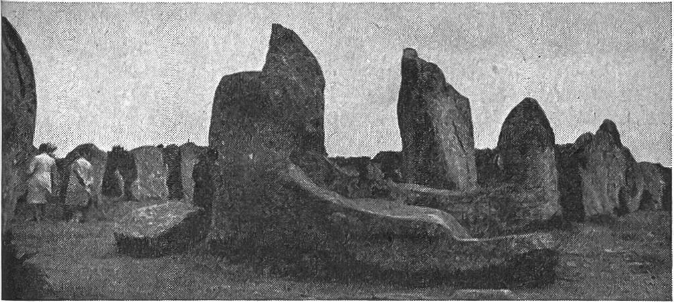
Die Steinallee von Kermario bei Carnac in der Bretagne. Sie besteht aus zehn parallel laufenden Steinreihen, die sich über eine Strecke von 1120 m verfolgen lassen und Steine bis zu 6 m Höhe umfassen.