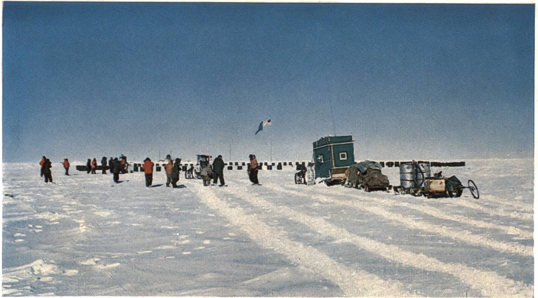
Am 4. Jan. 1958 ist der neuseeländische Teil der Trans-Antarktis-Expedition unter Sir Edmund Hillary nach einer Reise von 1500 km über das Inlandeis am Südpol angekommen. Die Bewohner der amerikanischen Südpolstation haben sich zur Begrüßung bei der Fahne der Vereinten Nationen versammelt. Es ist das erste Mal seit dem 18. Jan. 1912 (Robert F. Scott), dass eine mit Bodentransportmitteln reisende Expedition den Südpol erreicht hat (s. S. 201).