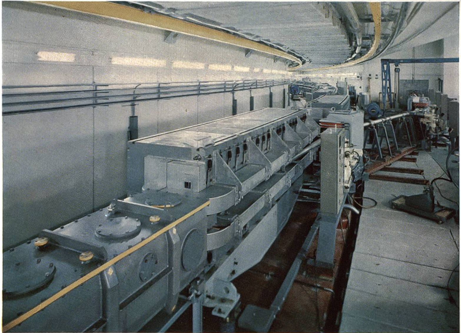
Protonen-Synchrotron im europäischen Kernforschungszentrum CERN in Genf.

Dieser Teilchenbeschleuniger von 25 Milliarden Elektronen-Volt (eV) stellt zurzeit die leistungsfähigste Anlage der Welt dar. Hier wird das Innere des Ringtunnels (rund 628 m lang) mit einigen Magneteinheiten gezeigt.