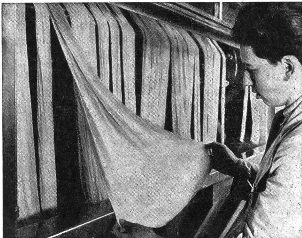
Farbton und Egalität von Trikotstoffen werden auch während des Färbens auf der Maschine laufend überprüft.

seln und Wannen prasselte ein fröhliches Feuer und heizte das Färbebad. Heute stehen Hochdruckapparate aus Edelstahl, der gegen Chemikalien unempfindlich ist, in den hellen, sauberen Betriebsräumen. Temperaturen bis zu 140^{\circ}\text{C} werden angewendet, um die oft widerspenstigen Fasern mit dem Farbstoff zu verbinden, und der ganze Färbeprozess kann vollautomatisch gesteuert werden. Oft sind viele Versuchsfärbungen im Laboratorium nötig, bis das richtige Rezept gefunden ist; es geht ja nicht nur darum, dass das Garn gefärbt ist, auch die wertvollen Eigenschaften dürfen während des Färbens nicht verlorengelassen. So steht denn am Ende aller Behandlungen eine genaue Kontrolle der Echtheiten und sonstigen Eigenschaften. Ständig sind Chemiker und Ingenieure damit beschäftigt, die Rezepte und Behandlungsverfahren zu überprüfen, bessere zu finden und nach Wegen zu suchen, auch die ständig neu entwickelten synthetischen Fasern genau so gut zu färben wie die altbekannten; denn eine neue Faser wird erst dann für die Bekleidung brauchbar, wenn sie auch färbbar ist.