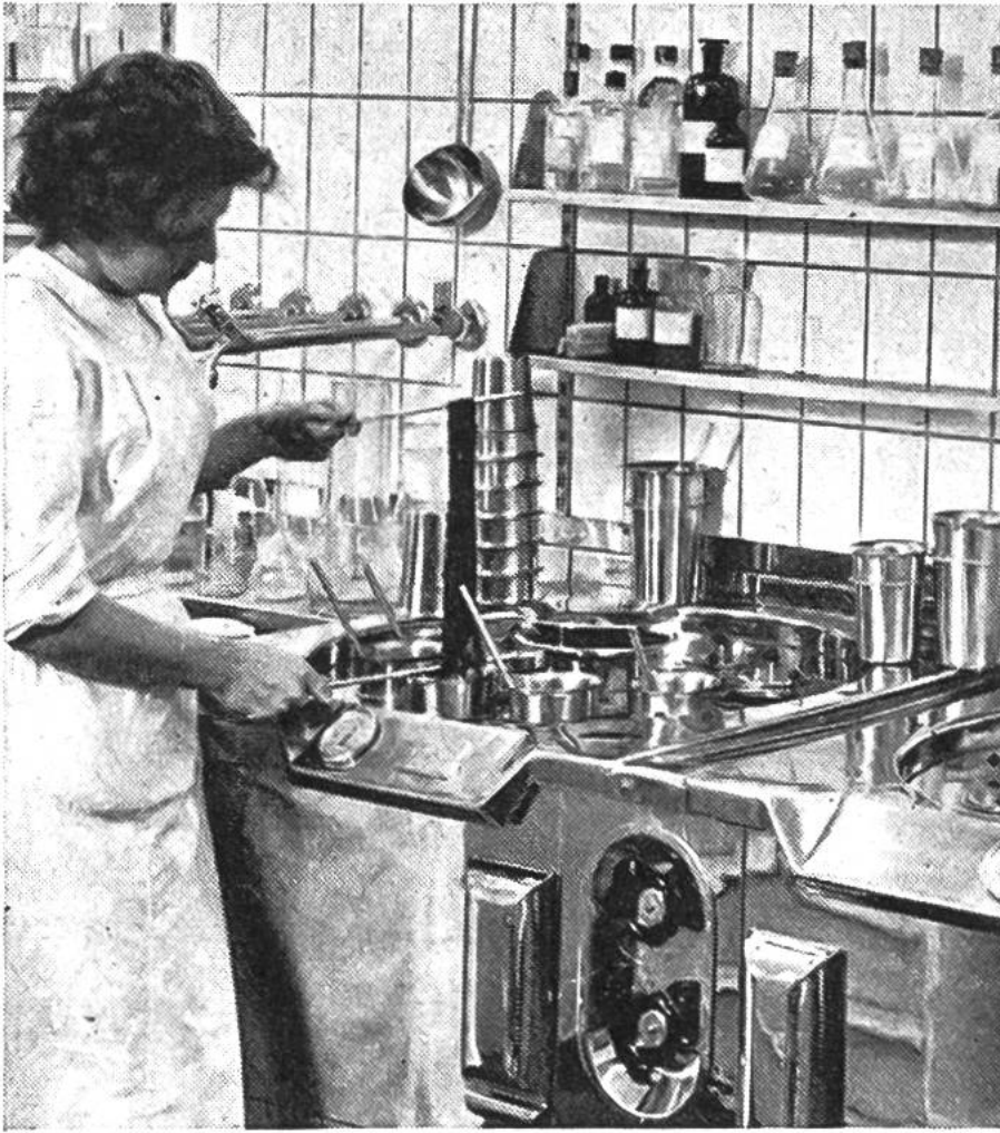
Im Laboratorium einer modernen Grossfärberei werden die Färberezepte an kleinen Musterstrangen ausgearbeitet.

immer zugegangen, bis in die neuere Zeit gehörten Kuhkot, Schafmist und Urin zu den Chemikalien, die man brauchte; denn die Ammoniaksynthese war noch nicht gefunden.