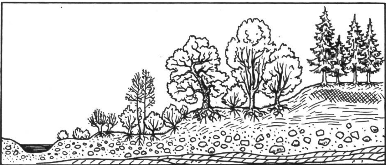
Natürliche Pflanzenbesiedlung in einem Flusstal. Von unten nach oben: Auwald, Laubmischwald, Nadelwald.

Im Waldboden verhindert der dichte Baumbestand die rasche Verdunstung des Regenwassers, so dass die Erde wie ein Schwamm längere Zeit feucht bleibt. Diese stete Feuchtigkeit und das Vorhandensein vermodernder Blätter, Nadeln, Baumstrünke usw. begünstigen im Boden das Aufkommen von Schimmel- und Hu-