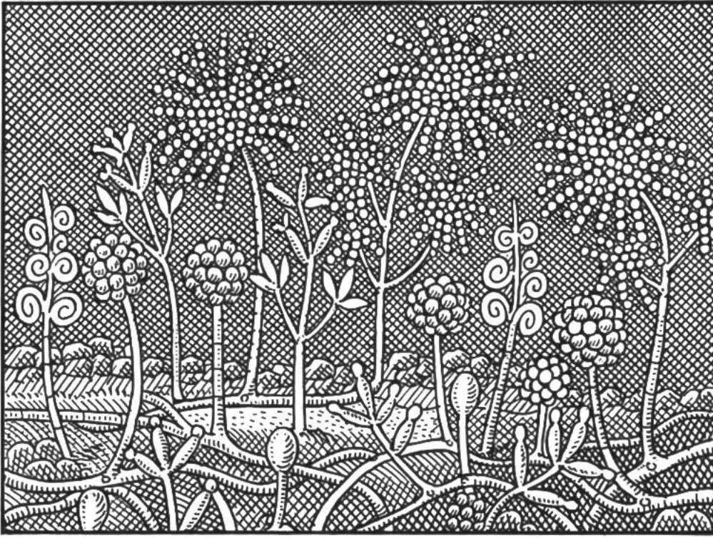
Schimmel- und Humuspilze im feuchten Waldboden.

muspilzen, die ihrerseits für eine rasche Umwandlung des über und im Boden liegenden verwesbaren Materials in fruchtbaren Humus sorgen. In einem an den Standort passenden Laubmischwald ist dank der regen Bodentätigkeit schon am Ende des Sommers nicht mehr viel von dem im vergangenen Spätherbst gefallenem Laub zu sehen. Milliarden unsichtbarer Pilze und Bakterien haben daraus eine neue, dünne Schicht dunkles Erdreich bereitet. Auch im Ackerboden gibt es Pilze; aber sie treten der Zahl nach gegenüber den von Auge unsichtbaren Bakterien, den Urtierchen, Algen, Milben, Springschwänzen, Bär- und Rädertierchen, den Insekten, Schnecken und Würmern aller Art doch stark zurück. Fehlt eine schützende Pflanzendecke, so droht im Acker und im Garten rasch die Gefahr der Austrocknung des Bodens und der teilweisen Vernichtung des für das Pflanzenwachstum so wichtigen Bodenlebens. In einem tätigen Boden kann das Gewicht aller dieser Lebewesen allein auf einem Quadratmeter Fläche bei 20 cm Tiefe bis zu 2,5 kg erreichen. Landwirt und Gärtner suchen durch häufiges Lockern der noch unbedeckten Bodenoberfläche der Verkrustung und dem übermässigen Wasserverlust zu begegnen.