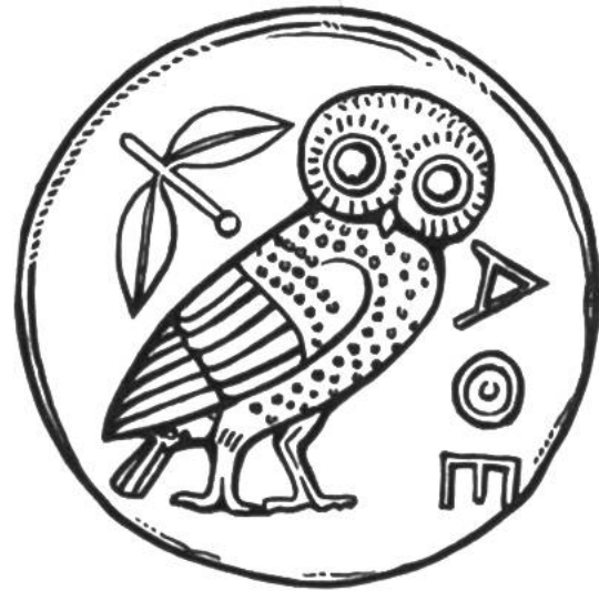
Münze von Athen

415–413 Zug der Athener gegen Syrakus. Alcibiades.