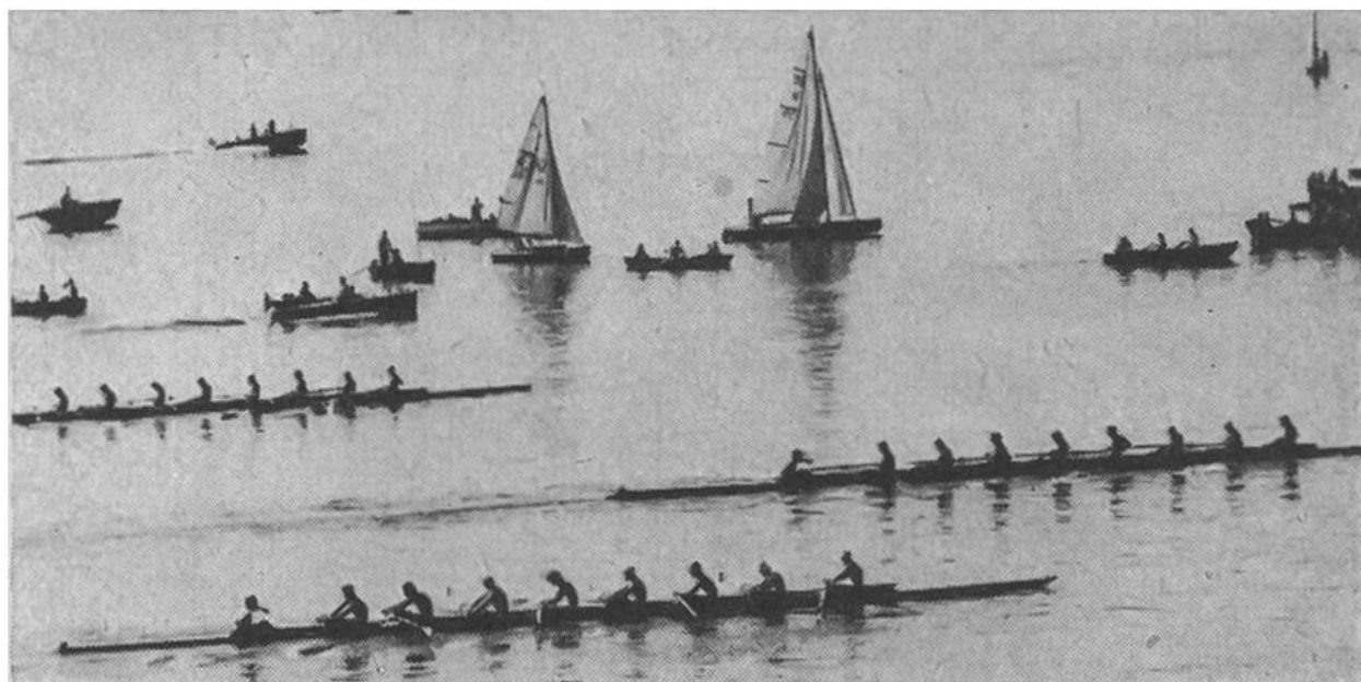
Das Attraktivste für den Zuschauer sind im Rudersport die Achterrennen. Hier ein Débutants-Rennen auf dem Zugersee.

Die Schweizer Ruderer der Gegenwart haben ein schönes Erbe zu verwalten. Ist doch das kleine Alpenland nach Italien (55 Siege) mit 49 Europameisterschaftssiegen in der Zeitspanne 1893 bis 1958 die erfolgreichste Rudernation unseres Kontinentes. Hinter der Schweiz stehen Belgien (45), Frankreich (43), Deutschland (21) und die Sowjetunion mit 12 Siegen. Die Schweiz blieb übrigens in allen sieben Bootsklassen der Europameisterschaften siegreich. Es sind dies Skiff (Einerboot), Doppelskiff (oder Doppelzweier), Zweier ohne und Zweier mit Steuermann, Vierer ohne und Vierer mit Steuermann sowie Achter. Bei den nationalen Meisterschaften wird noch ein Titel mehr ermittelt, nämlich mit der Vierer-Yole-de-mer.