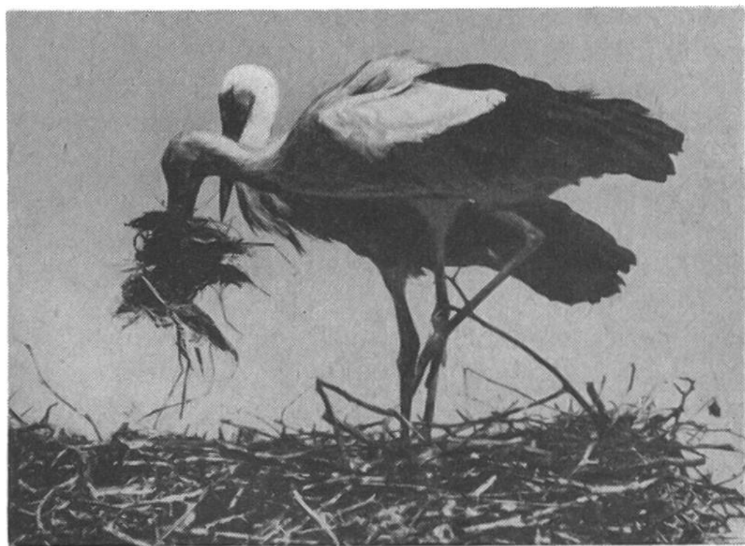
Auf einem Hausgiebel wird das umfangreiche Nest hergerichtet.

Wer heute noch ein richtiges Storchennland sehen will, der geht am besten nach Marokko. Dort gilt Adebar als heilig, wird also nicht verfolgt und findet er noch reichlich Frösche und andere Leckerbissen. Auch werden ihm dort Hochspannungsleitungen viel seltener zum Verhängnis als im technisierten Mitteleuropa. H.