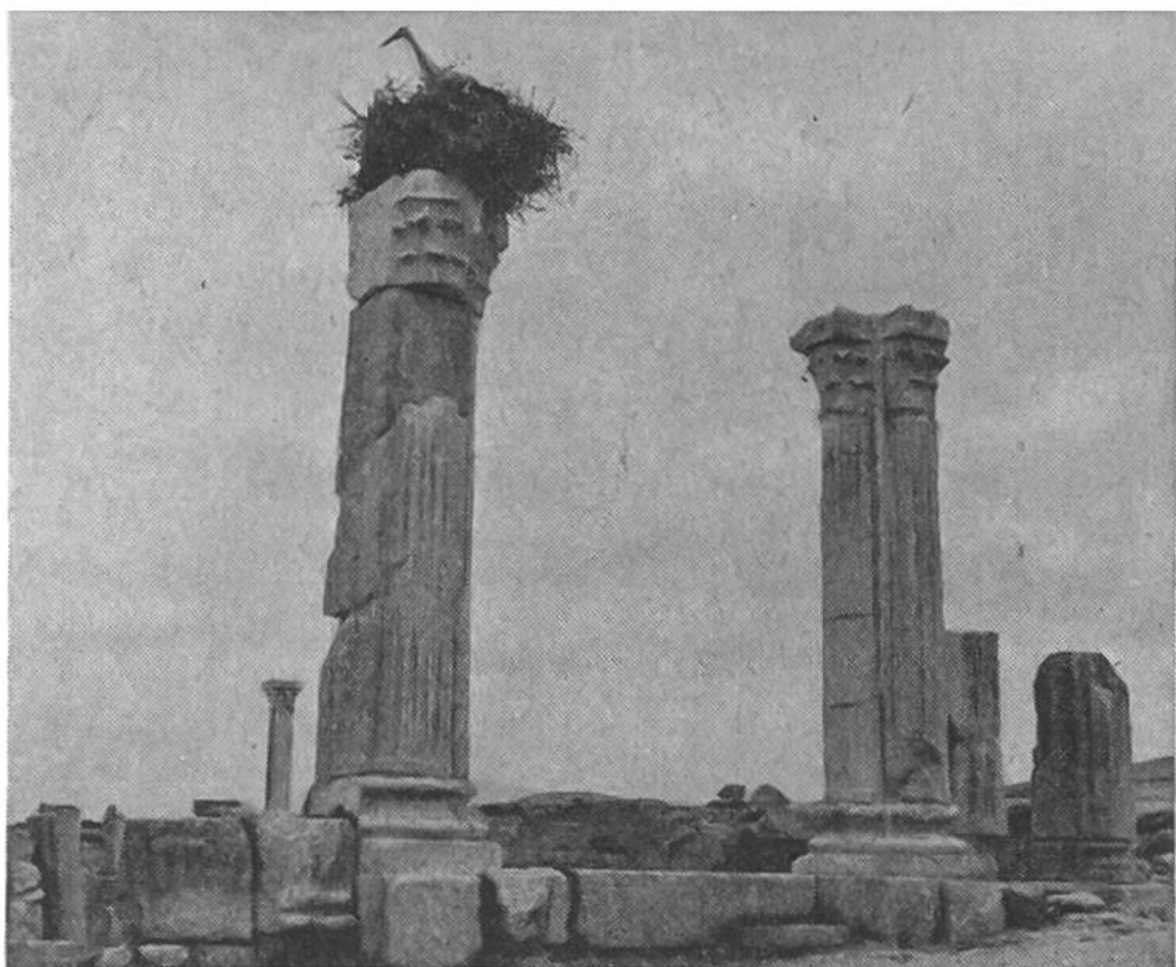
Auch die berühmte Ruinenstadt Volubilis wird von Störchen mit zahlreichen Nestern belegt.

angespannte dunkle Kehlhaut deutlich hervortritt und als Resonanzboden dient. Dann wird der Kopf klappernd langsam nach vorn gebracht, bis die Schnabelspitze beinahe den Boden berührt.