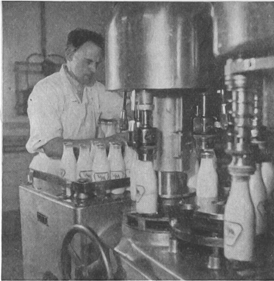
Abfüllmaschine für pasteurisierte Flaschenmilch. Die pasteurisierte Milch wird in grossen Maschinen automatisch in Flaschen abgefüllt.