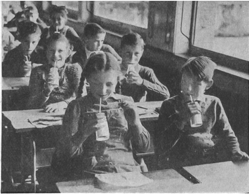
Schulmilch. Wenn die Pausenglocke ertönt, wartet auf jedes Schulkind eine Flasche stärkender Milch.

dig automatische Maschine eingeführt, dort zur Packung geformt, mit Milch gefüllt und zugeklebt. Wenige Augenblicke später kommen die fertigen Milchpakete aus der Maschine heraus. Man nennt sie «Tetra Pak», denn sie haben die merkwürdige Form des Tetraeders, eines Körpers mit vier gleichen Dreieckflächen und vier Ecken. In besondern Drahtgestellen werden sie zum Milchgeschäft gebracht.