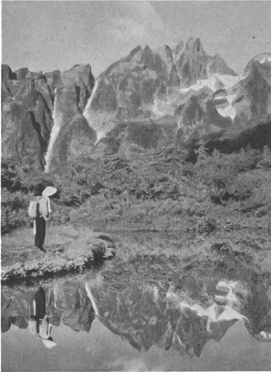
Der Berg Tsurugi, 3002 m, mit Eremiten-Teich Senjin-ike.