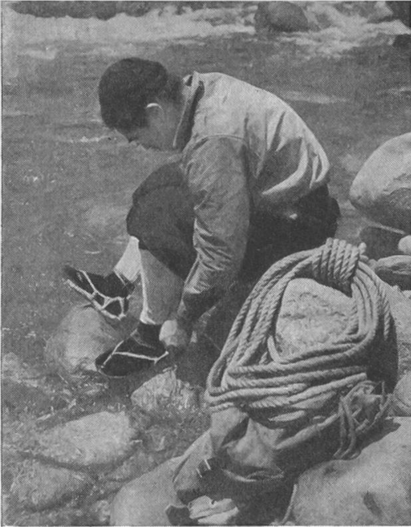
Japanischer Bergsteiger beim Schnüren der Strohsandalen. Neben ihm das Kletterseil und der Rucksack, eine Ausrüstung, die der Japaner von den Europäern übernommen hat.

gann das Bergsteigen ein Sport zu werden. Ebenso wie in Europa wurden die noch nicht bestiegenen Gipfel bezwungen. Immer schwierigere Routen wurden versucht.