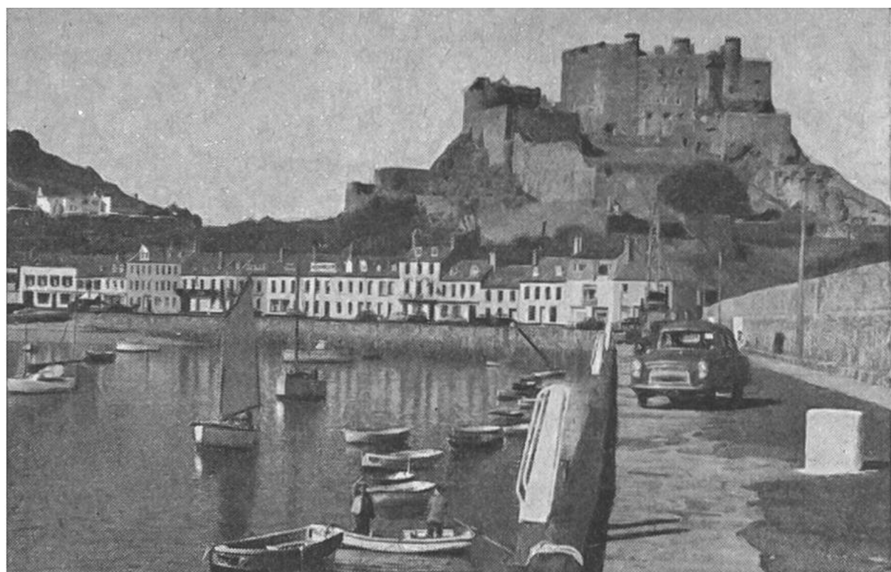
Stolz erhebt sich das aus dem 12. Jahrhundert stammende Schloss «Mont Orgueil» auf Jersey über seinem Dörfchen.