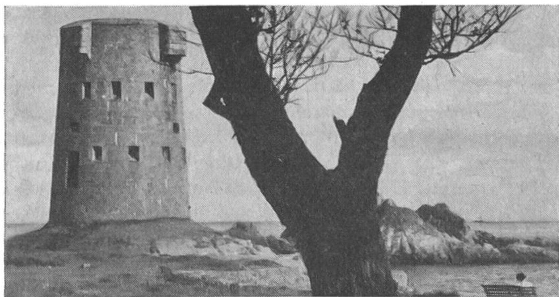
Längs der Küste von Jersey finden wir solch alte Wachtürme. Bei klarem Wetter kann im Hintergrund die Küste von Frankreich erblickt werden.

Die Inseln gehören seit 1066 zu England, regieren sich aber sehr selbständig. Jersey hat ein eigenes Parlament. Englisch und Französisch sind Amtssprachen. Französisch wird von den Inselbauern in einer nun langsam aussterbenden Mundart gesprochen. Jersey ist eine ausgesprochene Ferieninsel mit mildem Klima, beinahe tropischer Pflanzenwelt, alten versteckten Dörfchen und einer abwechslungsreichen Küste. W.K.