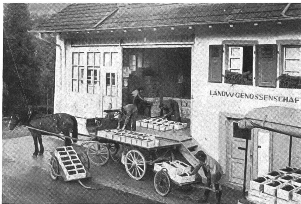
Die Landwirtschaftliche Genossenschaft als örtliche Sammelstelle für Obst und andere bäuerliche Erzeugnisse.