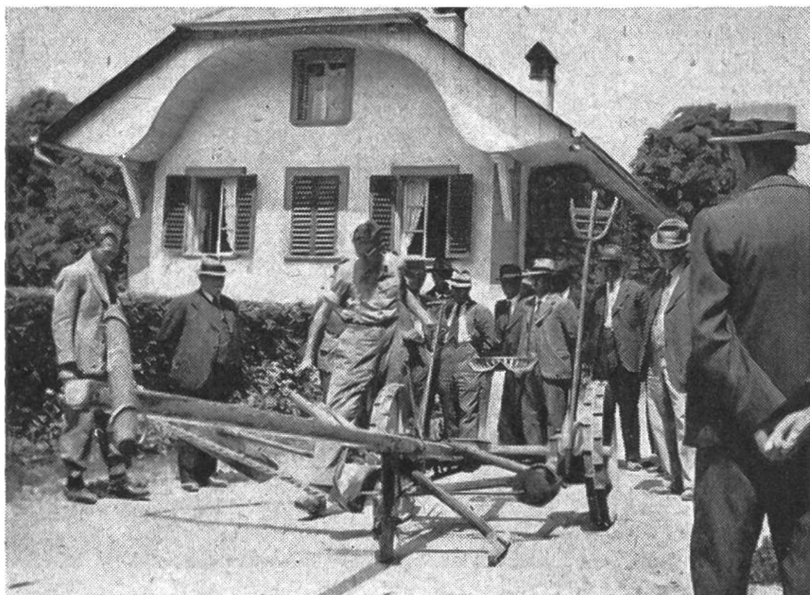
Ein Berufsprüfling (Mitte) weist sich über seine Kenntnisse an der Mähmaschine aus.

rufsprüfung an. Ihr Bestehen bringt dem ehemaligen Landwirtschaftsschüler im Arbeitsbuch den Ausweis als Landwirt mit theoretischer und praktischer Ausbildung ein.