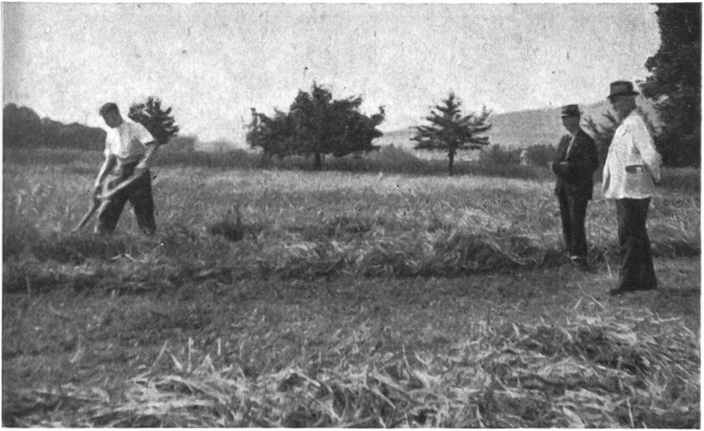
Grasmähen an der bäuerlichen Berufsprüfung. Links ein Prüfling, rechts zwei Prüfexperten.

will. Zunächst einmal lässt sich der Schulentlassene durch den Berufsberater eine geeignete Lehrstelle vermitteln. Bauernsöhne, die zu Hause regelmässig mitarbeiten, haben wenigstens ein Jahr, Nichtbauernsöhne zwei Jahre bei einem fremden Meister zu lernen, bevor sie sich zur Abschlussprüfung melden können. Der Lehrling besucht dabei die landwirtschaftliche Fortbildungsschule und nimmt auch an den gemeinsamen Exkursionen teil. Wer die Lehrlingsprüfung erfolgreich abschliesst, erhält ein Arbeitsbuch mit einem Lehrbrief.