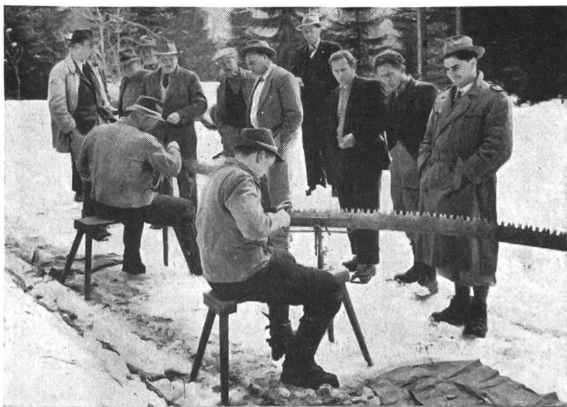
Feilen von Hobelzahnsägen an einem Werkzeugkurs für Waldarbeiter.

Auf vielen sonntäglichen Waldgängen ist dem Bauern fast jeder Baum seines Reviers vertraut geworden. Auf Grund seiner eigenen Beobachtungen, die er vielleicht noch mit einem geschulten