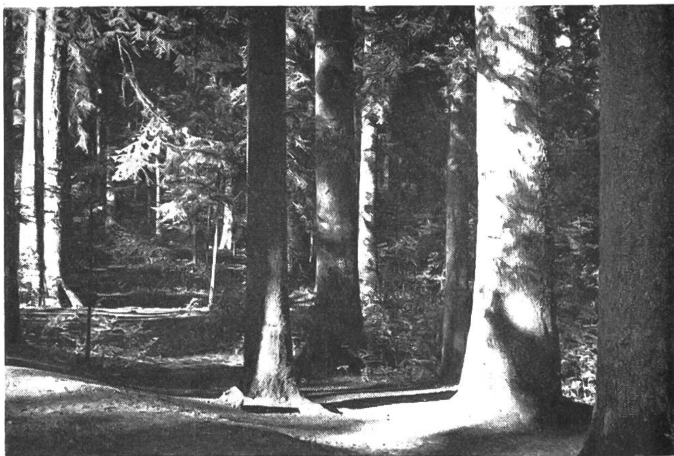
Die in Forstkreisen berühmten dreihundertjährigen Dürsrütitannen im Plenterwaldgebiet von Langnau im Emmental.