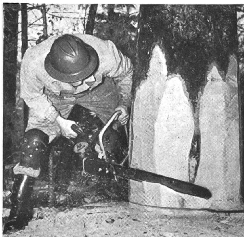
Die neuzeitliche Motorsäge verrichtet rasche Arbeit.

Auf vielen sonntäglichen Waldgängen ist dem Bauern fast jeder Baum seines Reviers vertraut geworden. Auf Grund seiner eigenen Beobachtungen, die er vielleicht noch mit einem geschulten