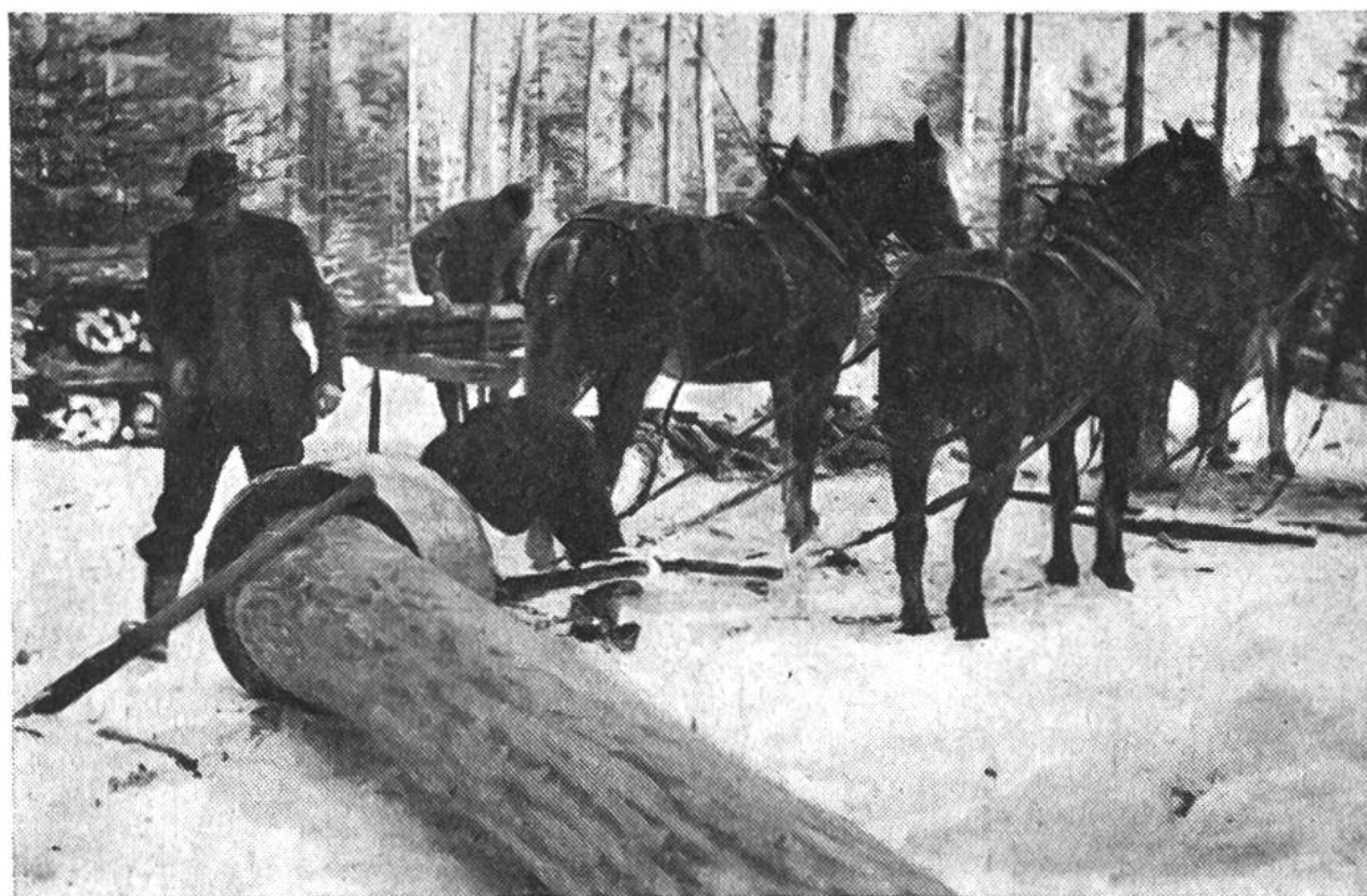
Holzschleifen mit einer Schlepphaube, die das Beschädigen der Wurzelstöcke stehengebliebener Bäume durch den Stamm verhindert.

Brandfall das Bauernhaus oder eine Scheune neu gebaut werden muss oder wenn der durch Seuchen dezimierte Viehbestand erneuert werden sollte. Nur in solchen Fällen wagt sich der sonst sparsame Bauer an das seit vielen Jahren geschonte, wertvolle Starkholz, das ihm nun willkommene Balken und Bretter für den Neubau oder vom Holzhändler das für den Viehkauf nötige Bargeld liefert.