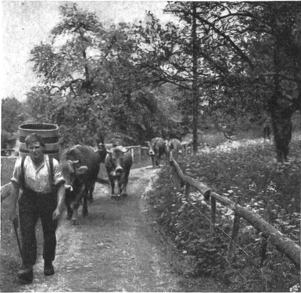
Braunviehherde auf dem Weg zur Frühjahrsweide (Maiensäss).