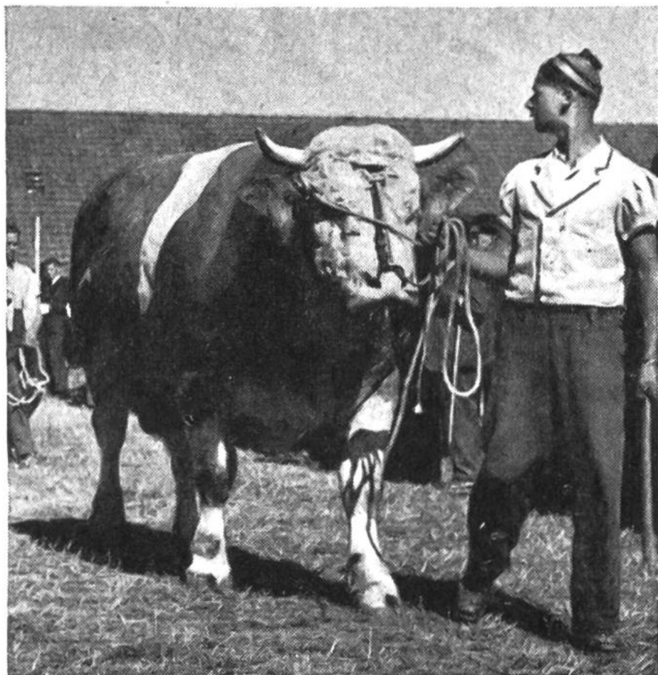
Vorführung eines erstprämiierten Zuchtstiers der Simmentaler Fleckviehrasse.

Rund 180000 Bauernbetriebe halten etwa 1,6 Millionen Stück Vieh, davon ungefähr 900000 Milchkühe.