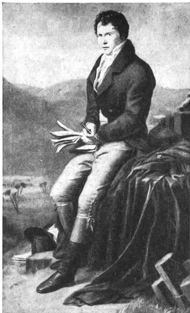
Der junge Alexander von Humboldt in Südamerika, nach einem Gemälde von Karl von Steuben.