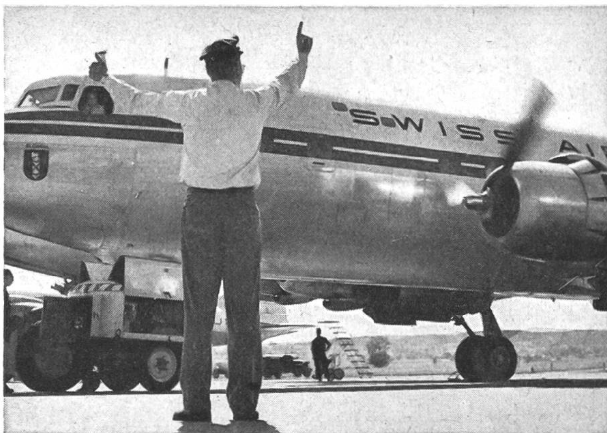
Die Motoren werden vor dem Wegrollen auf die Piste nach besonderen Anweisungen und unter Kontrolle angelassen.

sation gewährleistet einen zuverlässig und reibungslos funktionierenden Betrieb. Ausser der zentralen Leitung: Direktionspräsidium – Planungsdienst – Generalsekretariat – Zentraler Personaldienst – bestehen vier Departemente: Finanzen – Verkehr und Verkauf – Operation – Technik, ferner die Direktion für die Westschweiz.