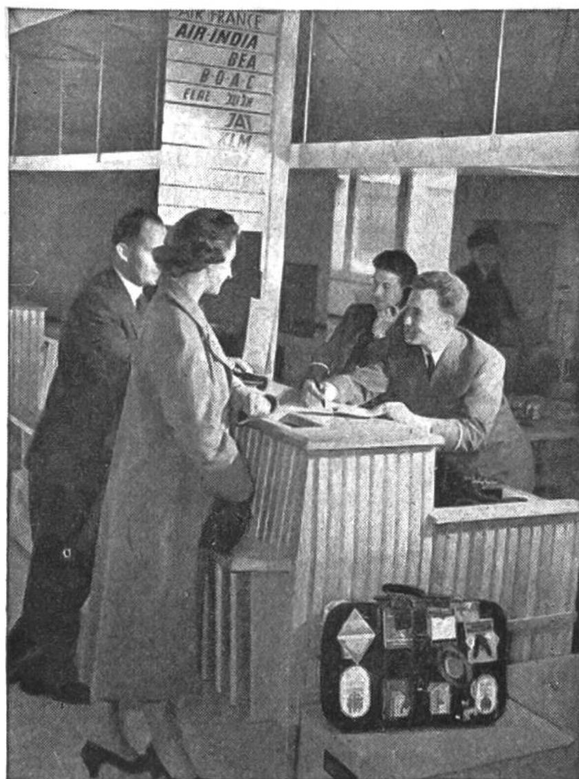
Kontrollieren der Flugscheine am Schalter vor dem Abflug und Abfertigung des Gepäcks.