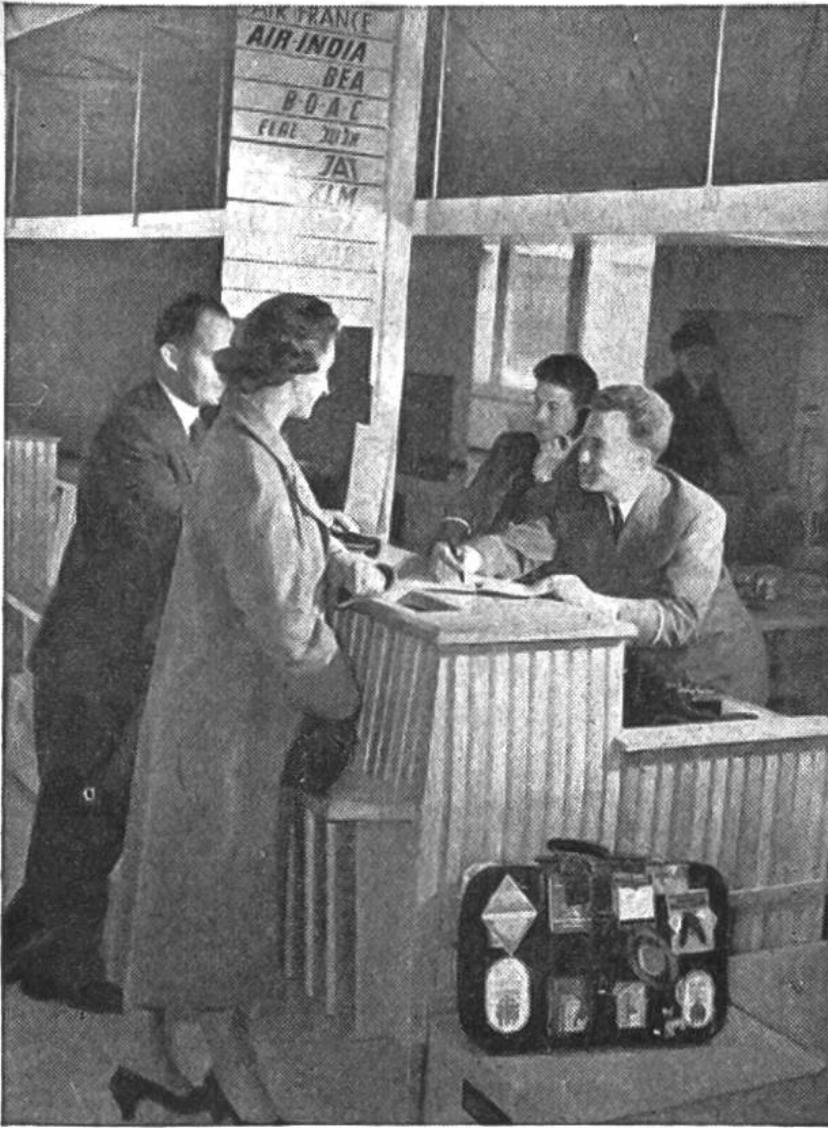
Kontrollieren der Flugscheine am Schalter vor dem Abflug und Abfertigung des Gepäcks.