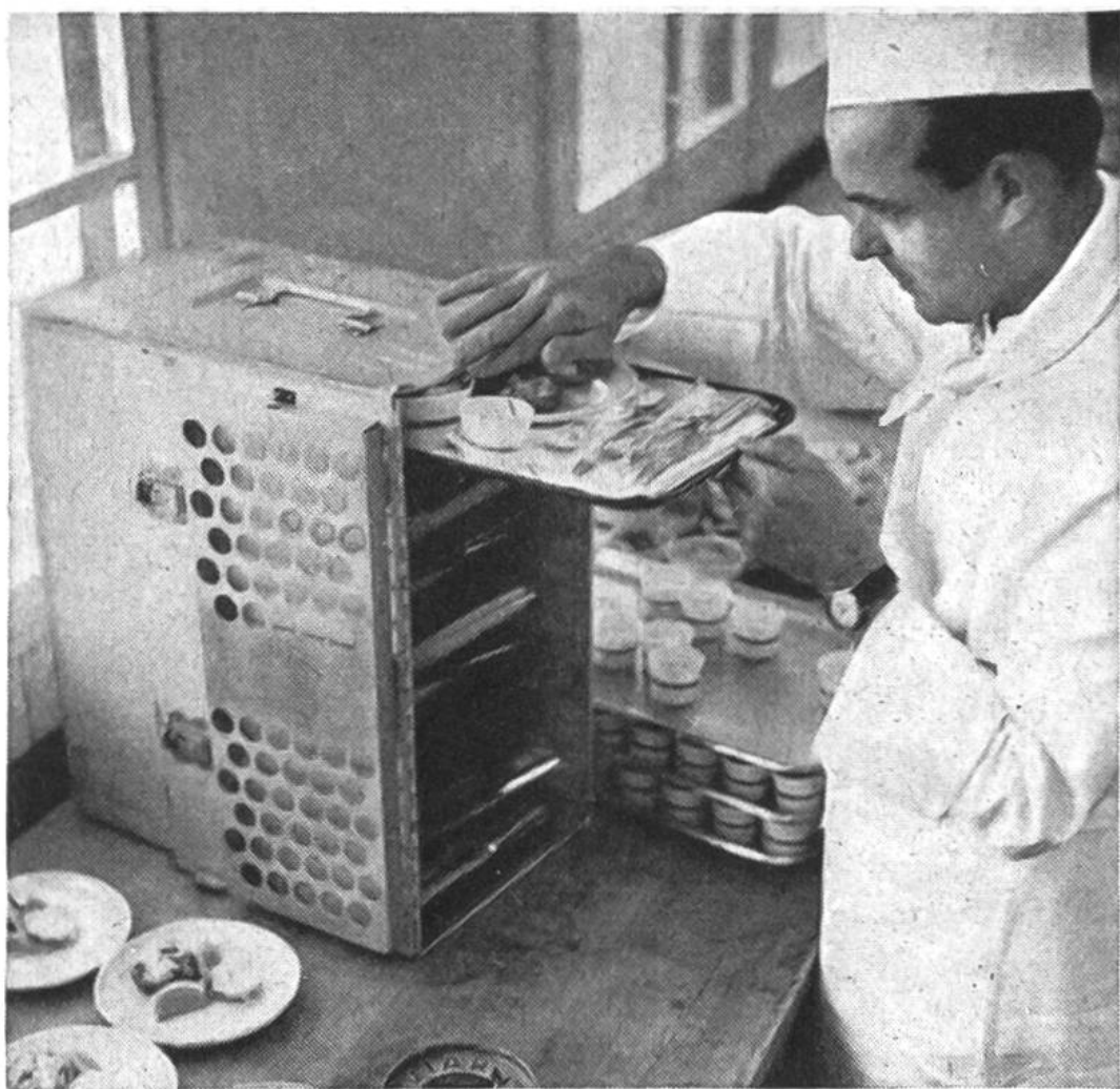
Die in der Flughafenküche zubereiteten Mahlzeiten werden nachher im Flugzeug den Gästen serviert.

Jede Vertretung zählt unter ihren Mitarbeitern Schweizer und Einheimische.