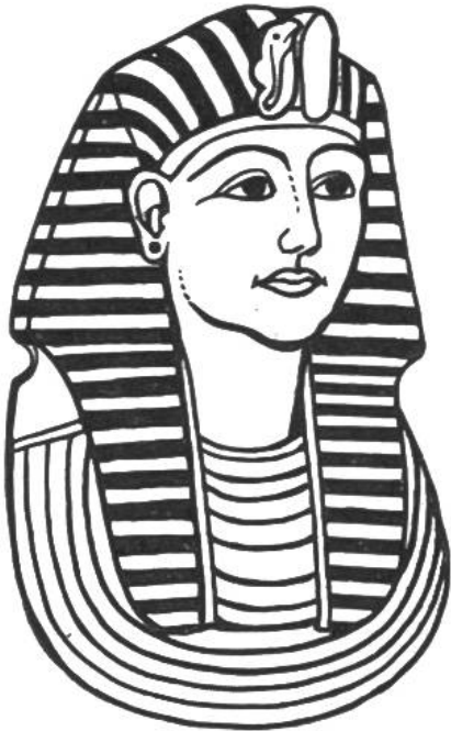
Kopf des ägyptischen Königs Tut-ench-Amun

bis zum Beginn der Völkerwanderung, 375 Jahre nach Christus