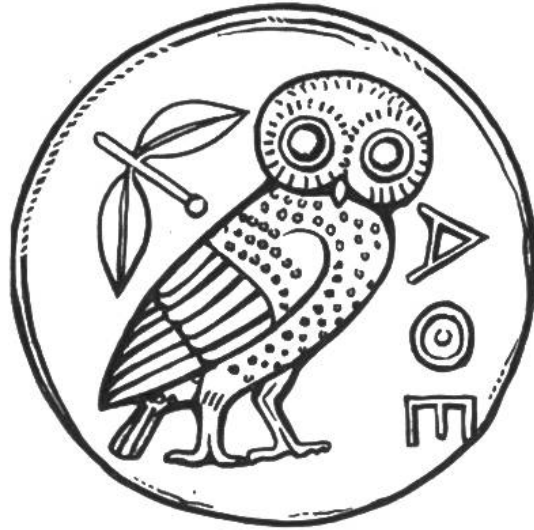
Münze von Athen