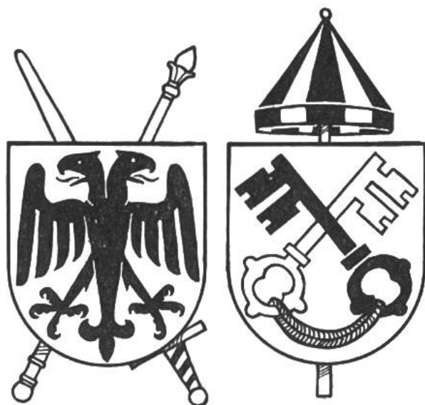
Die Wappen von Kaiser und Papst