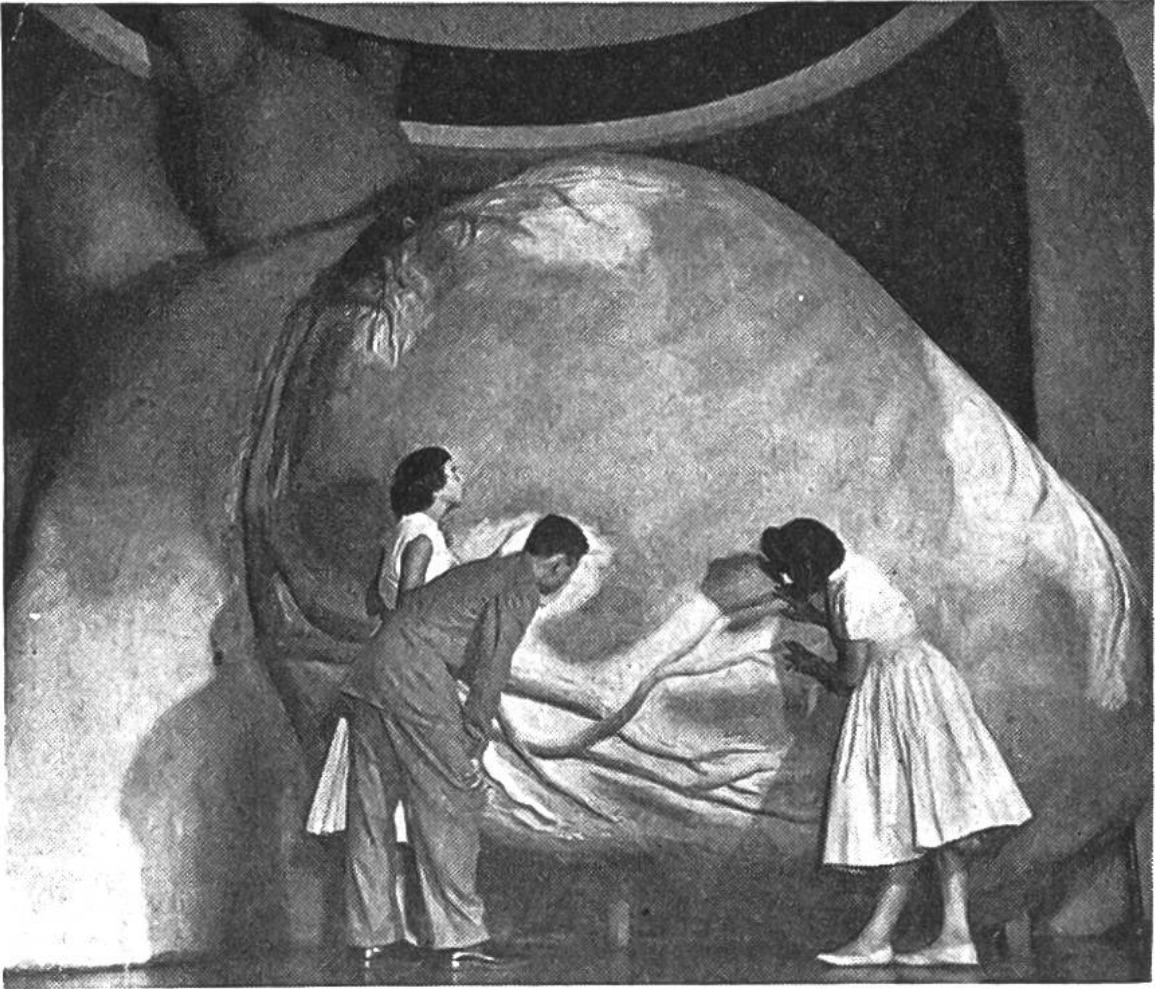
Das Herzmodell im Franklin-Institut, Philadelphia. Grosse Blutgefässe müssen den Herzmuskel, der unermüdlich arbeitet, mit Blut und damit mit den nötigen Nährstoffen versehen; denn auch er muss seine Kraft irgendwoher bekommen.