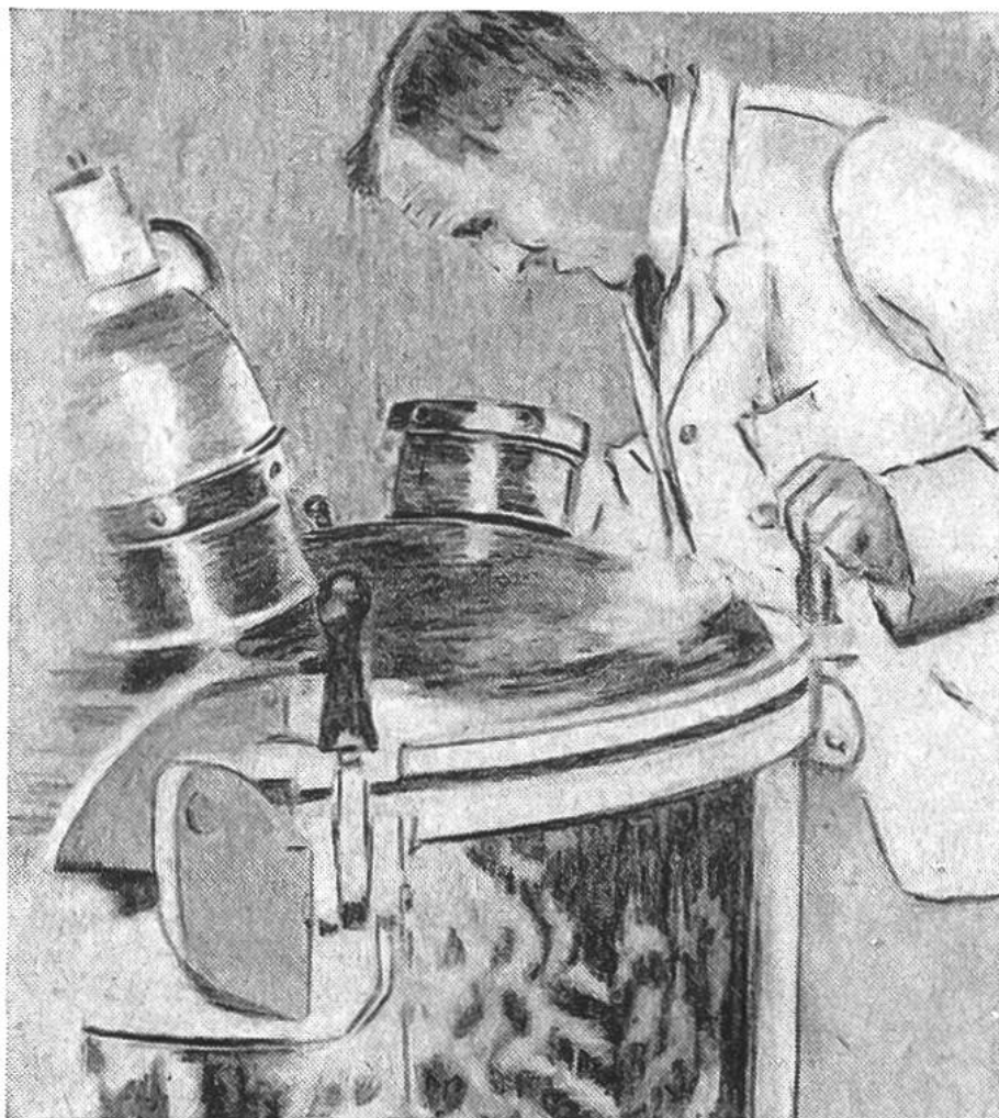
Überwachung des Uperisations- vorganges am Expansionsgefäß.

des 19. Jahrhunderts fällt, hat dann weitgehend das Verständnis für das Verhalten der Milch unter verschiedenen Aufbewahrungsbedingungen gefördert. Es wurde klar, dass alle unerwünschten Veränderungen der Milch auf der Tätigkeit verschiedener Arten von Mikroorganismen (kleinsten Lebewesen) beruhen. Der französische Forscher Louis Pasteur hat in den sechziger Jahren des letzten Jahrhunderts entdeckt, dass Bier und Wein durch Erhitzung auf Wärmegrade unterhalb 100^{\circ}\text{C} während einer gewissen Zeit vor dem Verderben geschützt werden können. Versuche mit Milch zeigten, dass vor allem die pathogenen, d. h. krankheitserregenden Keime abgetötet wurden, eine Erhöhung der Haltbarkeit jedoch nicht zu erreichen war. Dieses Erhitzungsverfahren, später als Pasteurisierung bezeichnet, hat im besondern in seiner Anwendung auf Milch eine weltweite Ausdehnung angenommen. Mit der Entwicklung der Hygiene erstrebte man eine von krankmachenden Bakterien möglichst freie Milch, ein Ziel, welchem