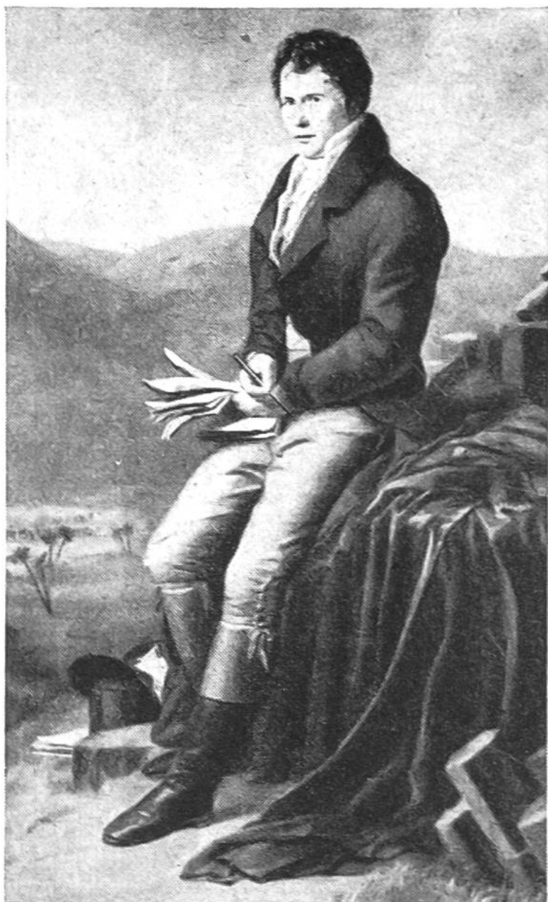
Der junge Alexander von Humboldt in Südamerika, nach einem Gemälde von Karl von Steuben.